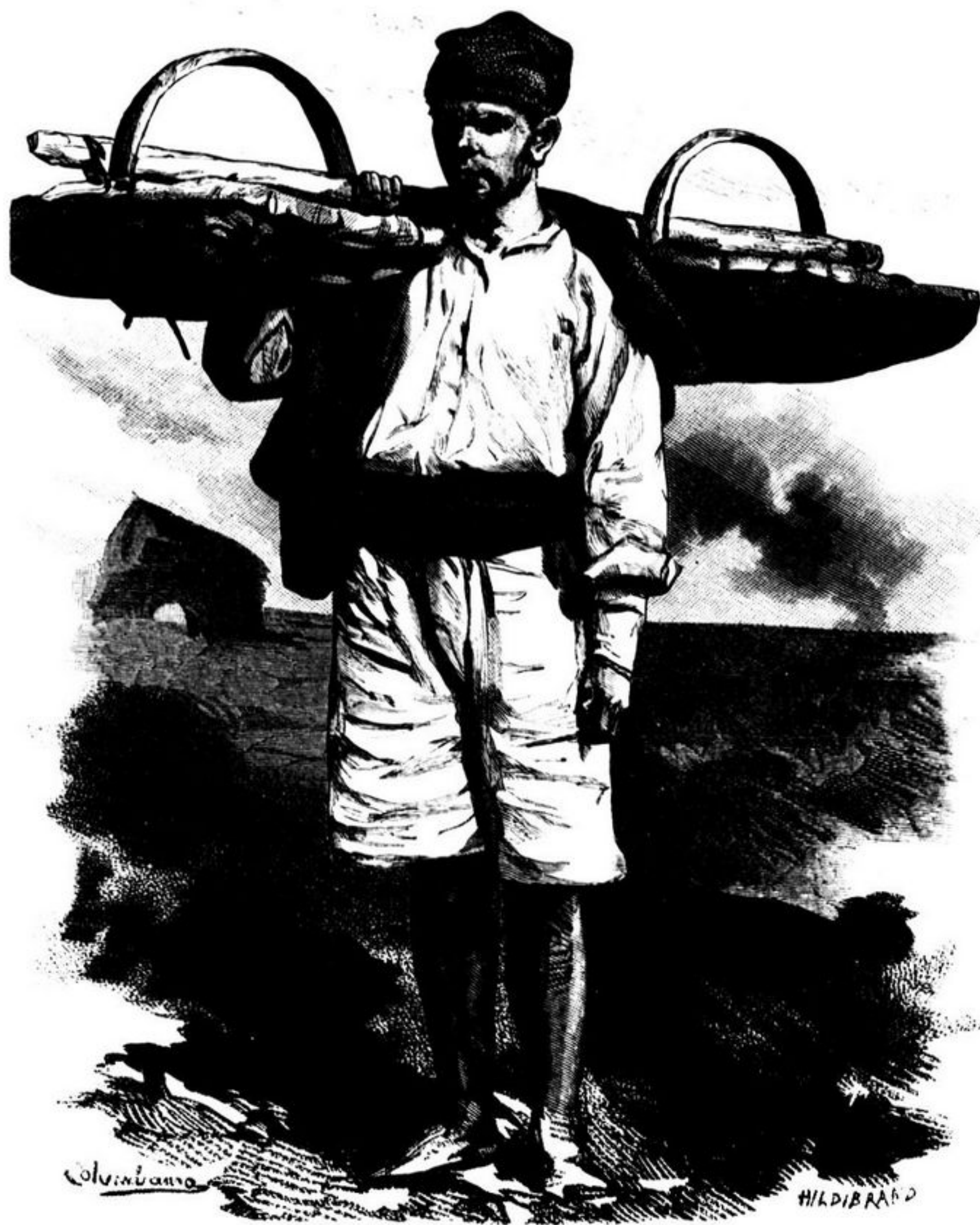
COSTUMES PORTUGUEZES: — O VARINO