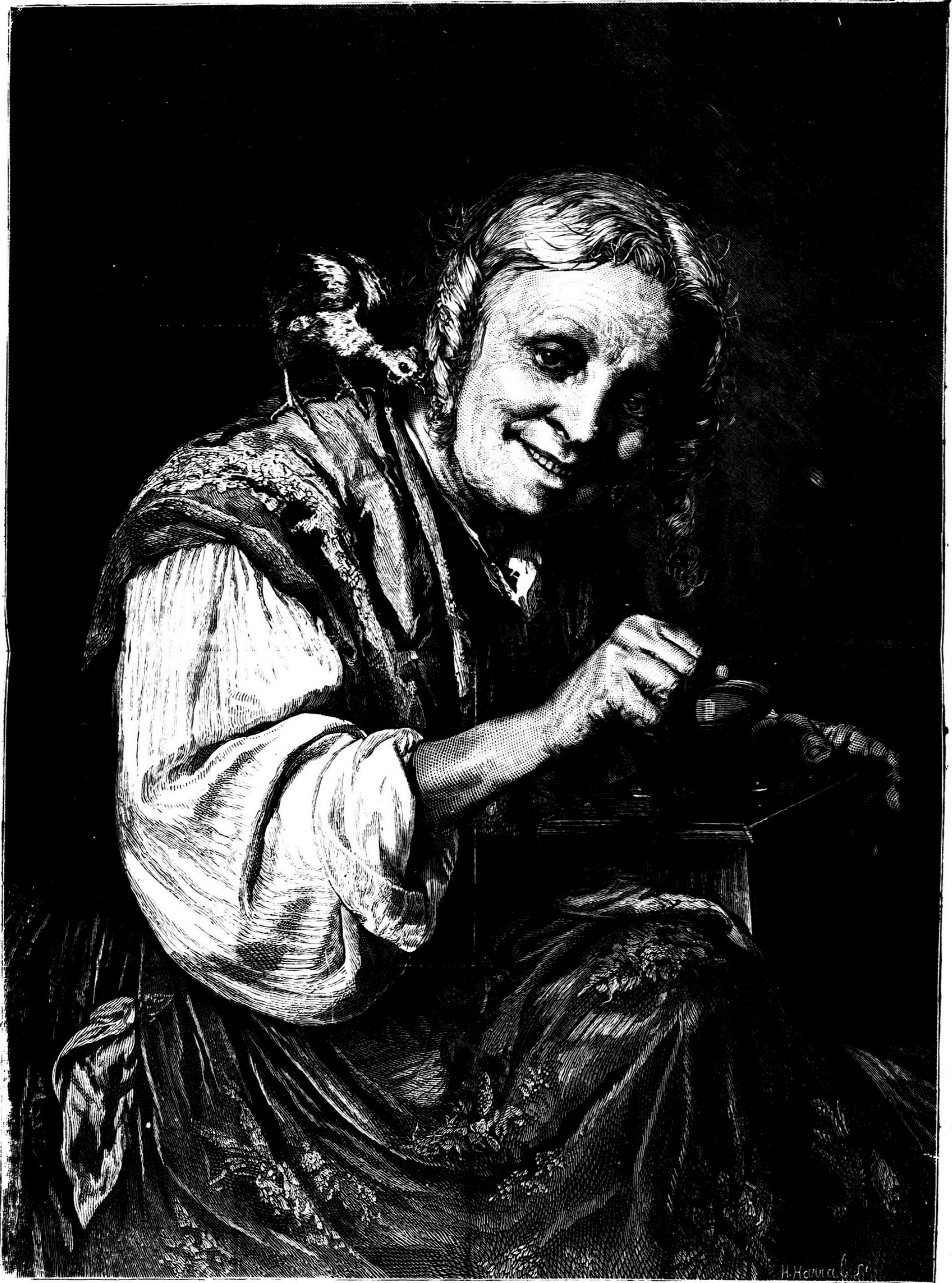
UM AMIGO DA CASA