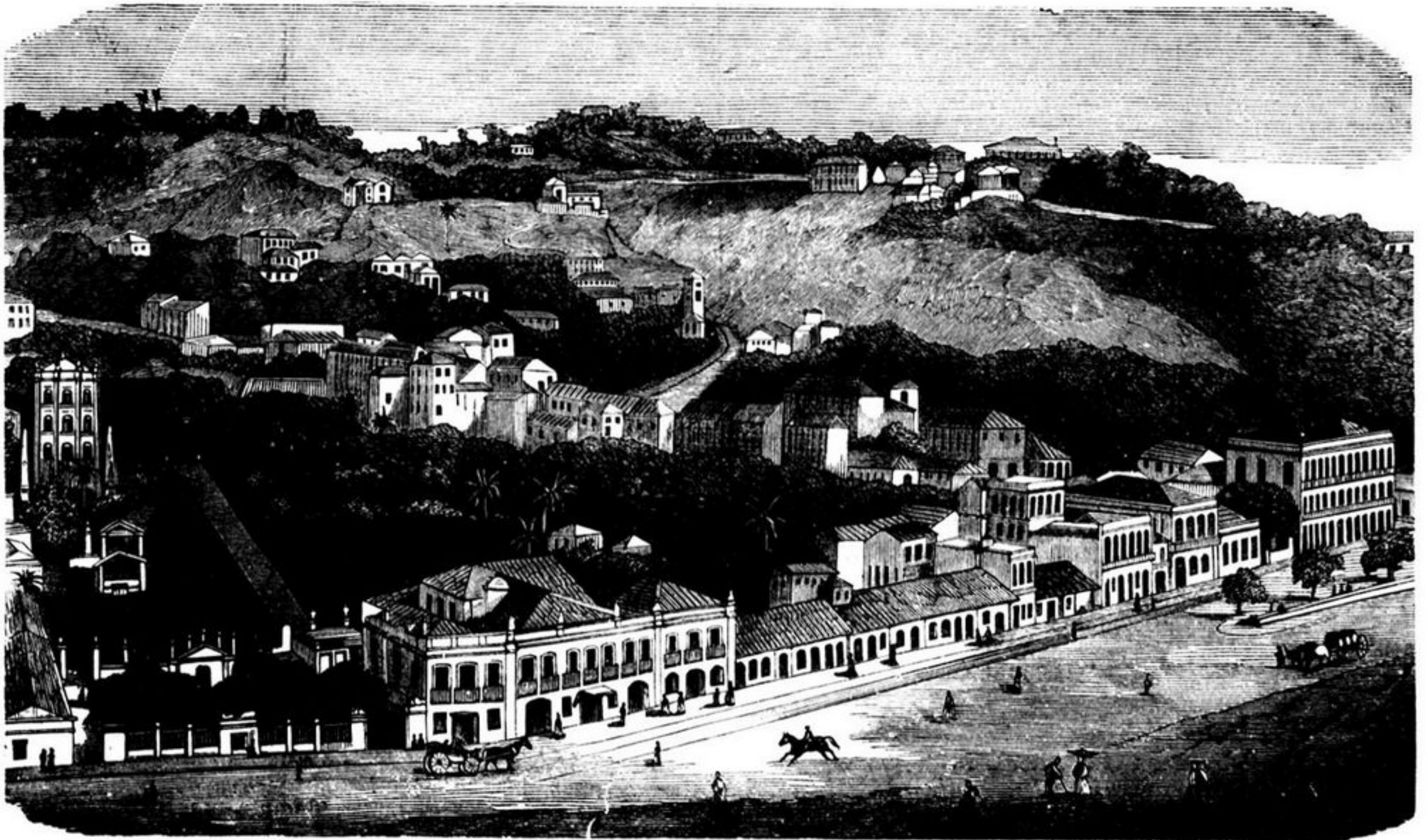
RIO DE JANEIRO — CATETE

Os discipulos viram-n'o cambaleiar e segurar-se á mesa para não cair.