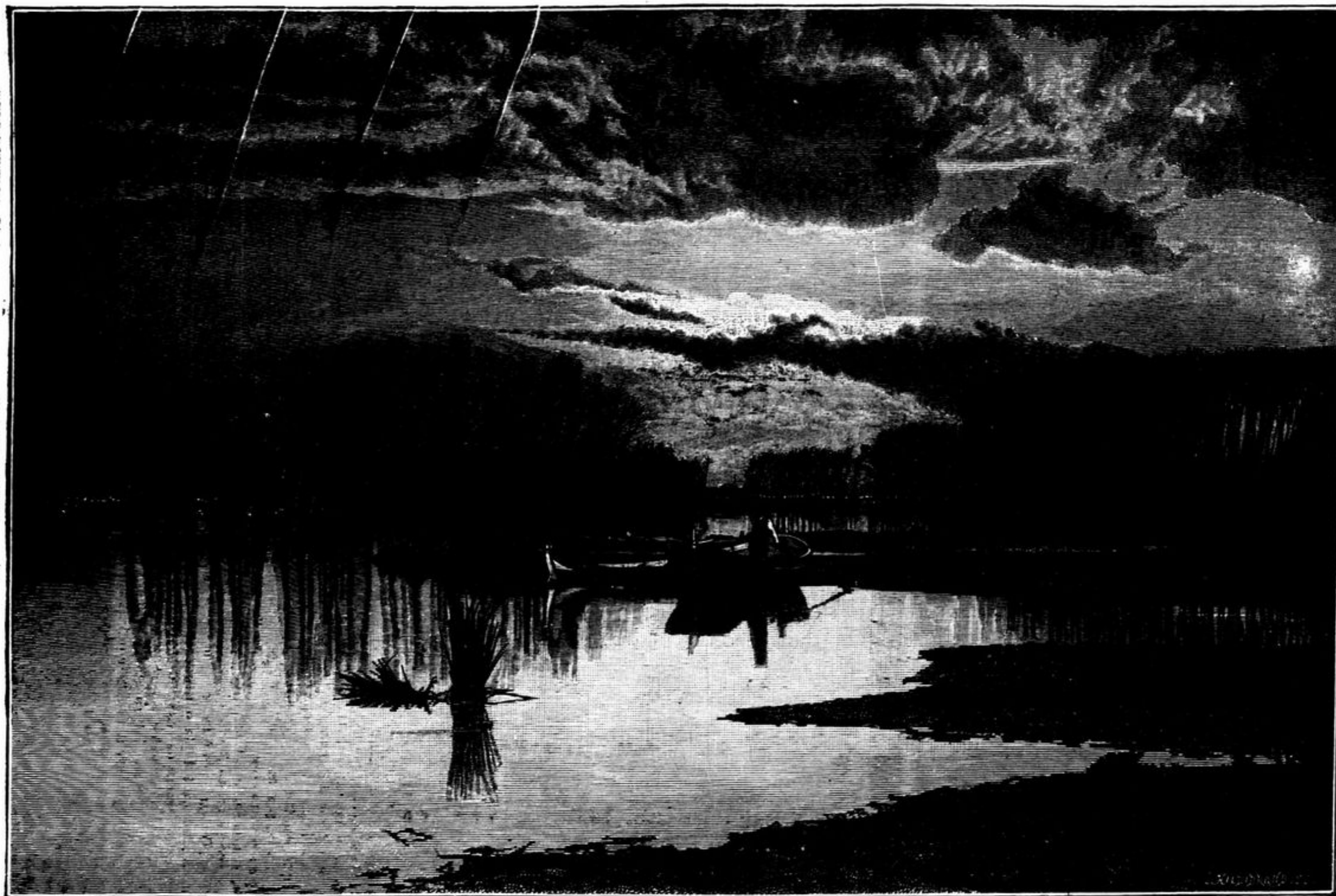
ARREDORES DA GOLLEGÃ