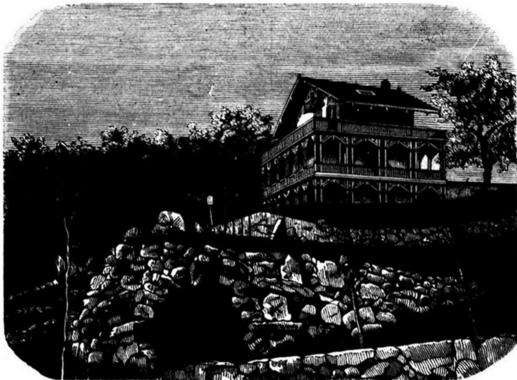
O CHALET DO PALACIO DE CRYSTAL DO PORTO