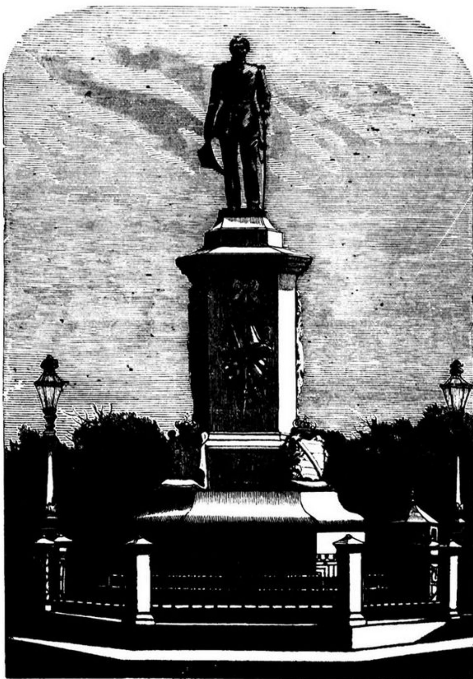
MONUMENTO DE D. PEDRO V, NO PORTO

Cuidavam todos que os aragonezes, esses valentes lendarios da Edade Media, tinham já desafivelado as armaduras com que foram á conquista de Napoles para garantir o seu dominio no Mediterraneo. Suppunha-se que