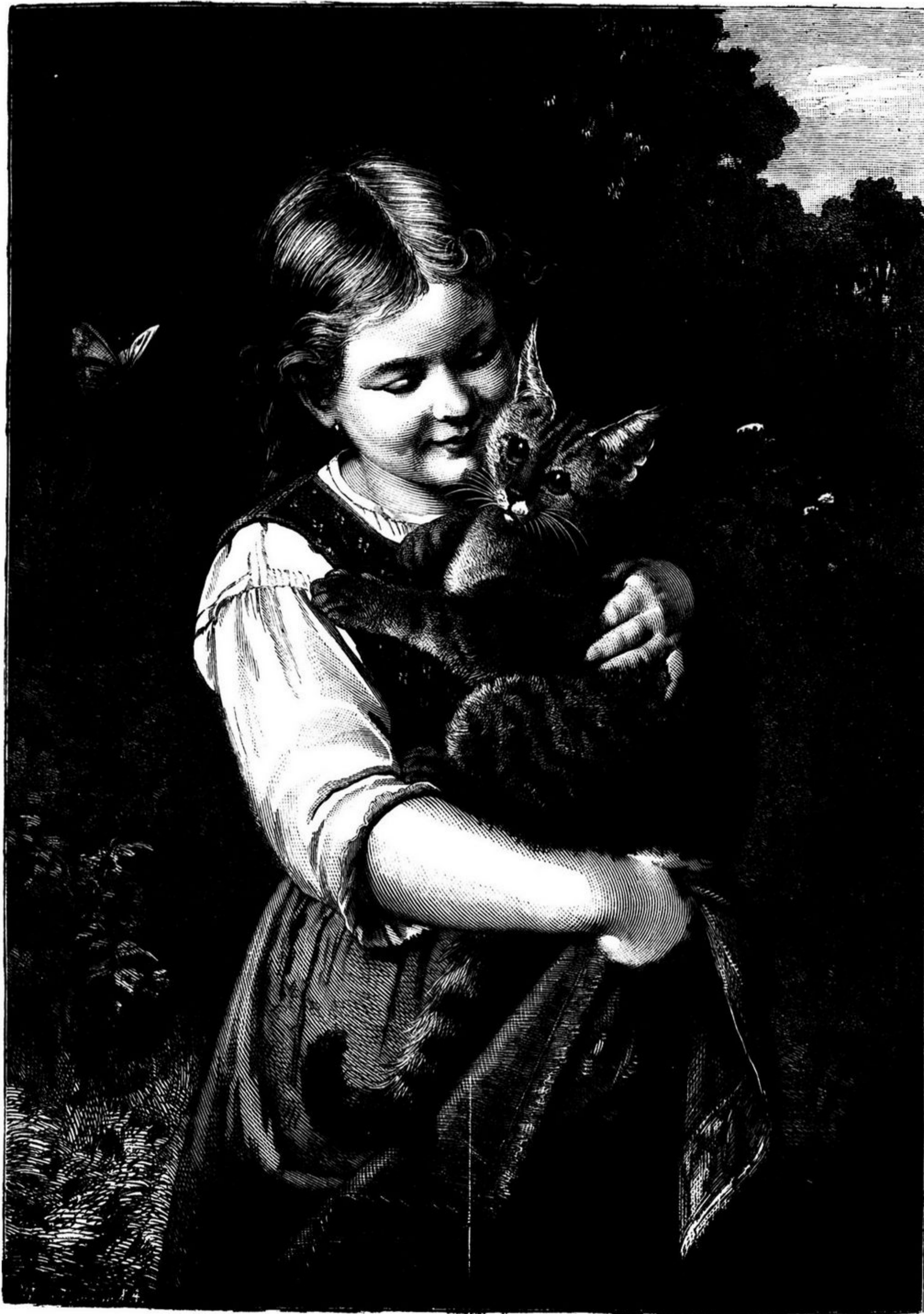
A INFANCIA E A MALICIA