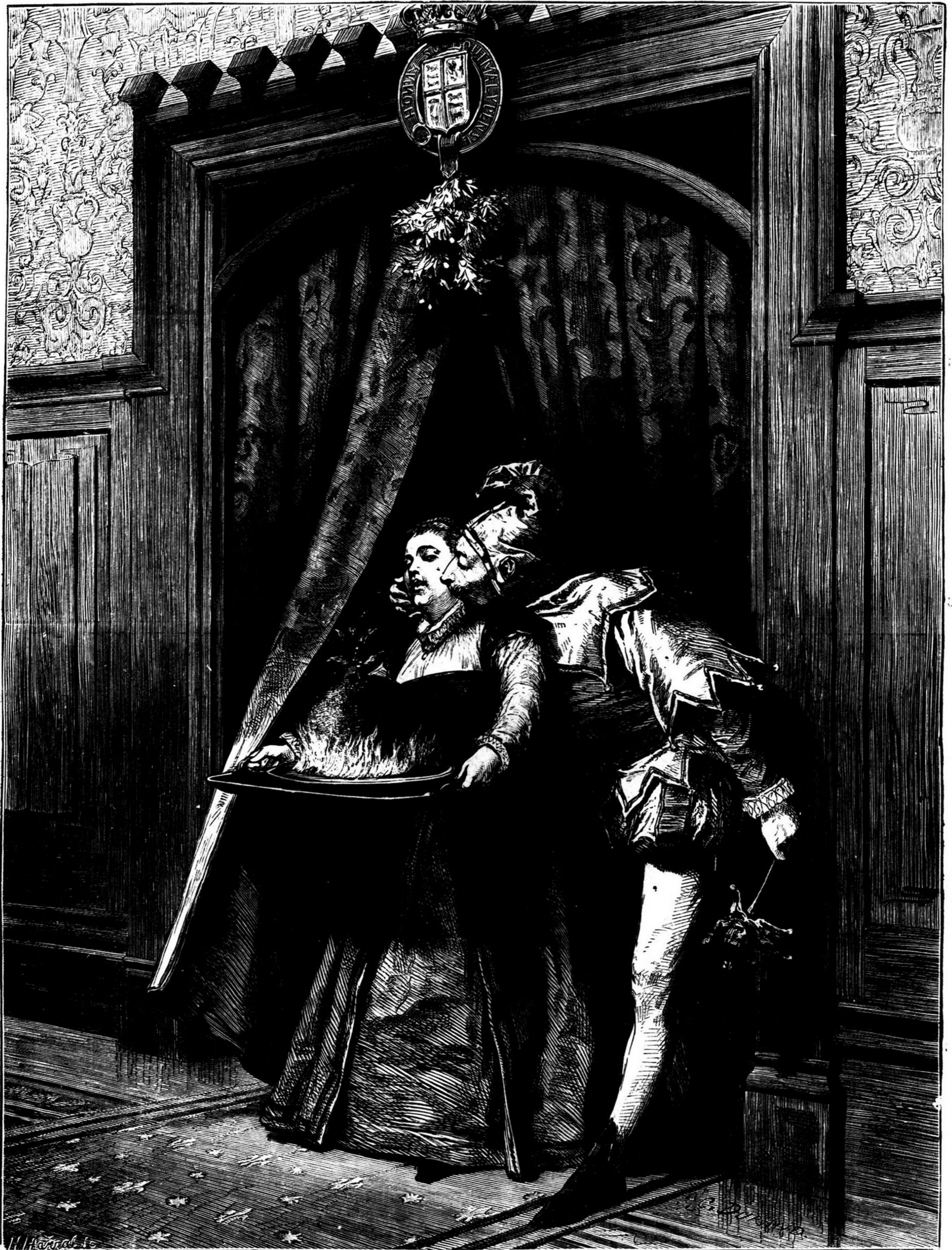
A VINGANÇA DO BOBO