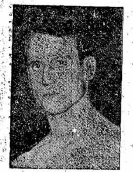
O boxeur Americano, que combate...