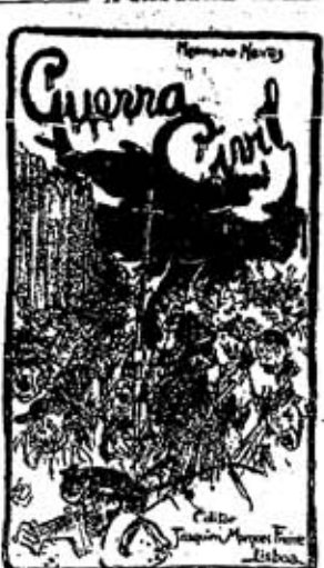
Preço 300 reis Todos os pedidos devem ser dirigidos ao escriptorio e deposito, rua do Loreto, 61, 1.º - Lisboa.