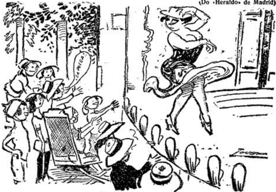
Uma matiné infantil, n'um animatographo com variedades...