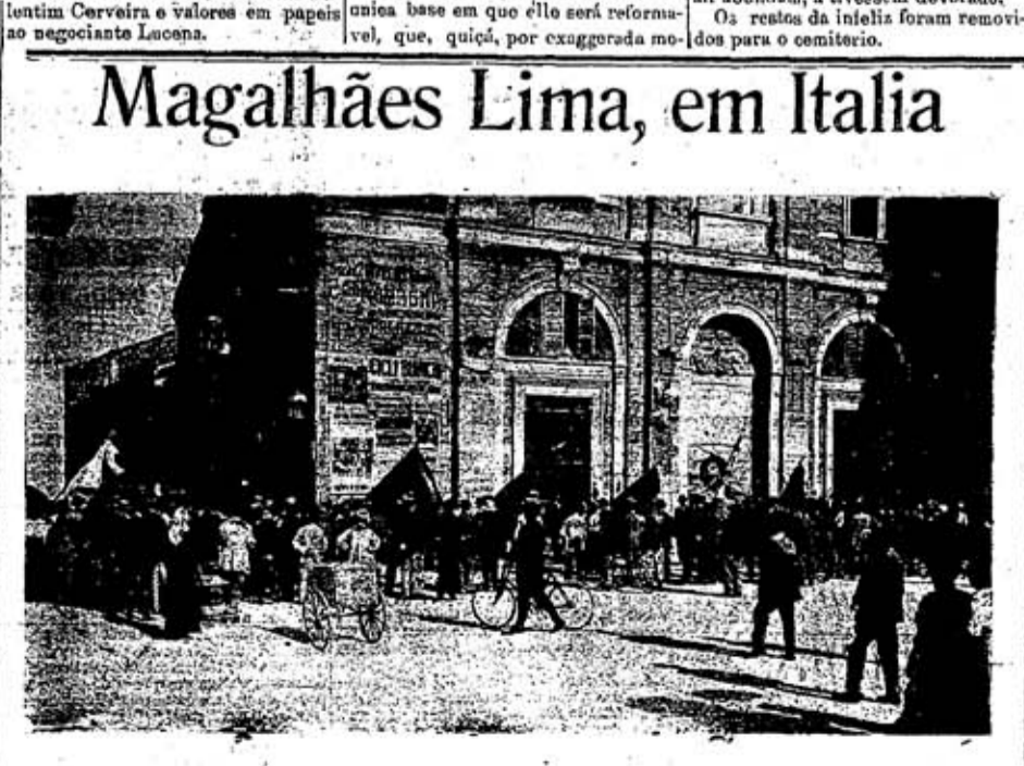
Organização do cortejo em honra do eminente republicano português, á sua chegada a Ravenna. (Vej-se a Capital do dia 12)