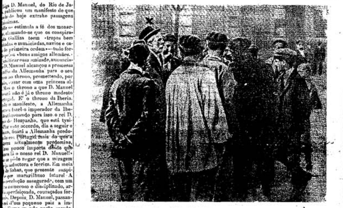
O deputado e chefe do partido socialista Pablo Iglesias, (+) conversando com os grévistas de Bilbao.

Logo D. Manuel, do Rio de Janeiro, publicou um manifesto de que hoje extrai passagens interessantes. «... estimula a fé dos monarchistas, clamando-se que os conspiradores de Gallaiza teem tropas bem organizadas e municadas, navios e canhões de primeira ordem...»—tuio forçosamente «bons amigos allemaes»... «...»