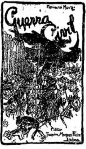
Proço 300 reis Todos os pedidos devem ser dirigidos ao escriptorio e deposito, rua de Loreto, 61, L. e Lisboa.

Na artigo, que hontem aqui escrevi, a este jornal, disse, o repito-o hoje o mais claramente possivel, que a reforma orthographica, ultimamente estabelecida em portaria no Diario do Governo, é a cousa mais inaceitavel, que poderia surgir em cerebros de homens de sciencia. Mas é tambem a medida mais anti-politica, que poderia ser pensada por politicos, na verdadeira accepção d'esta palavra.