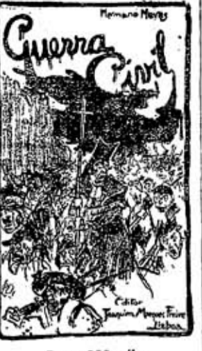
Preço 300 réis

Um padre republicano insultado por ter aceitado a pensão