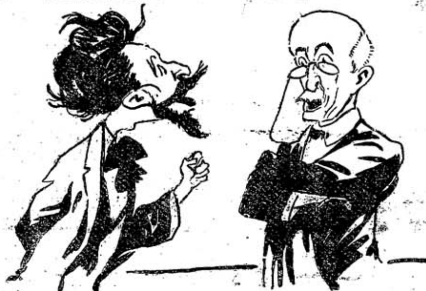
Thalassa—Sim senhor, podem limpar a mão á parede!... Oito dias para conseguirem organizar ministério e é o primeiro da Republica...

Jacobino—O seu pedaço de burro, pois você não vê que se gastaram seculos para se conseguir o primeiro ministério monarchico?!