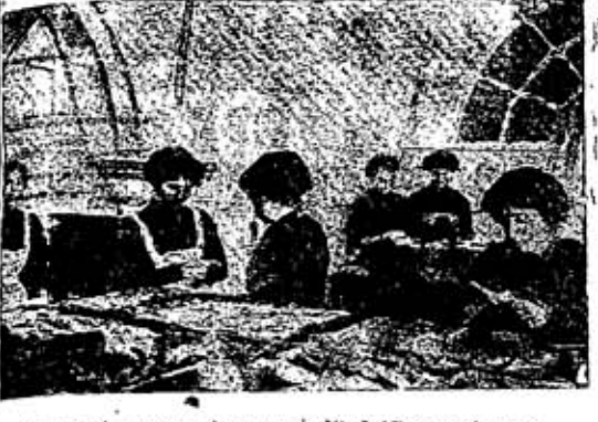
A secção feminina da Junta de Crédito Público funcionando

como, em busca de impressões alheias, um jornalista topa impressões próprias e, aliás, bem pouco agradáveis