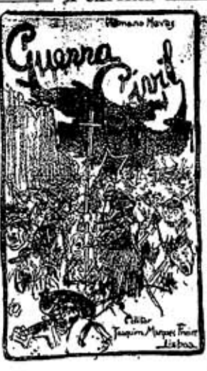
Preço 300 réis. Todos os pedidos devem ser dirigidos ao escriptorio e deposito, rua do Loreto, 51, 1.ª - Lisboa.

Anniversario da Republica. Festas promovidas pela Camara Municipal de Lisboa oem que ella tomara parte.