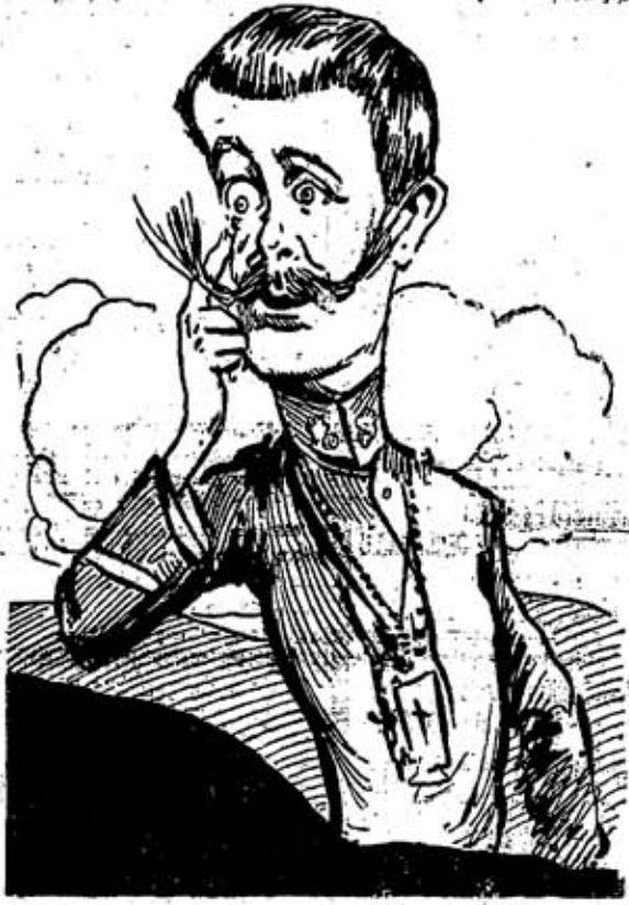
—Isso tentam elles, que são crissos!...

Respondendo ás saudações da multidão que hontem o foi cumprimentar em consequencia do reconhecimento da Republica pelas mais importantes monarchias europeias, o sr. João Chagas, presidente do conselho, declarou: «A Republica está consolidada e forte. E' preciso que comecemos agora novas eras de ordem, de paz e de trabalho.»