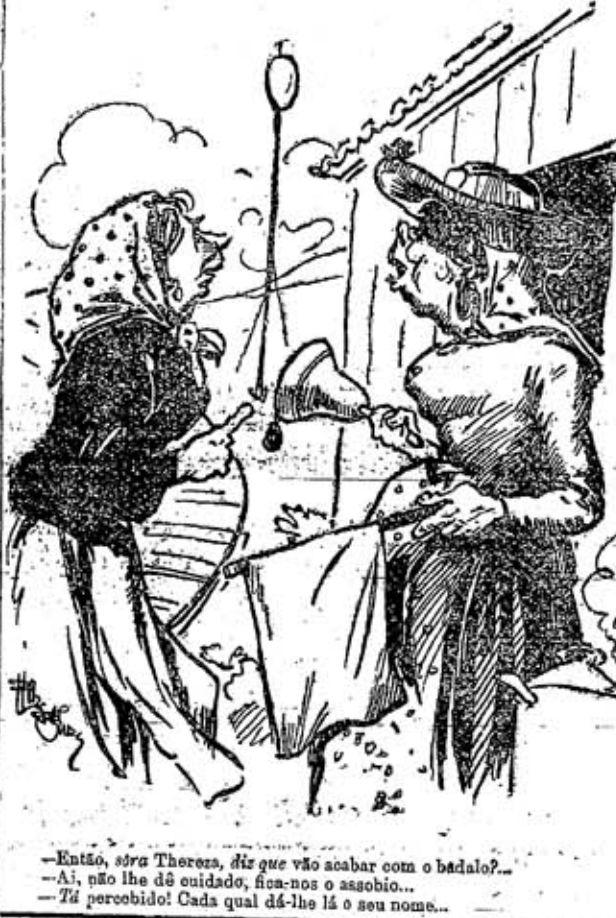
-Então, sr. Theresa, diz que vão acabar com o badalo? -Ai, não lhe dê cuidado, fica-nos o assobio... -Tá percebido! Cada qual dá-lhe lá o seu nome...