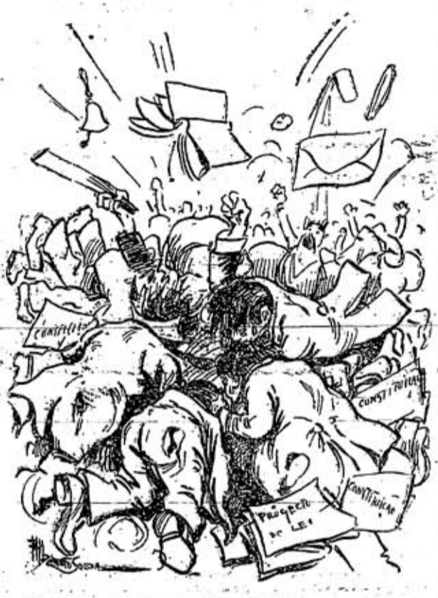
Ordem do dia das ultimas sessões.—Desordem.