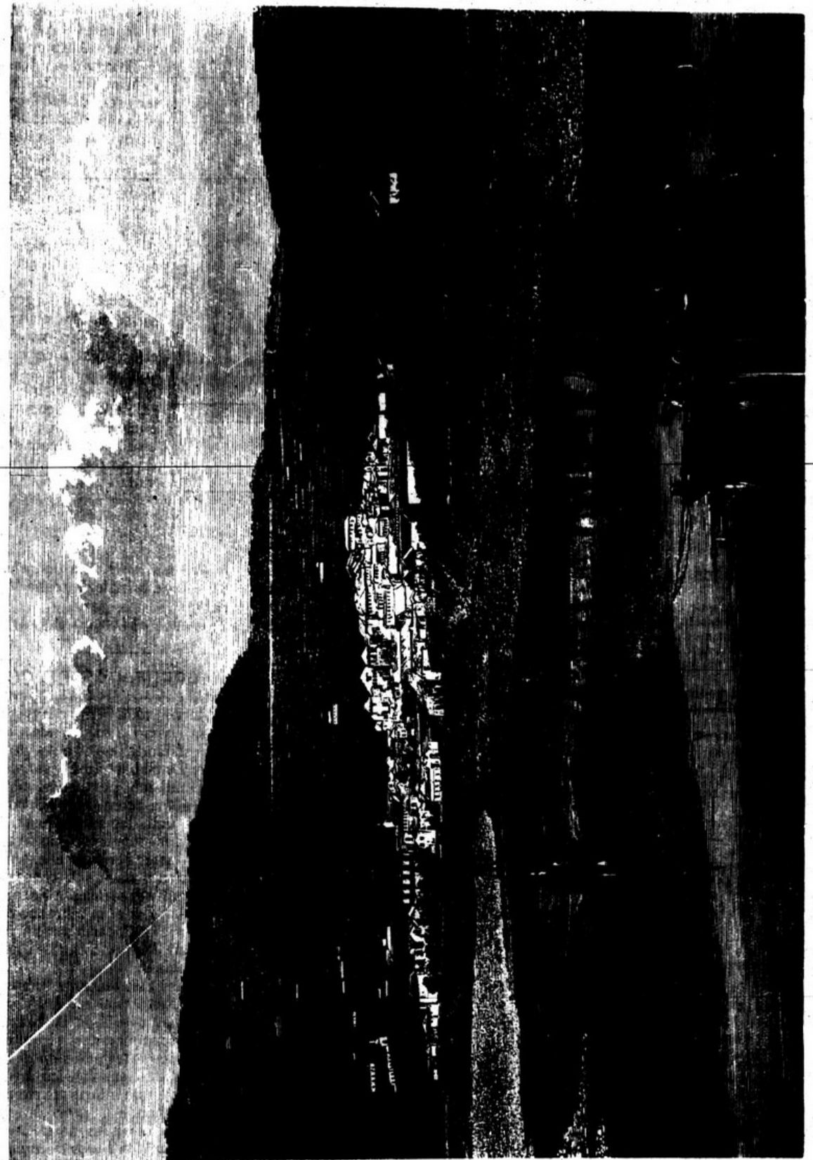
VISTA DA RECOA.