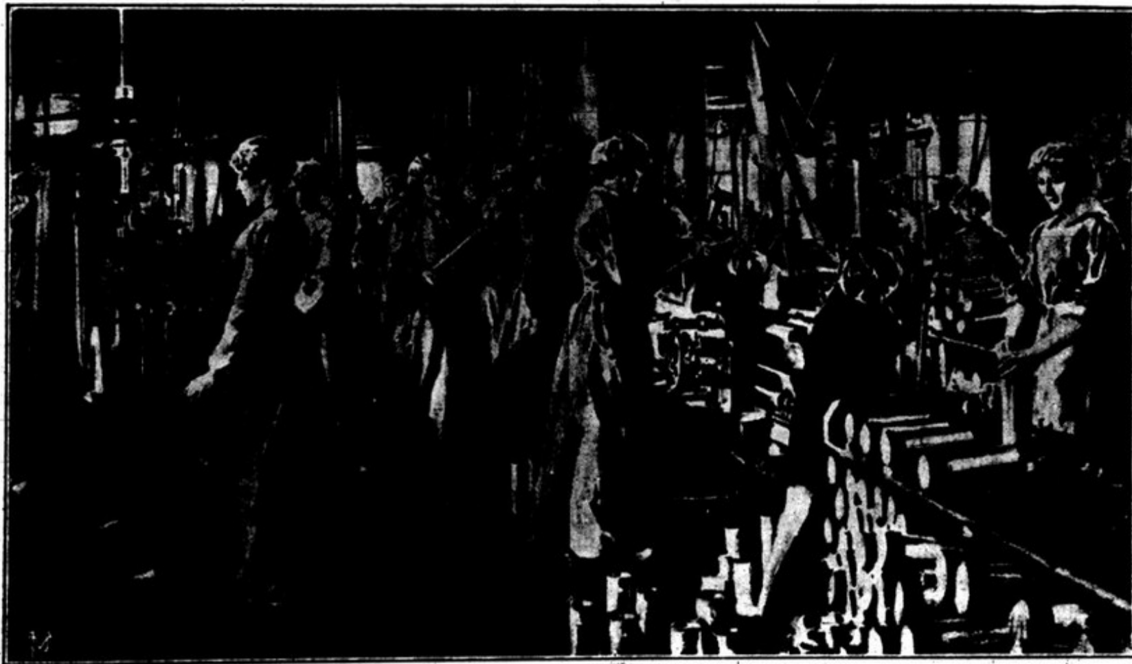
SENHORAS INGLÊSAS FABRICANDO MUNIÇÕES PARA A GUERRA