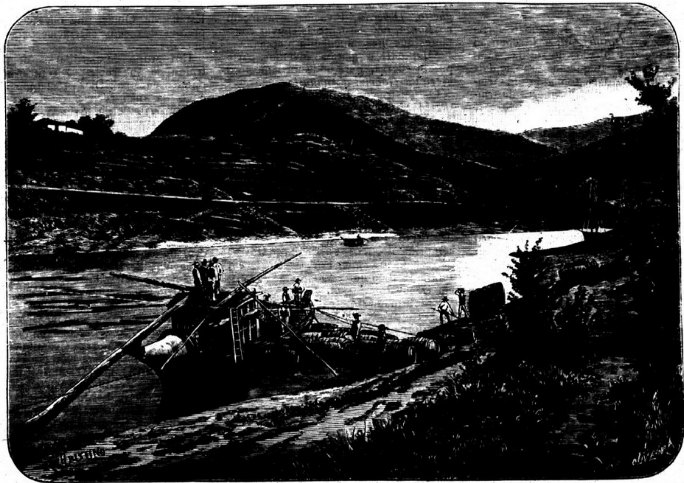
EMBARQUE DE VINHOS EM PINHÃO.