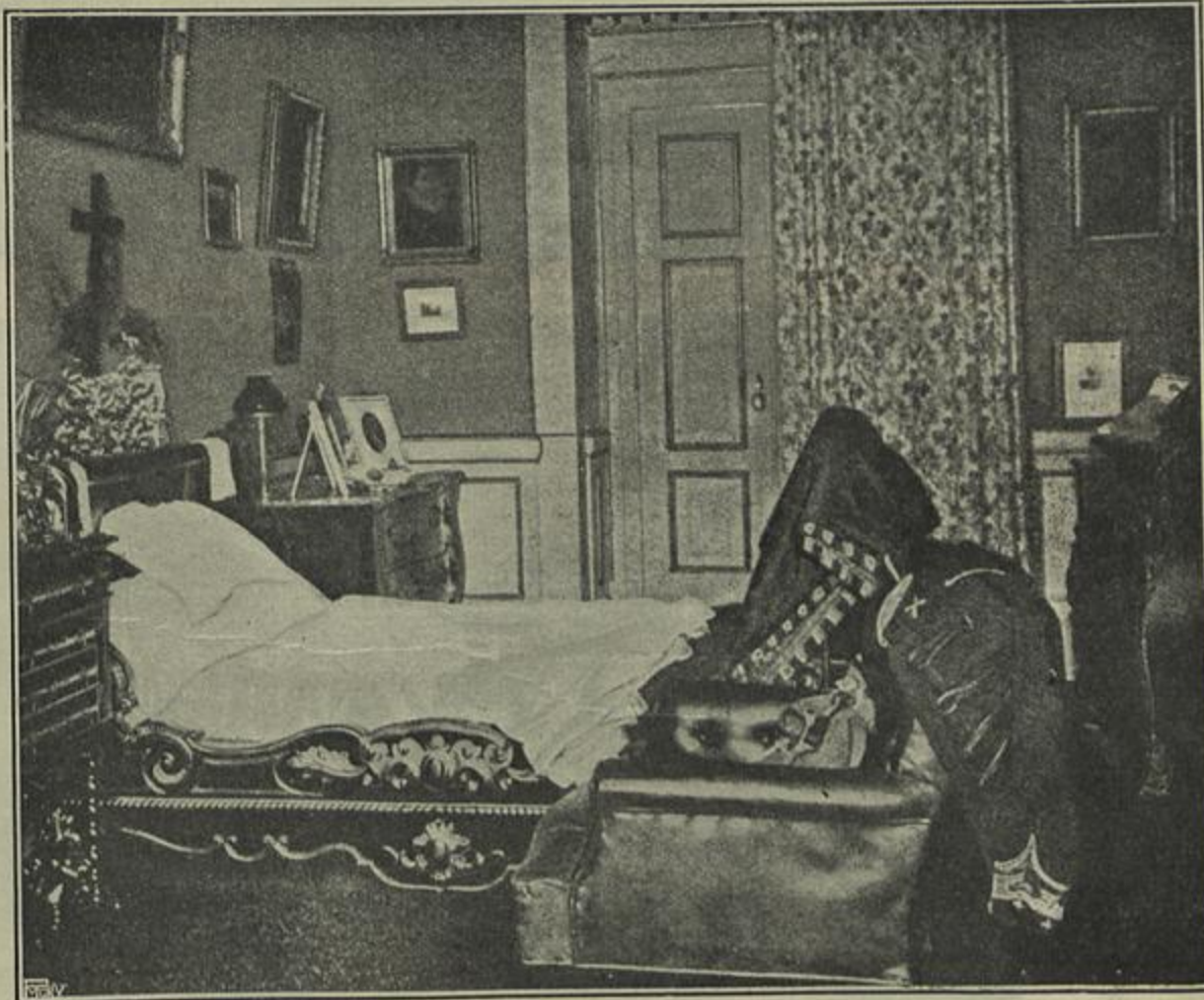
O QUARTO DE CAMA DO SR. D. MANUEL, COMO FICOU DEPOIS DA SUA SAHIDA DO PALACIO DAS NECESSIDADES

A cerimonia teve logar no antigo e historico paço de Belem, escolhido pelo governo para estes actos solemnes, e de certo o antigo solar dos Côrtes Reaes e depois paço real, que D. João V ampliou e embelesou com obras de arte, algumas das quaes se perde-