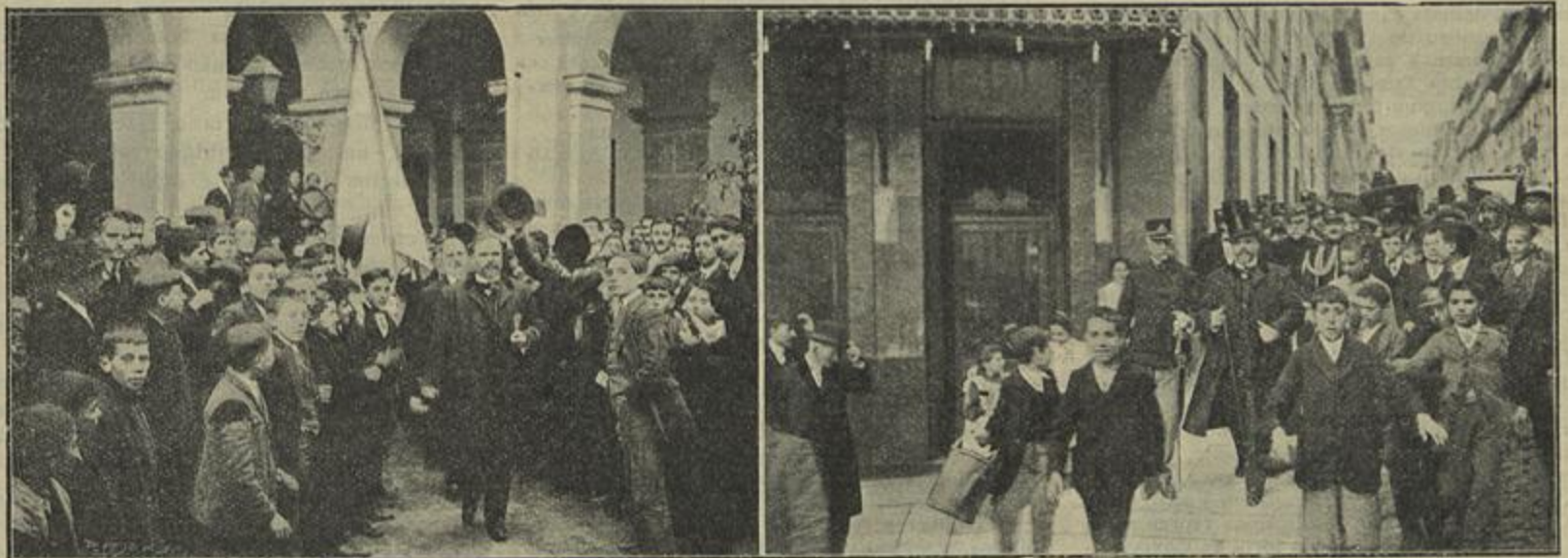
O MINISTRO DO INTERIOR NA BIBLIOTECA MUNICIPAL — OS MINISTROS DO INTERIOR E DA GUERRA NAS RUAS DO PORTO