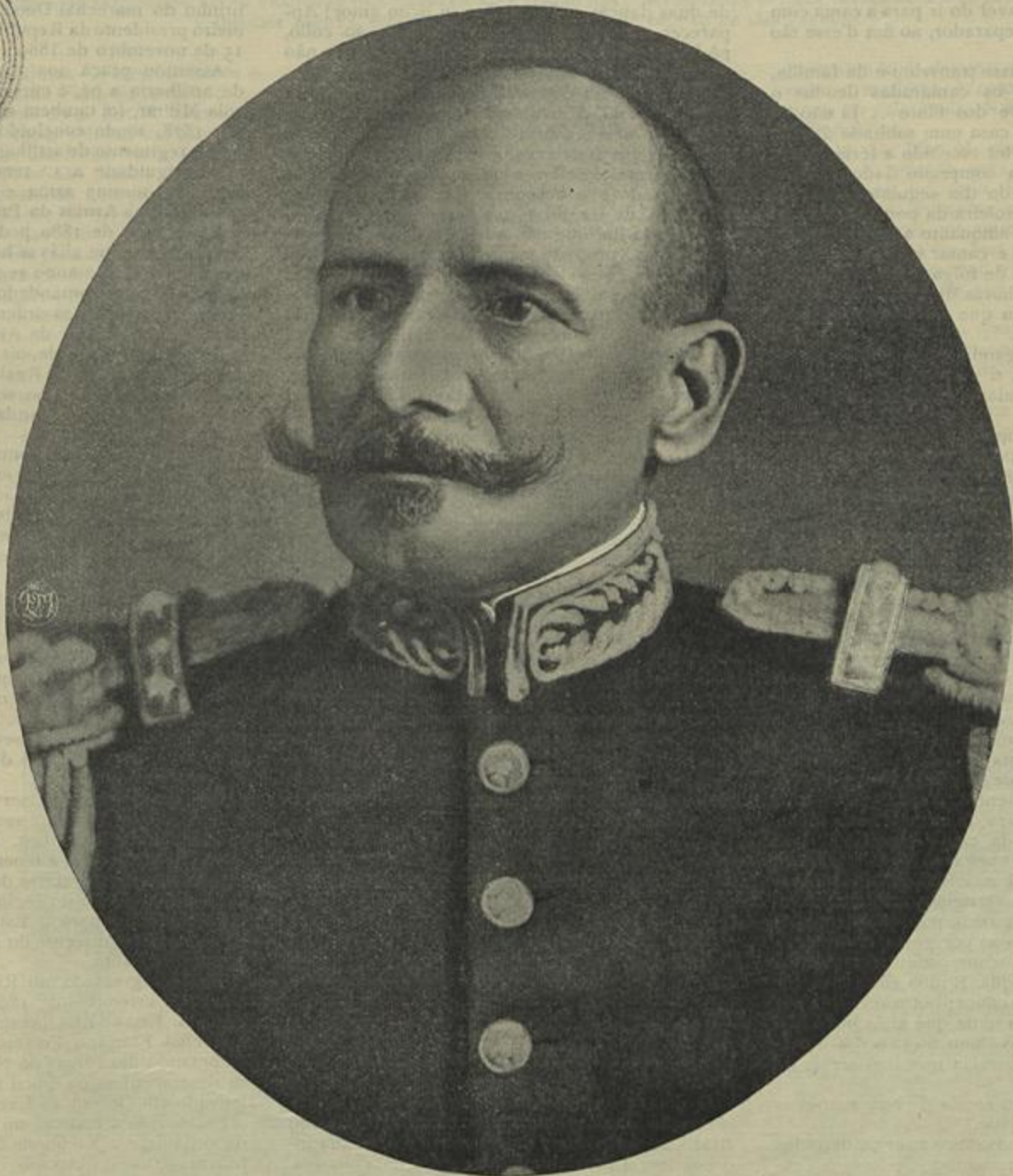
MARECHAL HERMES DA FONSECA

NOVO PRESIDENTE DA REPUBLICA DOS ESTADOS UNIDOS DO BRASIL, QUE TOMOU POSSE EM 15 DO CORRENTE