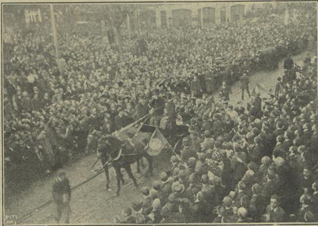
O POVO ACLAMANDO OS MINISTROS NA SUA PASSAGEM PARA A CAMARA MUNICIPAL