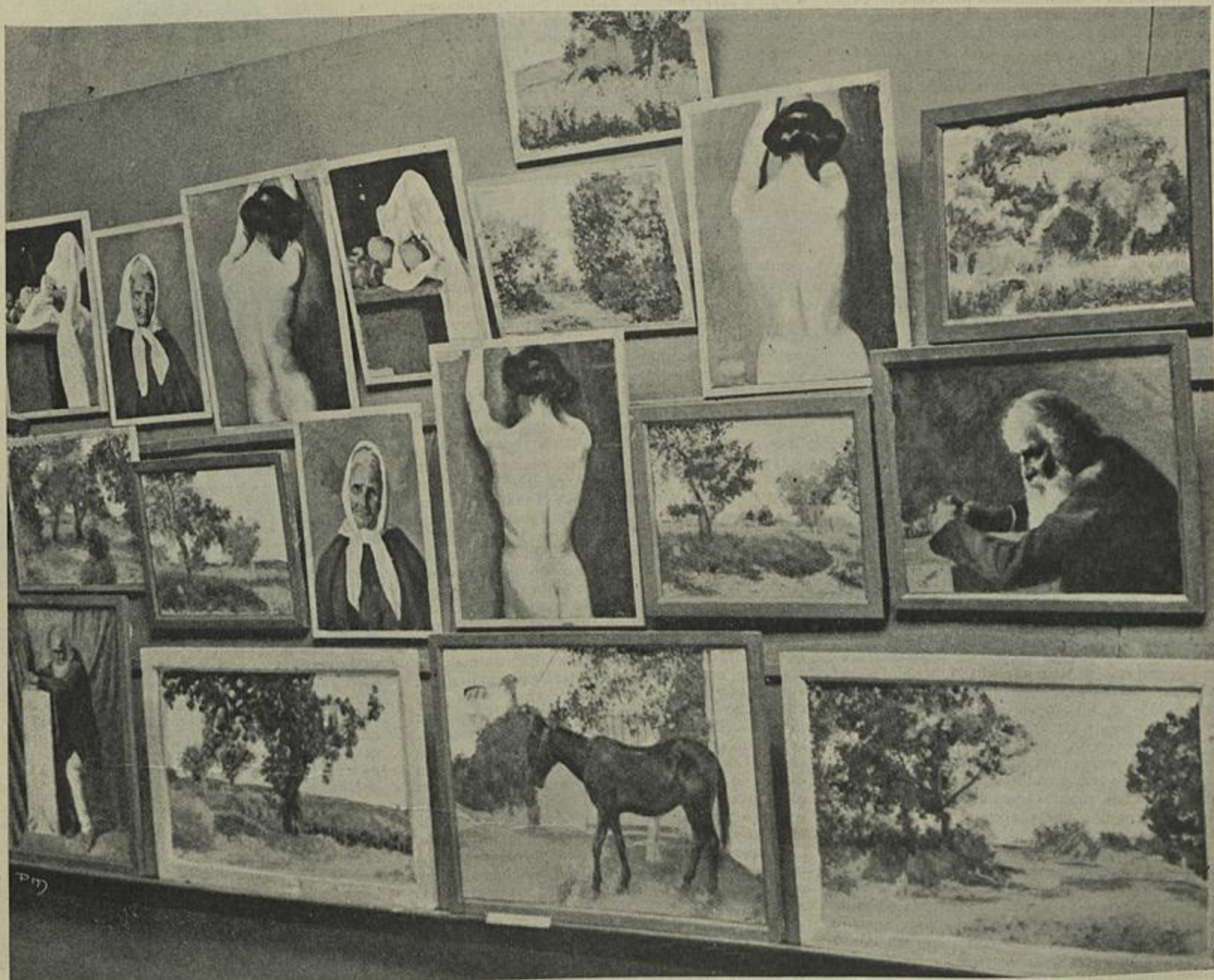
UM ASPETO DA EXPOSIÇÃO

Mas se a unica continuada paciencia dos hespanhoes em soffrer antes, do que submeter-se, e a constancia n'unca desmentida em se levantarem onde houverem forças francezas que os cohibam, equivale a grandes exercitos, e unica bastaria para conquistar-lhes tarde ou cedo sua independencia; que se deve esperar, Massena, existindo