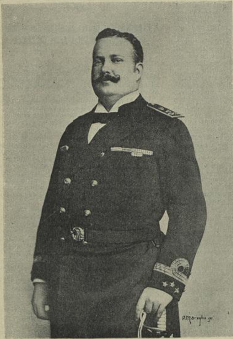
EL-REI D. CARLOS