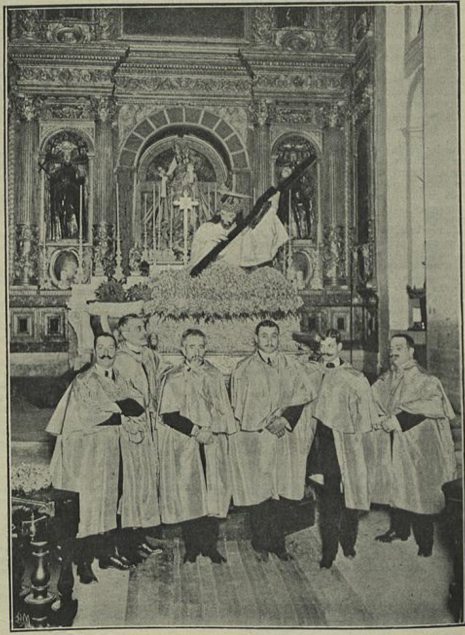
IMAGEM DO SENHOR DOS PASSOS DA GRAÇA

Definha-se a olhos vista uma população inteira, diremos mesmo um paiz inteiro; é visivel a desproporção entre os encargos de cada um e a exiguidade dos seus proventos; e, não só não se procura atenuar o mal, mas ainda com uma atroz indiferença, deshumanamente, se prosegue num