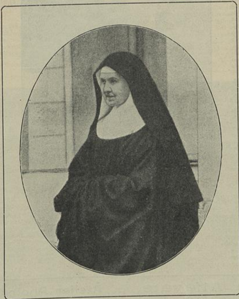
SOROR ADELAIDE DE BRAGANÇA