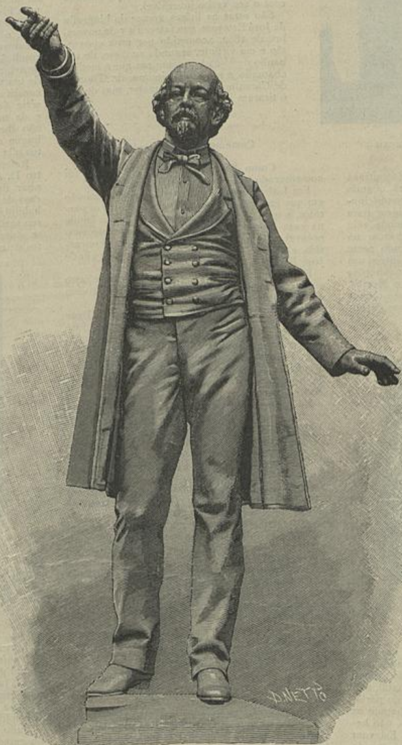
ESTATUA DE JOSÉ ESTEVAM NO SEU MONUMENTO DE AVEIRO Esculptura de Simões de Almeida

Escrevendo não tinha o mesmo poder, ainda que elle raro escrevia mas sim ditava. E' que faltava o prestigio do orador, o som da sua voz, o intencional da