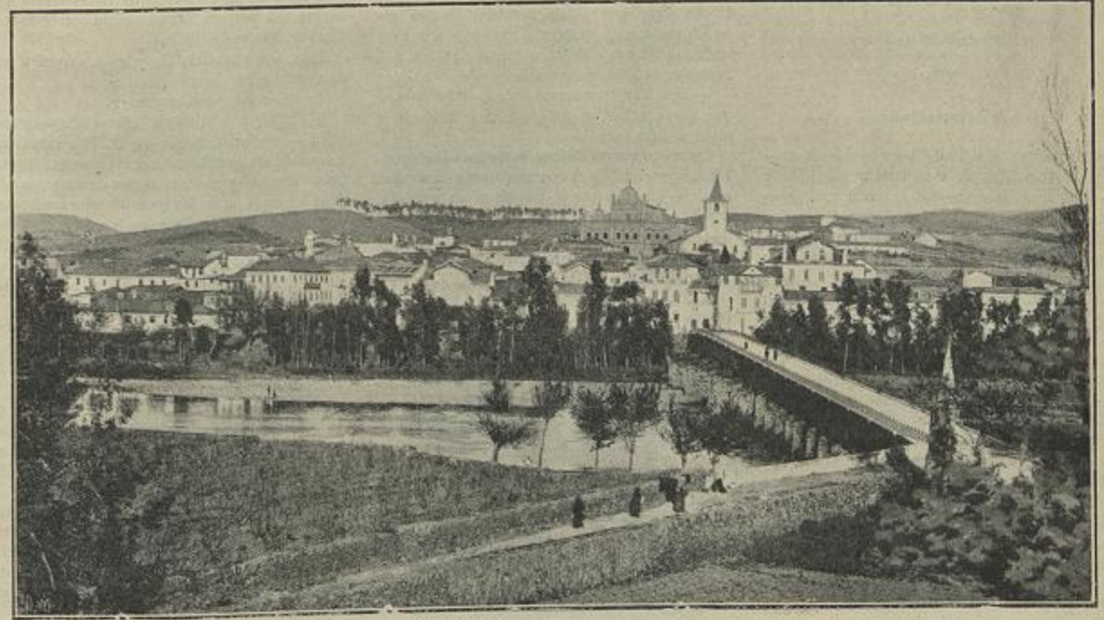
A PONTE DE MIRANDELLA QUE FOI DESTRUIDA EM PARTE PELA CHEIA

Muitas foram ainda as terras atingidas pelos temporaes, como Valpassos, Resende, Castello Novo, Bragança, Figueira de Castello Rodrigo, Castello de Paiva, Ermezinde, Sabugal, Fundão,