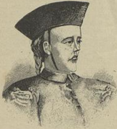
O IMPERADOR DA CHINA K'ANG-CHUN

O príncipe Chun tem dentro do seu imperio, ou antes em sua casa, um concorrente que o poderá prejudicar, e é o vice-rei Yuan-Chi-Kai, presidente do conselho do governo e com grande partido da facção liberal, — bom é saber que na China já ha partido liberal —, contando ainda grande prestigio no exercito e dispondo de uma