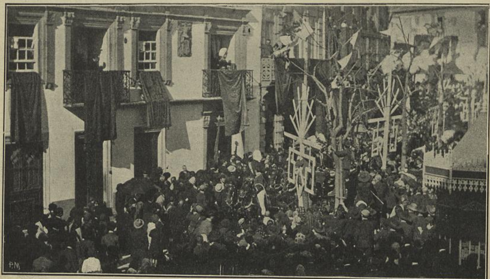
EM VIANNA DO CASTELO — EL-REI A UMA JANELA DA CASA DA ASSEMBLÉA, AGRADECENDO AS MANIFESTAÇÕES