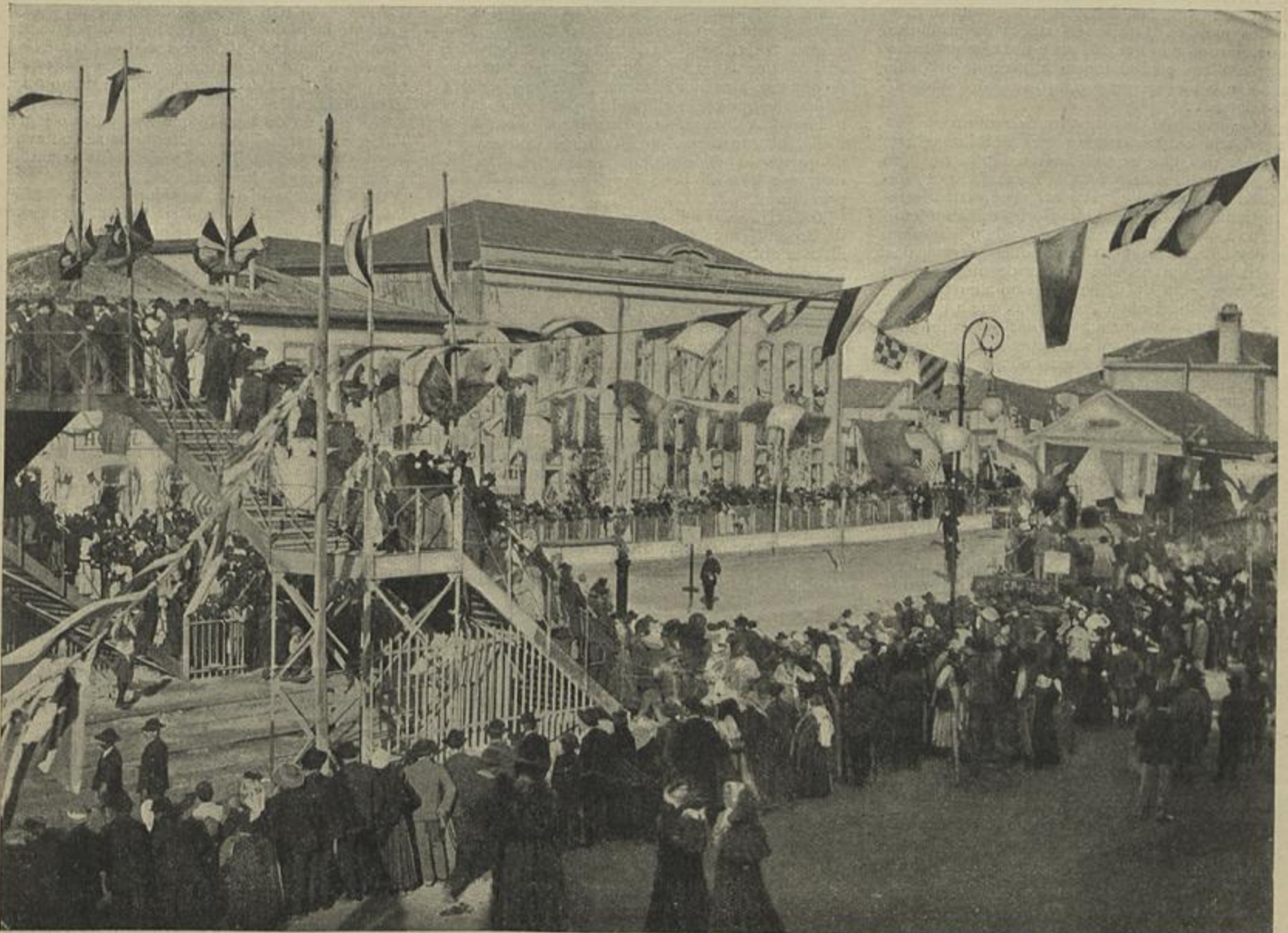
A INAUGURAÇÃO DO CAMINHO DE FERRO DO VALLE DE VOUGA — CHEGADA DO COMBOIO REAL A ESPINHO