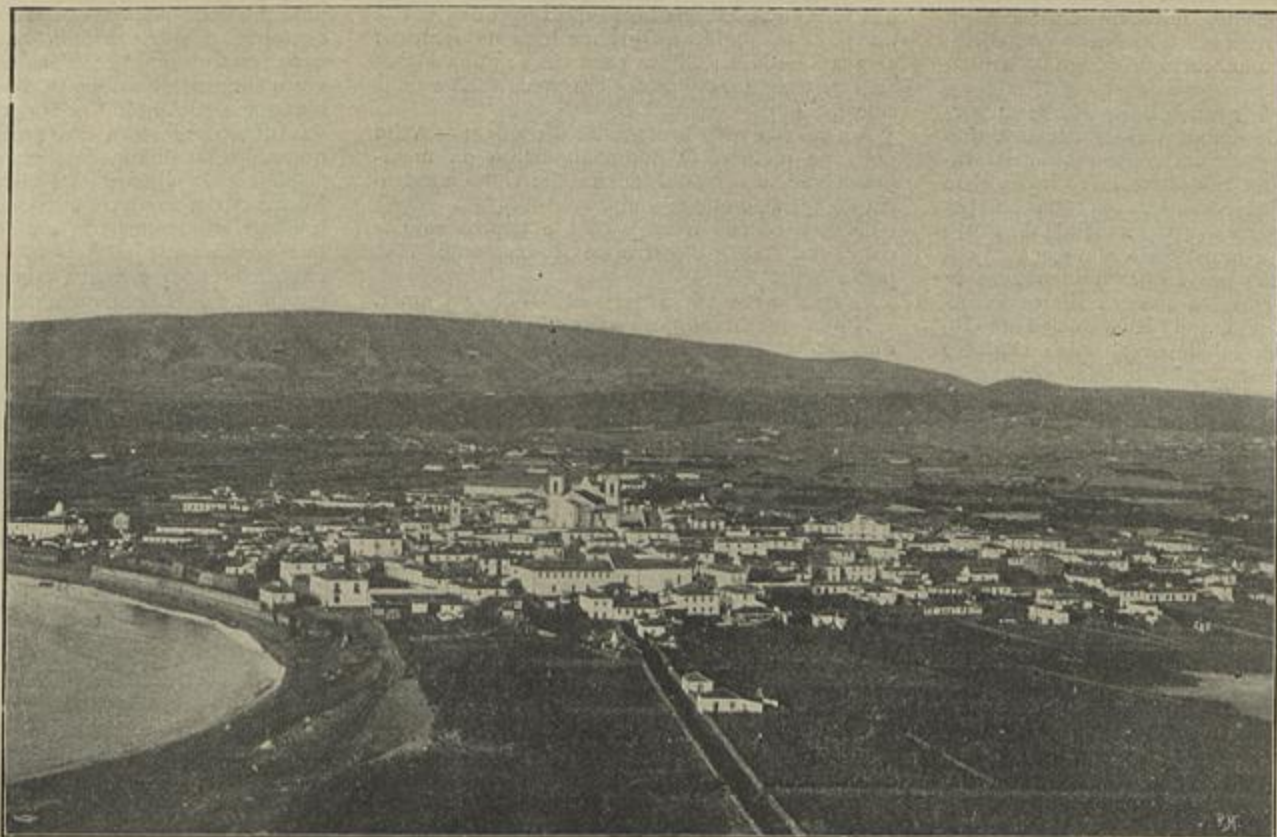
UMA VISTA DA VILLA DA PRAIA DA VICTORIA

ses, está na estatua que fizeram erigir no seio da sua villa, para recordar ao viajero — um benemerito.