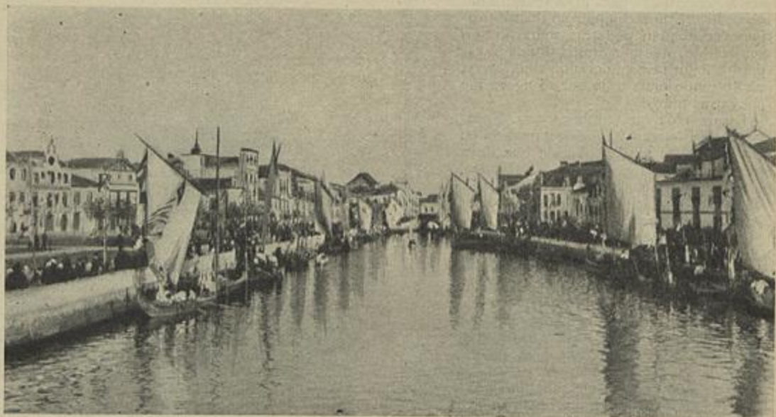
ASPETO DA RIA NO DIA DA VISITA DE EL-REI

Os campos como que nos estão fallando; as ruinas como que estão testemunhando o passado,