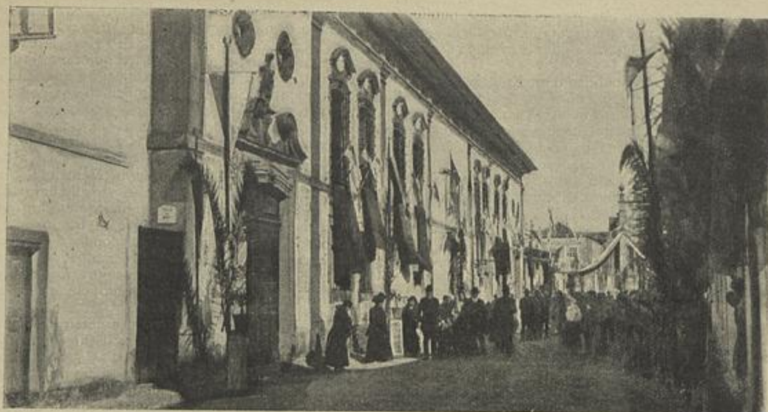
EM AVEIRO — A EGREJA DE JESUS ONDE SE CELEBROU O «TE-DEUM»

offerecendo thema ao geologo, notas ao historiadôr, estro ao poeta.