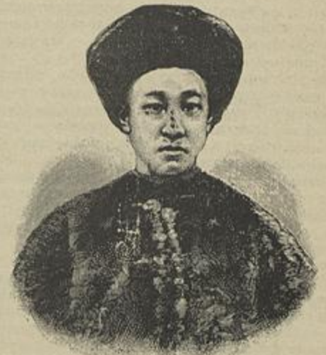
O PRINCIPE REGENTE CHUN

comerciaes, embora com isso contrarie a politica dos Estados Unidos, que em tempo declarou não consentir que a China desse quaesquer vantagens neste sentido ao Japão, sob pena de até recorrer ás armas, se tanto fôr preciso.