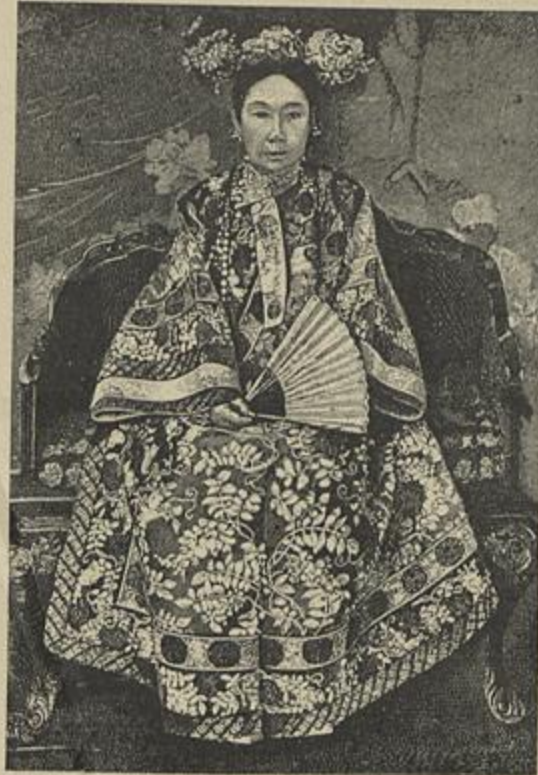
A IMPERATRIZ VIUVA TSE-HSI

Yuan-Chi-Kai inclina-se muito para o Japão a quem não terá duvida em fazer boas concessões