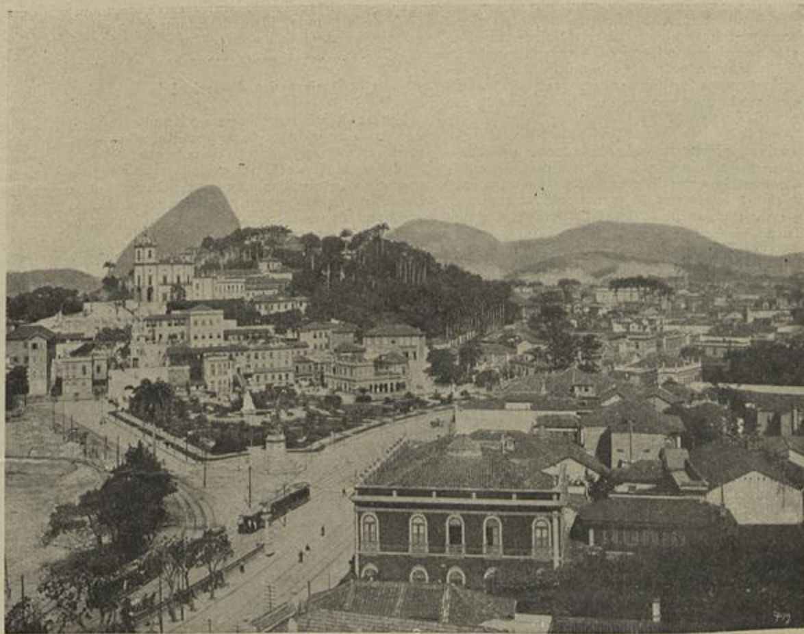
RIO DE JANEIRO — O MONTE DA GLORIA

Estes postos principaes não distando uns dos outros mais de tres dias de marcha, permittiam reduzir ao minimo o numero de carros boers destinados a cada unidade (trem regimental), por isso que apenas estes tinham de levar consigo tres dias de viveres.