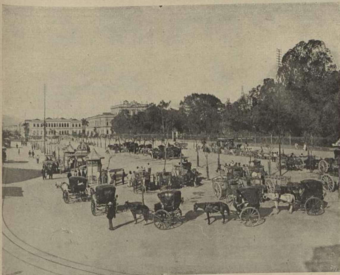
RIO DE JANEIRO — A PRAÇA DA REPUBLICA

A Fundição de Massarelos, servindo-se dos mesmos moldes em que fundira em tempo a estua em bronze, fabricou agora uma em ferro, para enviar á Exposição do Rio do Janeiro.