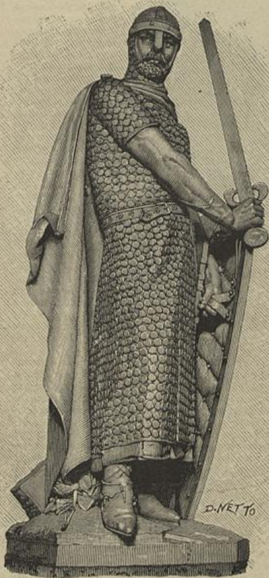
PORTUGAL NA EXPOSIÇÃO NACIONAL DO RIO DE JANEIRO. — A ESTATUA DE D. AFFONSO HENRIQUES — ESCULPTURA DE SOARES DOS REIS — FUNDIDA EM FERRO, EXPOSTA PELA FUNDIÇÃO DE MASSARELLOS.

Referimo-nos em o numero antecedente á Marcenaria 1.º de Dezembro como uma das expositoras na Exposição do Rio de Janeiro, hoje temos de