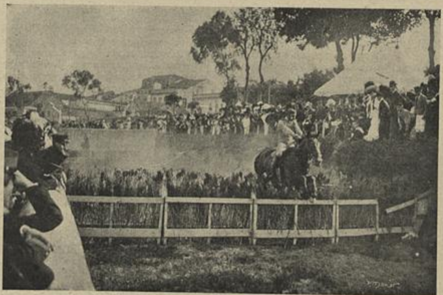
EXERCICIOS DE SALTOS

A maior parte da comissão retirou para o Porto naquelle mesmo dia, levando seguramente gratas recordações da recepção que teve no Paço e do povo de Lisboa, que verdadeiramente fraternisou com os representantes da segunda capital do reino.