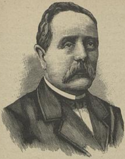
CONDE DE SAMODÃES