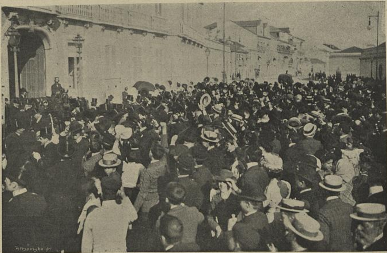
AS MANIFESTAÇÕES EM FRENTE DO PAÇO DAS NECESSIDADES

E todos hoje, de bom grado, assim o repetimos porque Vossa Magestade é para nós a personificação das instituições politicas que nos asseguram liberdade e ordem, e pelas quaes nos sen-