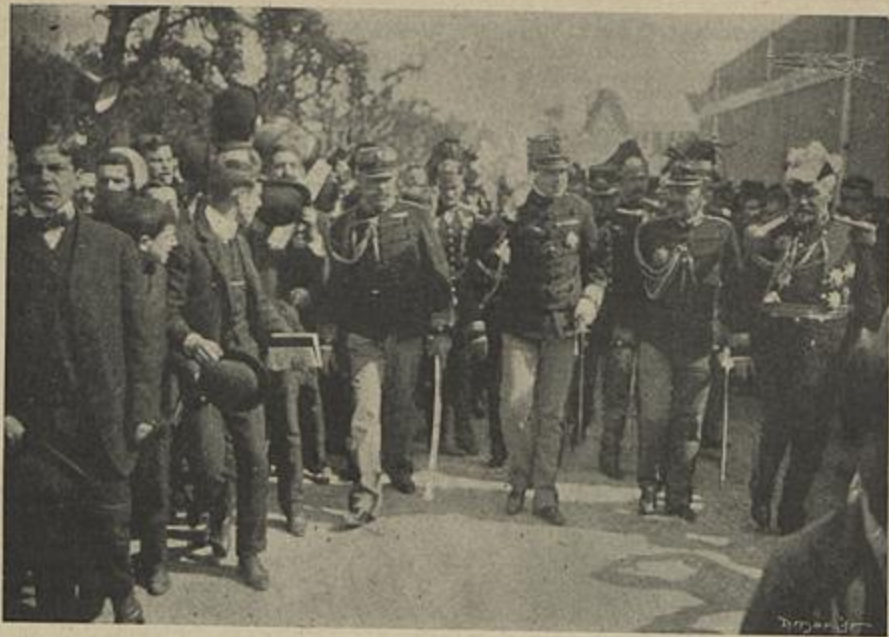
CHEGADA DE EL-REI Á ESCOLA DO EXERCITO