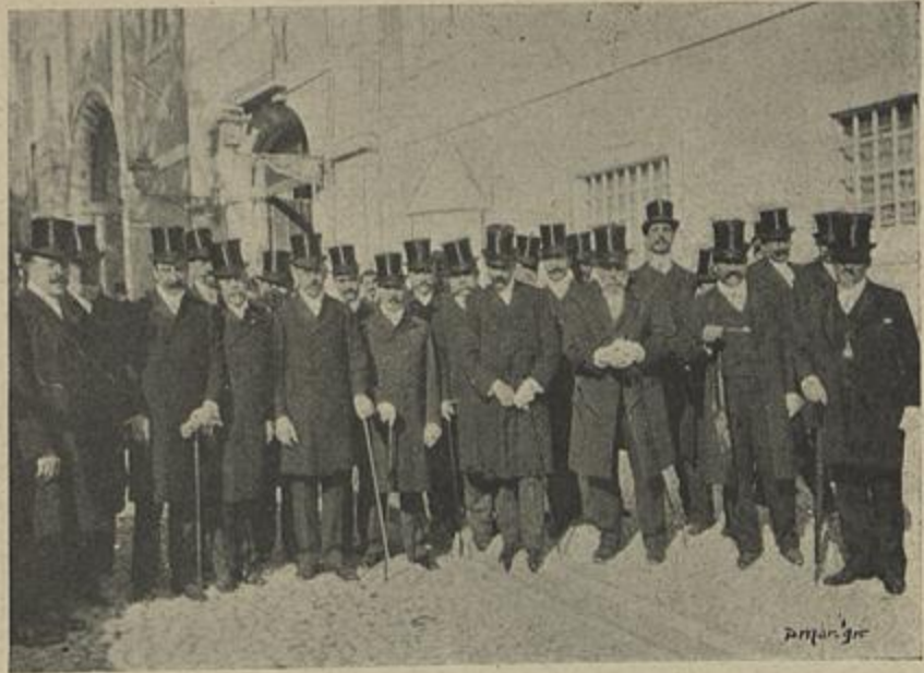
ALGUNS MEMBROS DA COMISSÃO PORTUENSE