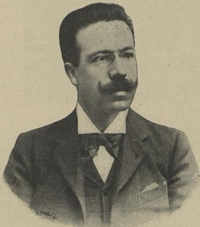
DR. TRINDADE COELHO

§ 2.º Essas associações ou nucleos locais far-se-hão representar por delegados nos congressos annuaes e nas reuniões maximas especiaes que a Liga determine fazer para união e progresso dos seus empreendimentos.