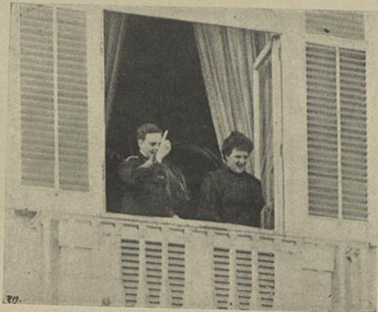
EL-REI D. MANUEL E RAINHA D. AMELIA, Á JANELLA DO PAÇO LEVANTANDO VIVAS Á ACADEMIA E Á PATRIA

timos encorajados para affrontar os perigos que Vos ameacem.