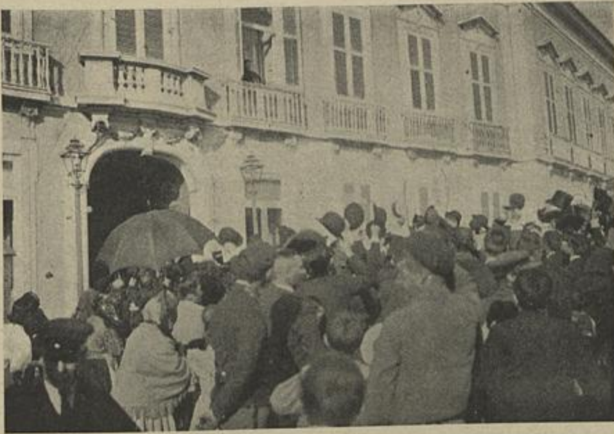
EL-REI, NA JANELLA DO PAÇO AGRADECENDO AS MANIFESTAÇÕES

telegramma, no dia da Vossa aclamação, franca e sinceramente as suas arraigadas convicções monarchicas — desejando-Vos um longo e glorioso reinado — são os mesmos que hoje, os trazem perante Vossa Magestade, suprema incarnação na nossa querida Patria, a dizer —, com uma inabalavel fé, com uma profunda convicção, fé e convicção nascidas não d'um vago idealismo, mas sim firmadas no nosso acrisolado amor patrio, — que os estudantes da Universidade são amigos do seu Rei.