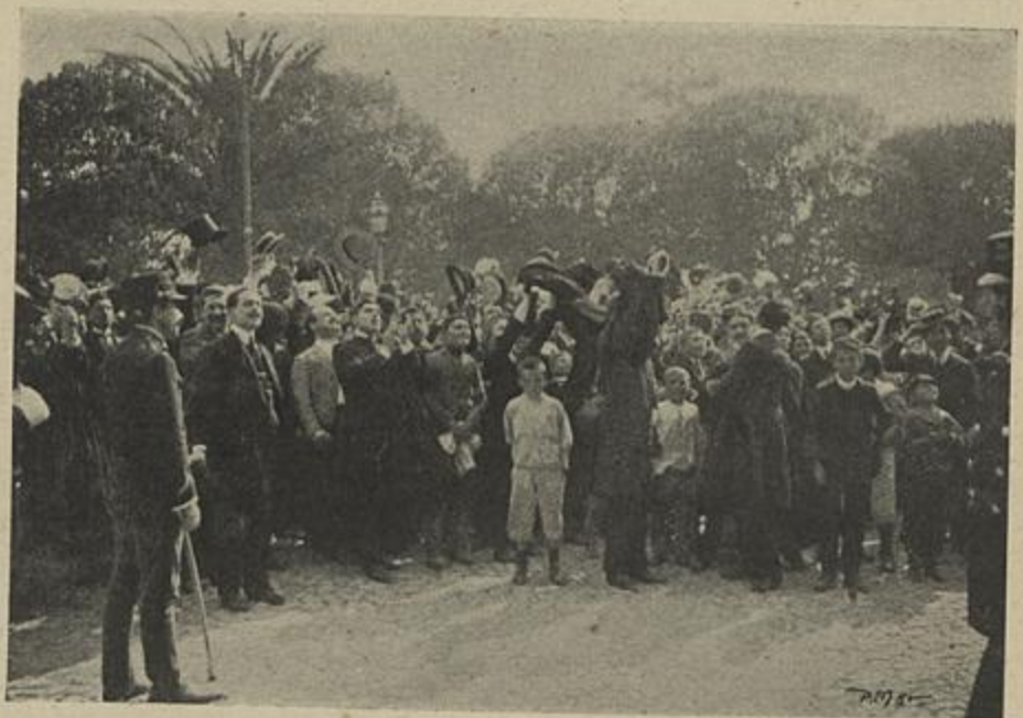
AS MANIFESTAÇÕES DOS ESTUDANTES EM FRENTE DO PAÇO

No comboio da 1 hora da noite regressou a Coimbra a maior parte dos estudantes.