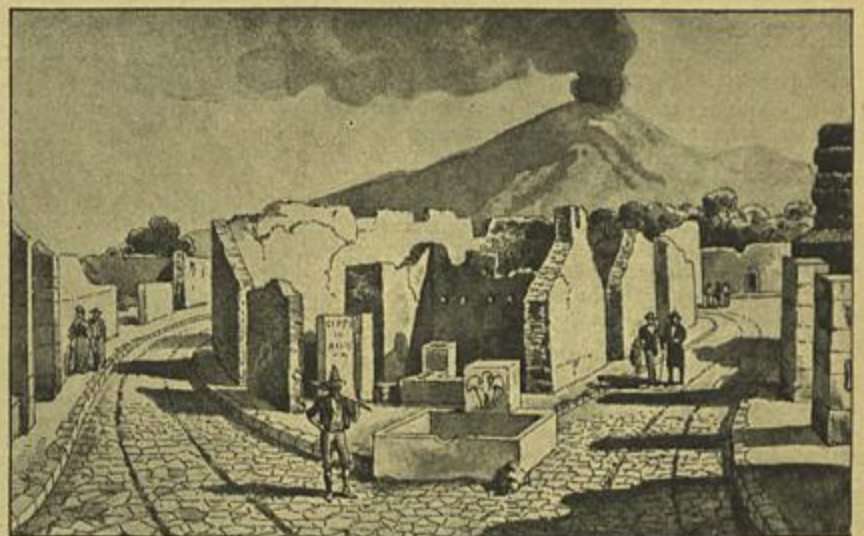
A ENCRUZILHADA FORTUNATA NAS RUINAS DE POMPEIA (ITALIA)

(Gravuras extraídas do livro ELEMENTOS DE HISTORIA DA ARTE — BIBLIOTECA DE INSTRUÇÃO PROFISSIONAL)