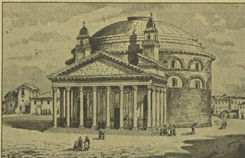
PANTHEON DE AGRIPPA, EM ROMA

Obra prefaciada, parafrasiada, anotada e com um vocabulario, por José Agostinho. Canto I. 1907, Porto, Livraria Figueirinhas. Um vol. de 147 paginas. Preço 150 réis.