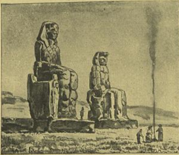
AS ESTATUAS GIGANTESCAS DE MEMNON (EGYPTO)