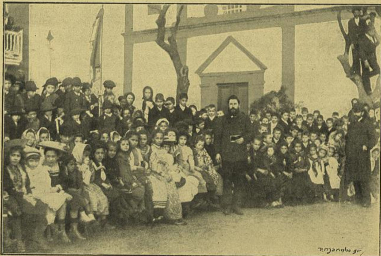
O ORFEON DE 500 CRIANÇAS DAS ESCOLAS DO CONCELHO DE ESPOSENDE, NA INAUGURAÇÃO DO MONUMENTO

cada um d'estes typos conta uma historia, durante a peregrinação para o sanctuario de S. Thomaz de Canterbury, ou á noite quando chegam á estalagem e se encontram reunidos á lareira. Encontramos aqui uma descripção das estalagens que não foi por certo desconhecida de Lord Macauley na sua monumental historia economica de Inglaterra, uma pintura da vida d'aquella epocha que o poeta faz reviver com notavel brilho. Eis os dois aspectos