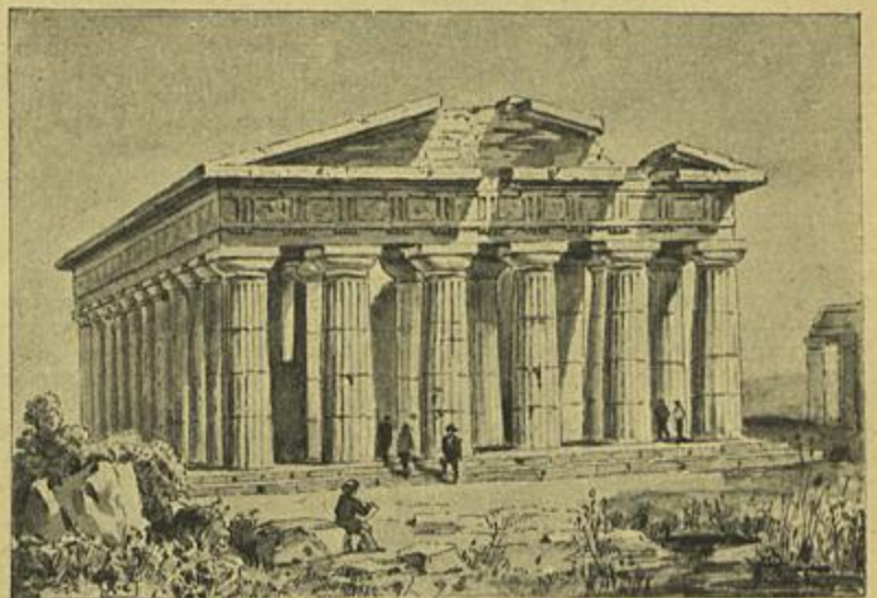
RUINAS DO TEMPLO DORICO DE NEPTUNO EM PESTUM (ITALIA)