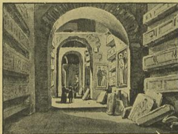
UMA GALERIA DAS CATACUMBAS DE ROMA

Gravuras extraídas do livro ELEMENTOS DE HISTORIA DA ARTE — BIBLIOTECA DE INSTRUÇÃO PROFISSIONAL