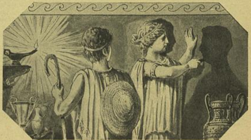
A INVENÇÃO DO DESENHO

No ponto de vista duma bibliotéca de instrução profissional, o texto corresponde na realidade ás linhas que acabo de transcrever do prefacio, e parece-me sufficiente para ministrar aos leitores o conhecimento geral do modo de ser, no campo es-