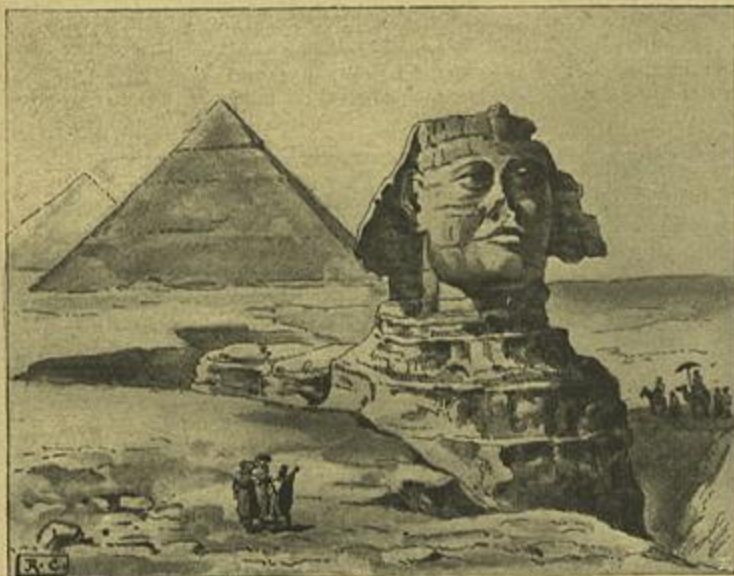
A GRANDE ESPHINGE E AS PYRAMIDES EM GIZEH (CAIRO-EGYPTO)