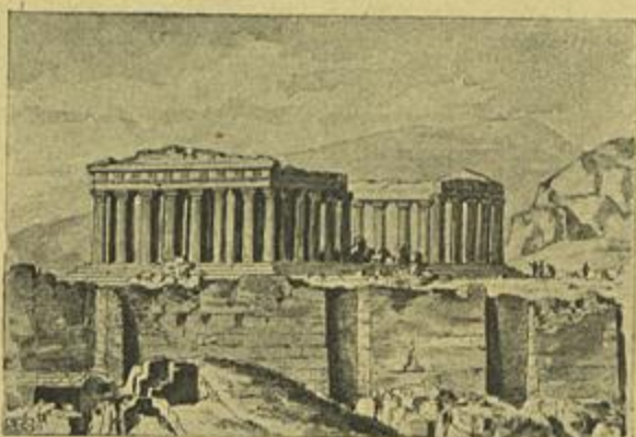
RUINAS DO PANTHEON NA ACROPOLE DE ATHENAS (GRECIA)

Louvando o empreendimento que tanto póde concorrer para illustrar os estudantes como o povo, notaremos comtudo que nesta edição parece não se ter seguido verdadeiramente a classica, e antes outras edições modernizadas, que alteram bastante a puresa do original, com formulas de linguagem que não são dos tempos do poeta. Este reparo nos mereceu o livro, por destinado ás escolas e por isso convir conservar o classicismo tanto quanto é compativel com a nossa epoca.