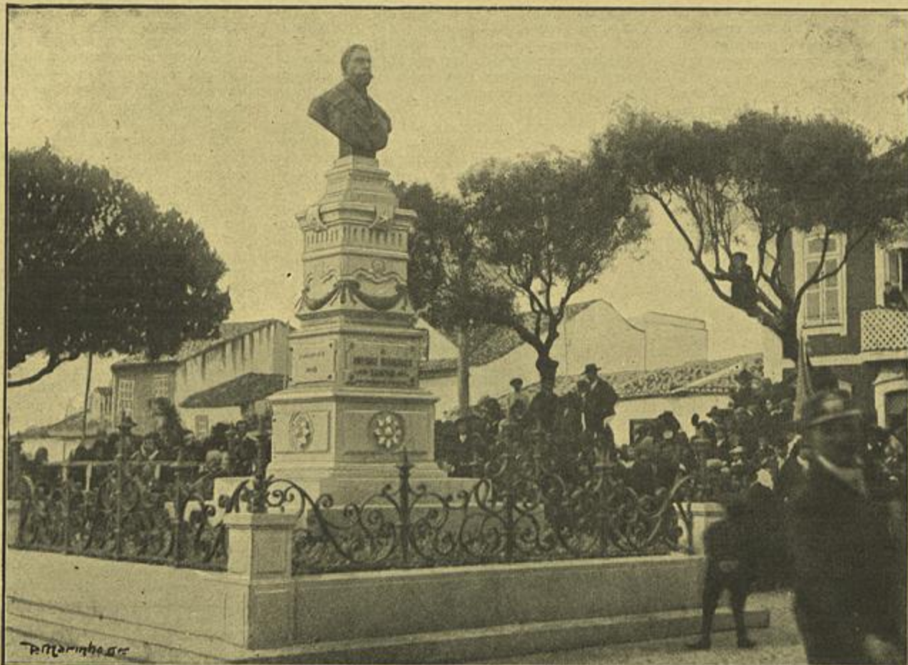
O MONUMENTO A ANTONIO RODRIGUES SAMPAIO, DEPOIS DA INAUGURAÇÃO EM 1 DO CORRENTE

elle deu corpo; n'ella se encontra a descripção de todos os usos e costumes da mesma epocha.