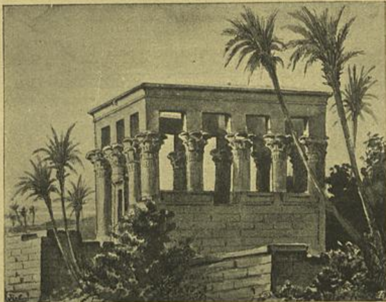
TEMPLO DE ÍSIS NA ILHA PHILAE DO NILO (EGYPTO)