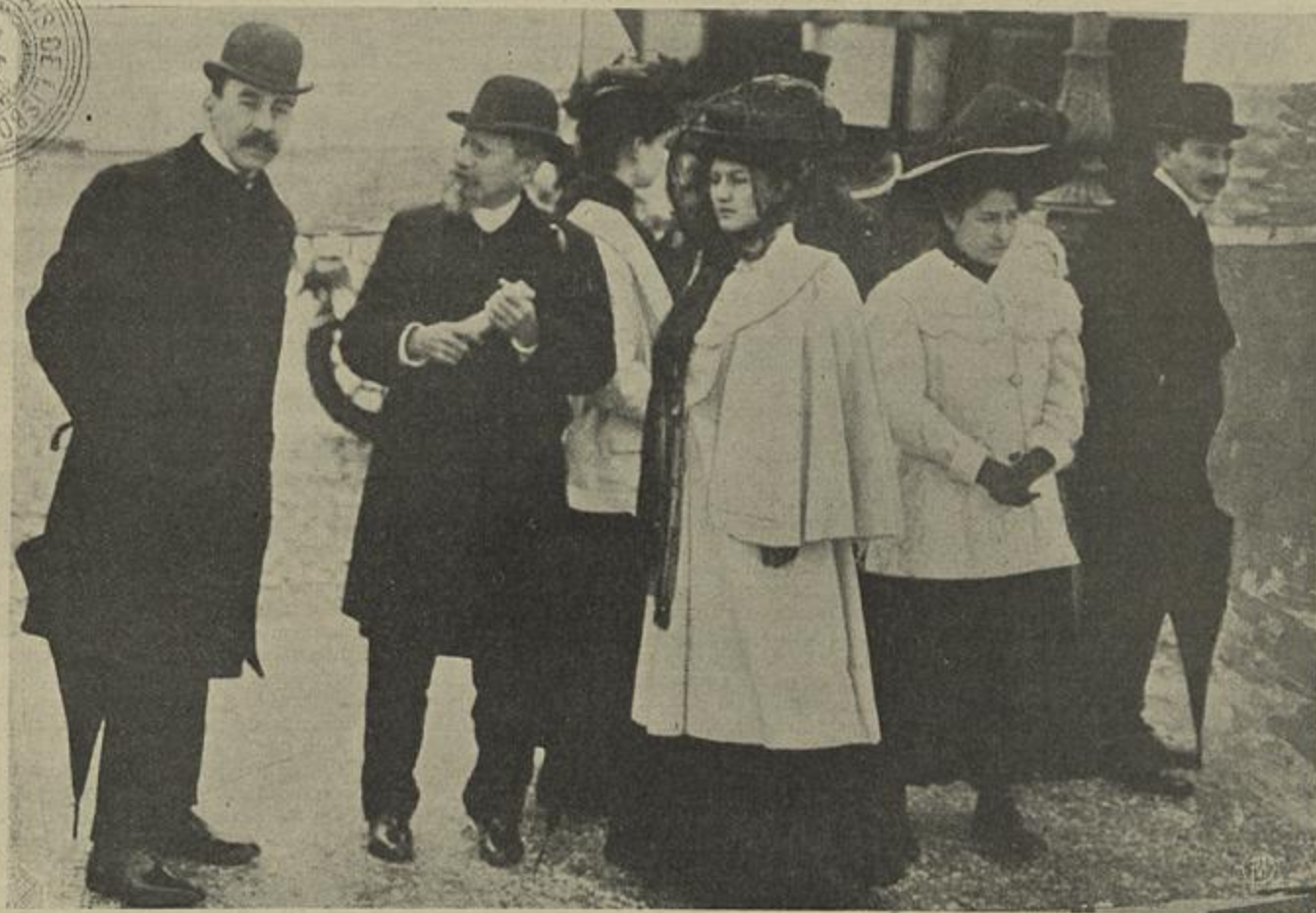
DESEMBARQUE DO EX-PRESIDENTE DR. RODRIGUES ALVES E SEUS FILHOS, NO POSTO DE DESINFECÇÃO, EM LISBOA