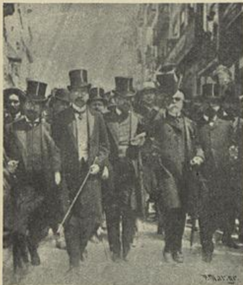
DR. AFFONSO COSTA — DR. AUGUSTO DE VASCONCELLOS — ANTONIO JOSÉ D'ALMEIDA — DR. BERNARDINO MACHADO — JOÃO DE MENEZES.

A indignação foi enorme em todo o mundo. De Paris telegrapham que na abertura do conselho municipal o mais velho dos seus membros manifestou, a proposito do crime, sua grande indignação. Mostrou sua sympathia pela Hespanha e pelo monarcha que, ha um anno, tão carinhosamente foi recebido pela cidade de Paris. Unanimamente foram estas palavras applaudidas.