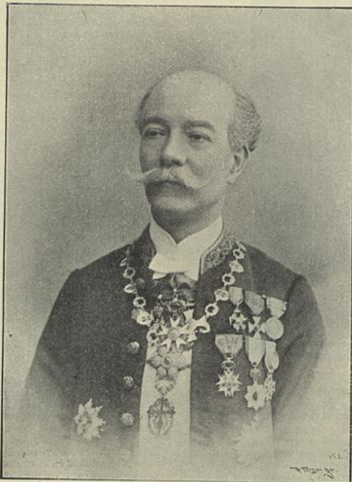
CONSELHEIRO ALFREDO PEREIRA, ENVIADO DO GOVERNO PORTUGUEZ AO CONGRESSO DA UNIÃO POSTAL UNIVERSAL, EM ROMA

Paula que fundou em 1897 e que distribue mensalmente aos pobres quantia superior a 400,000 reis! e o Circulo Catholico de Operarios que fundou em 1898.