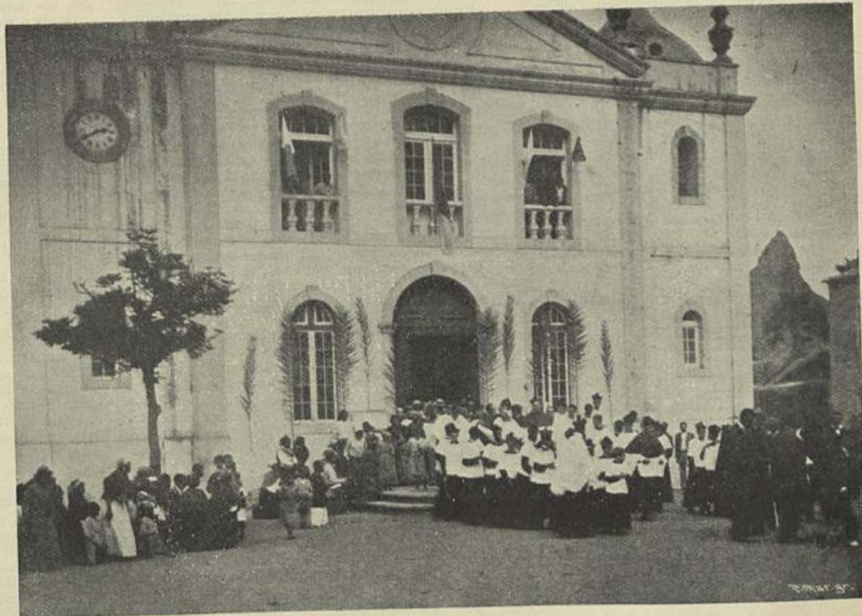
O NOVO BISPO DE CABO VERDE D. ANTONIO MOUTINHO, SAHINDO DA SÉ, NO DIA DA POSSE SOLEMNE

No Chibuto celebrou missa campal na inauguração do primeiro monumento levantado em Africa a Mousinho d'Albuquerque, proferindo uma commovente e patriótica allocução, allusiva aos gloriosos feitos do Sapião portuguez. Nesta mesma occasião benzeu solemnemente o