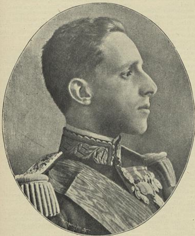
S. M. O REI AFFONSO XIII