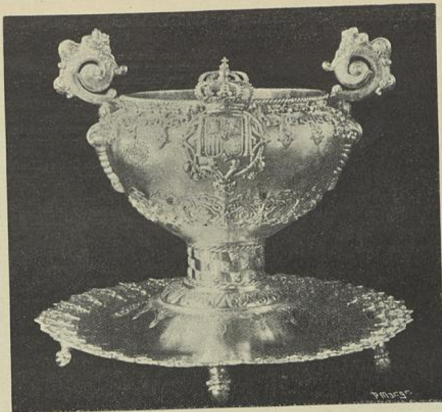
TAÇA DE PRATA CINZELADA, PRESENTE DE NUPCIAS DOS REIS DE PORTUGAL AOS REIS DE HESPAHIA Executada nas officinas dos srs. Leitão & Irmão