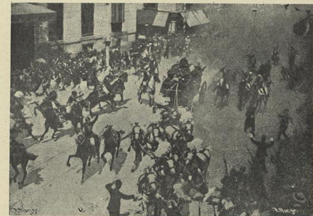
MOMENTO EM QUE ESTALOU A BOMBA SOBRE O COCHE REAL, NA CALLE MAIOR

Dotado d'esse ardente zelo d'incançavel propa-