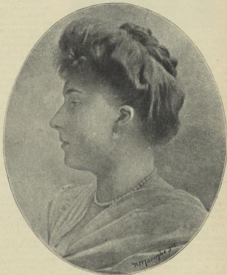
S. M. A RAINHA ENA VICTORIA