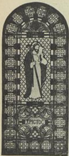
VITRAES Correia Brandão

Que nos futuros congressos de medicina seja esta secção exclusivamente reservada aos medicos e aos sabios que fõrem apresentados pelos comités nacionaes; que o ensino da stomatologia seja organizado oficialmente em todos os paizes; que só sejam admittidos á inscripção os medicos e os estudantes de medicina; que haja de futuro