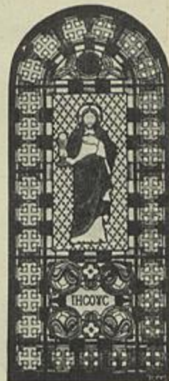
VITRAES Correia Brandão

para tratar do inquerito das condições de produção do rachitismo.