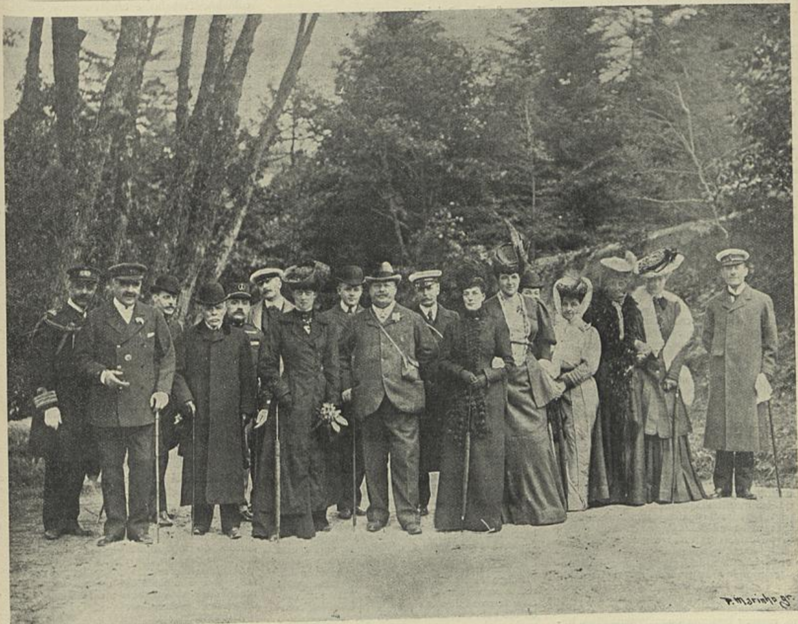
S. M. A. RAINHA ALEXANDRA EM LISBOA