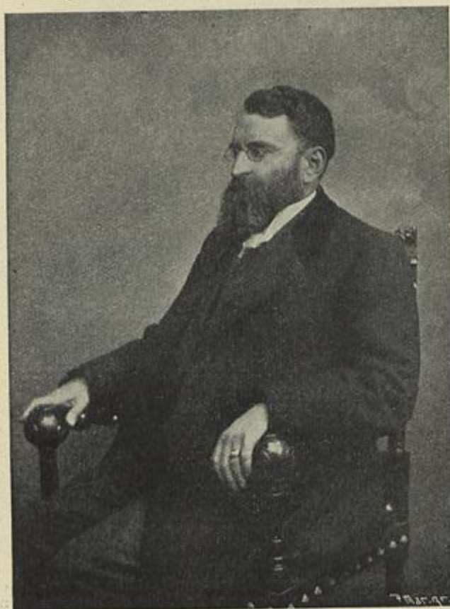
DR. RICARDO JORGE