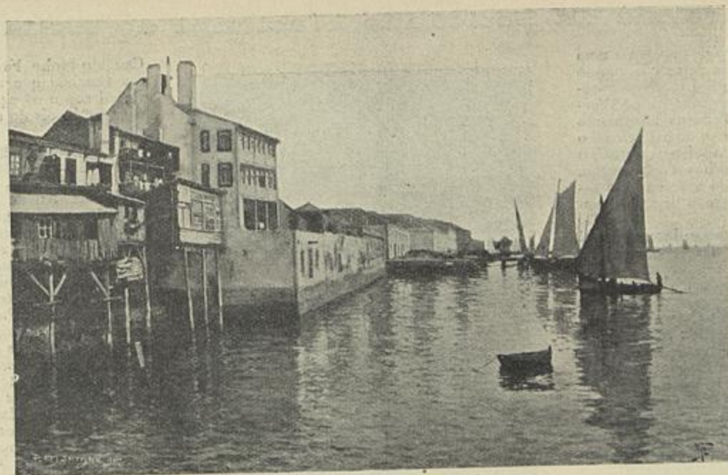
RECANTO DO TEJO — Quadro de João Vaz