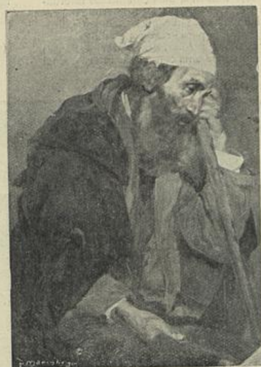
MENDIGO — Quadro de Romano Esteves