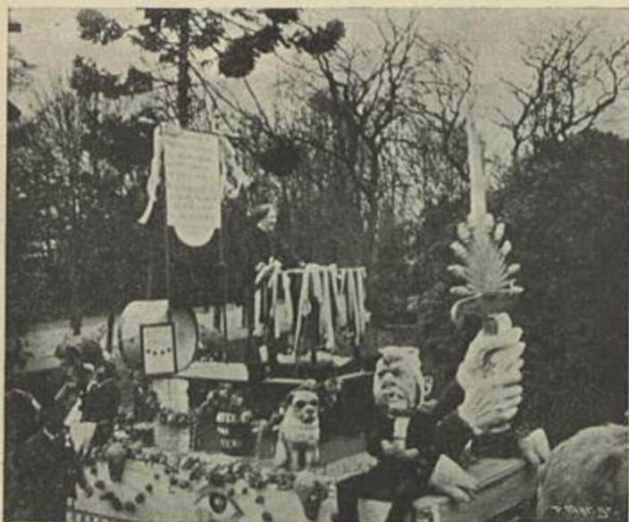
CARRO DO DENTISTA NACIONAL CORTEJO DOS FENIANOS

Quando eu era estudante, lá em Moscow, succedeu-me morar paredes meias com uma das taes «donzellas»... não sei