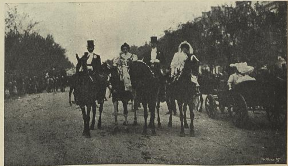
CAVALGADA DO GRUPO «ESPANTA»—PREMIADA