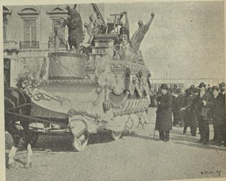
O CARRÃO DO REI CARNAVAL DE 1906