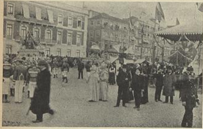
AVENIDA DA LIBERDADE — NA PRAÇA DOS RESTAURADORES