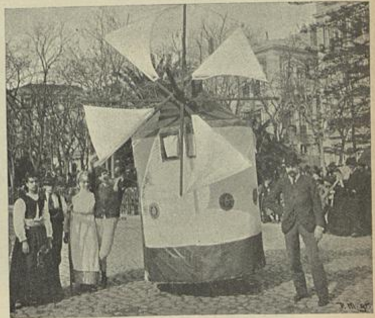
UMA BICYCLETA MOINHO

Danças, cégadas, parodias, velhas sovadas, sem novidade, sem interesse, Batalhão d'Alfama, de marinheiros, com seu couraçado de lona Sempre se fez , unica satyra bem jogada do Carnaval a este povo de navegadores, onde já se não construe um navio. Os batalhões d'Ajuda, d'aqui, d'ali,