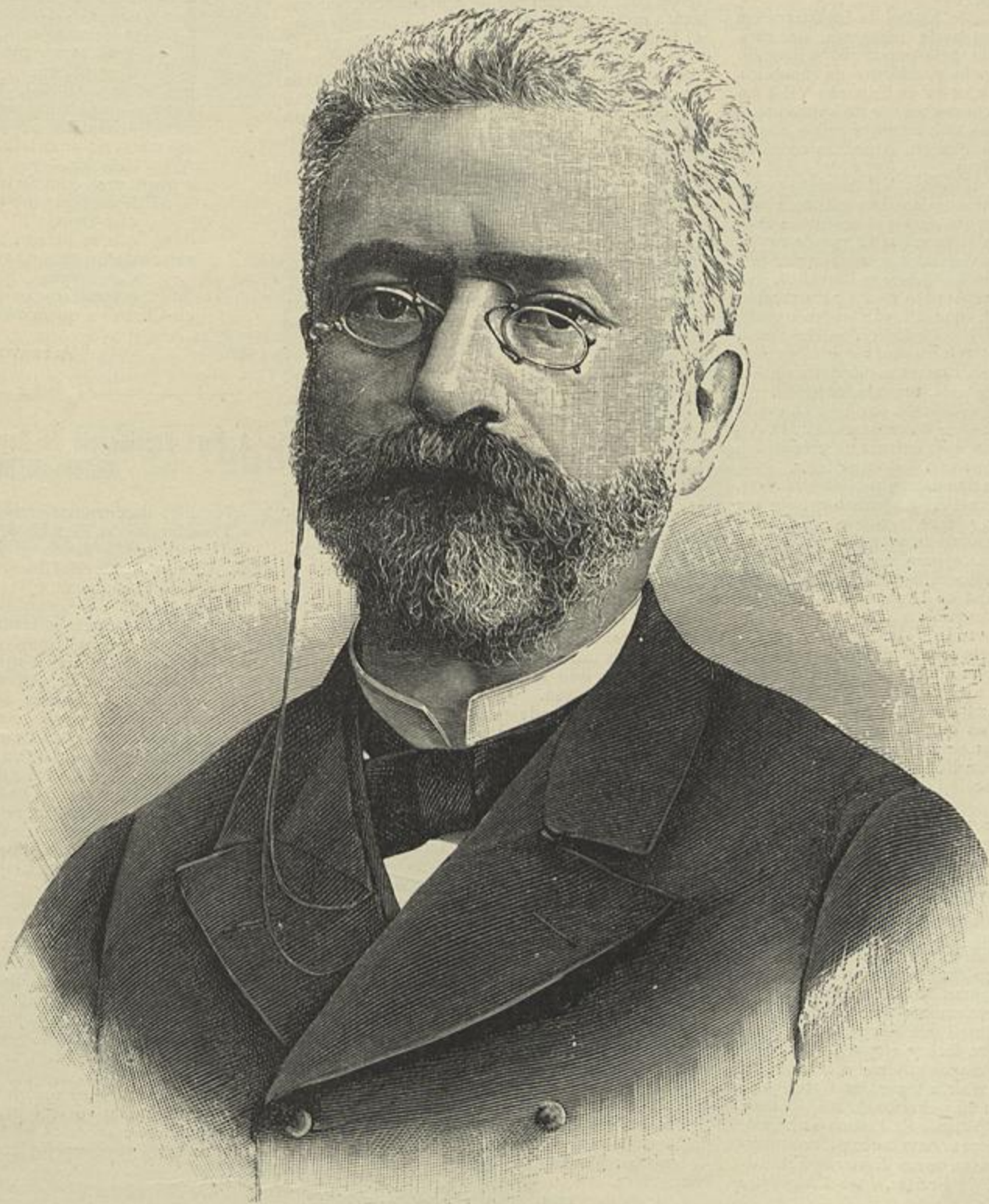
DR. AFFONSO PENA

NOVO PRESIDENTE ELEITO DA REPUBLICA DOS ESTADOS UNIDOS DO BRAZIL