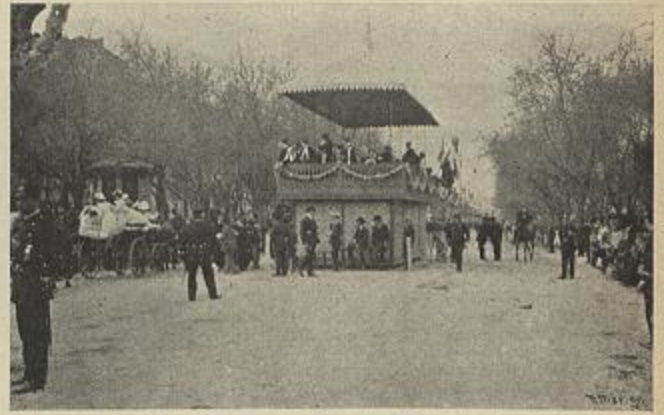
CORETO DA TUNA MADRILENA NA AVENIDA