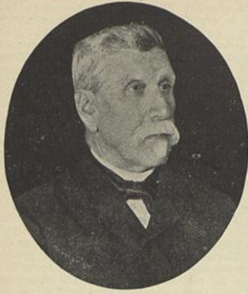
MANUEL MARIA PORTELLA

corrente, quando o grande estadista exhalava o ultimo suspiro, e o telegrapho communicou-a a toda a Europa.