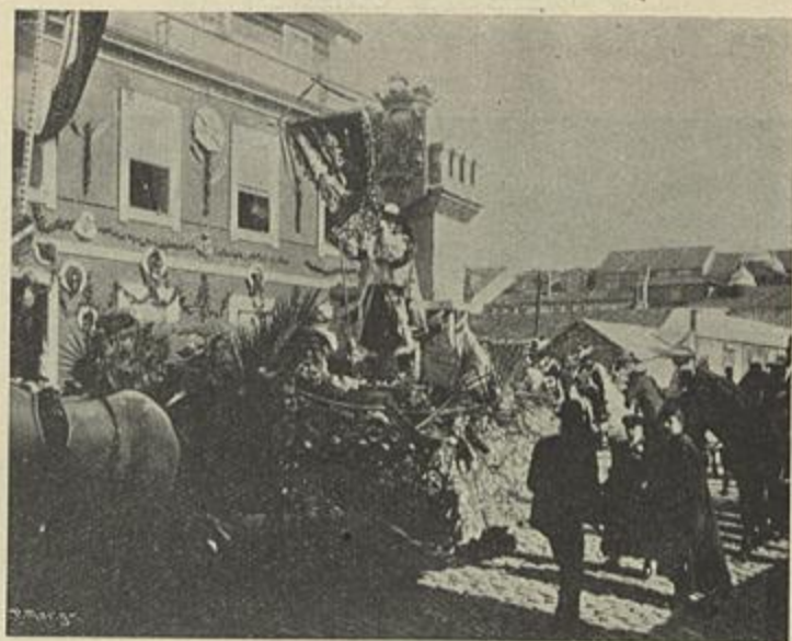
CARRO D'HONRA DO CLUB DOS GIRONDINOS