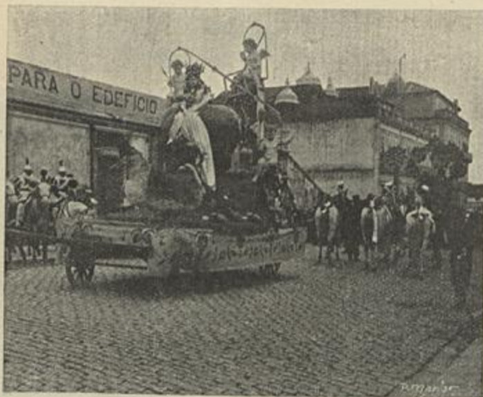
CARRO DO AMOR CLUB DOS GIRONDINOS