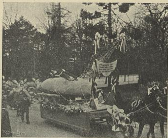
CARRO DO PROGRESSO CORTEJO DOS FENIANOS