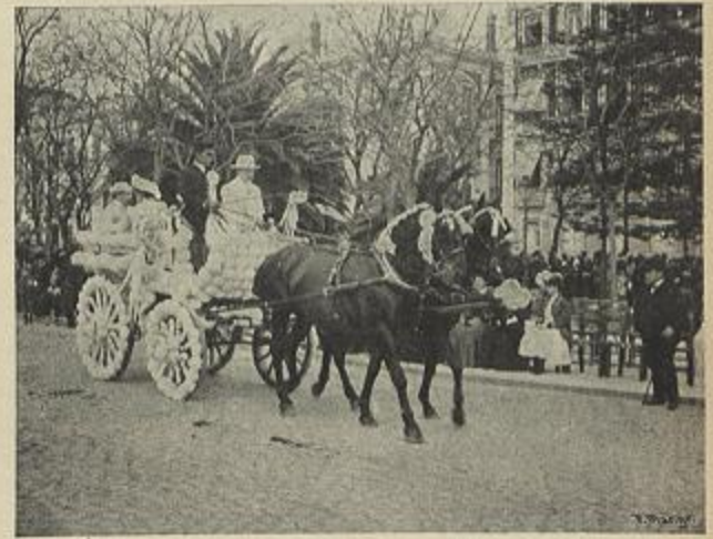
BREACK DE MISS JEORGES