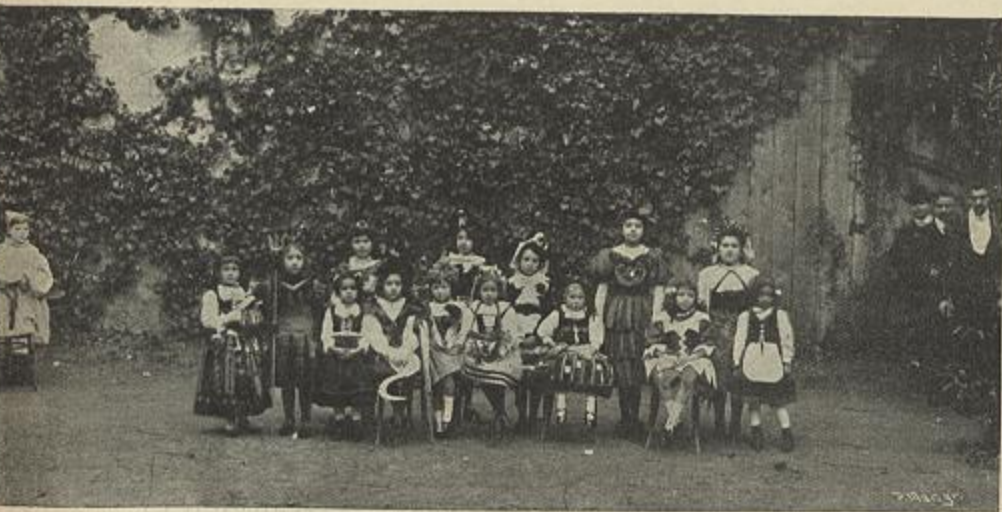
GRUPO DE CRIANÇAS MASCARADAS NO BAILE DO ATHENEU COMMERCIAL