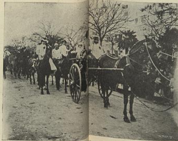
A CAVALGADA DO SR. BONOLLET—PREMIADA