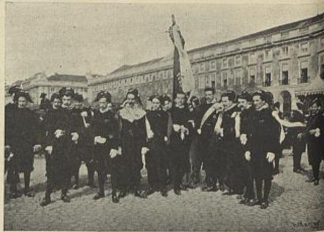
A TUNA ESCOLAR MADRILENA