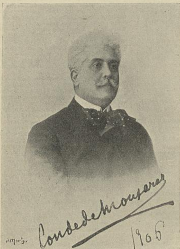
CONDE DE MONSARAZ AUTOR DA LETRA DO HIMNO DAS ESCOLAS