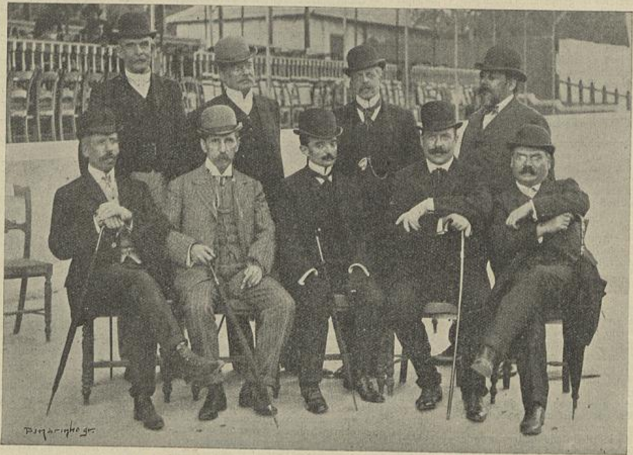
OS MEMBROS DA COMISSÃO DA FESTA ESCOLAR