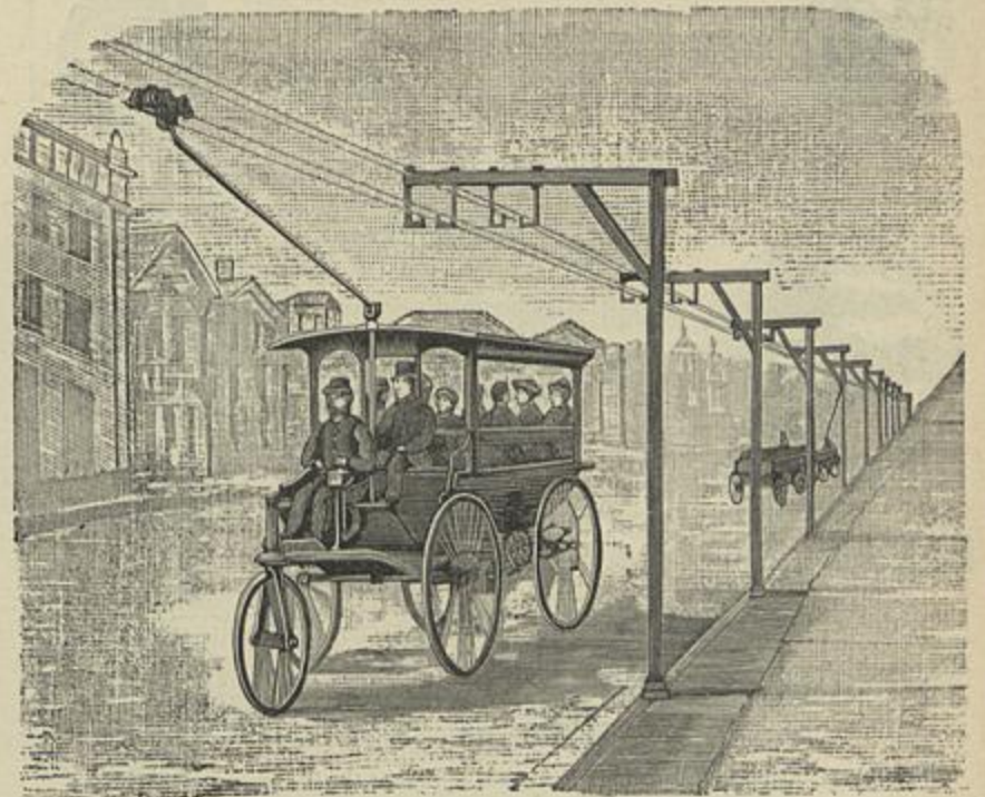
FIG. 69— CARRO ELECTRICO HERVEY

2.º— Fio subterraneo. —N'este systema ha um tunnel por baixo da via onde se acha o fio de