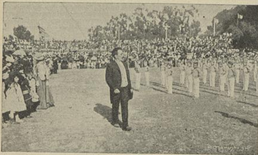
EXERCÍCIOS DE GIMNASTICA SUECA PELAS CRIANÇAS DAS ESCOLAS