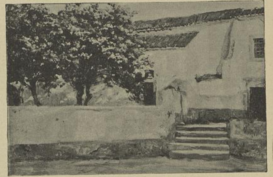
CEYADILHAS EM FLOR — Carlos Reis