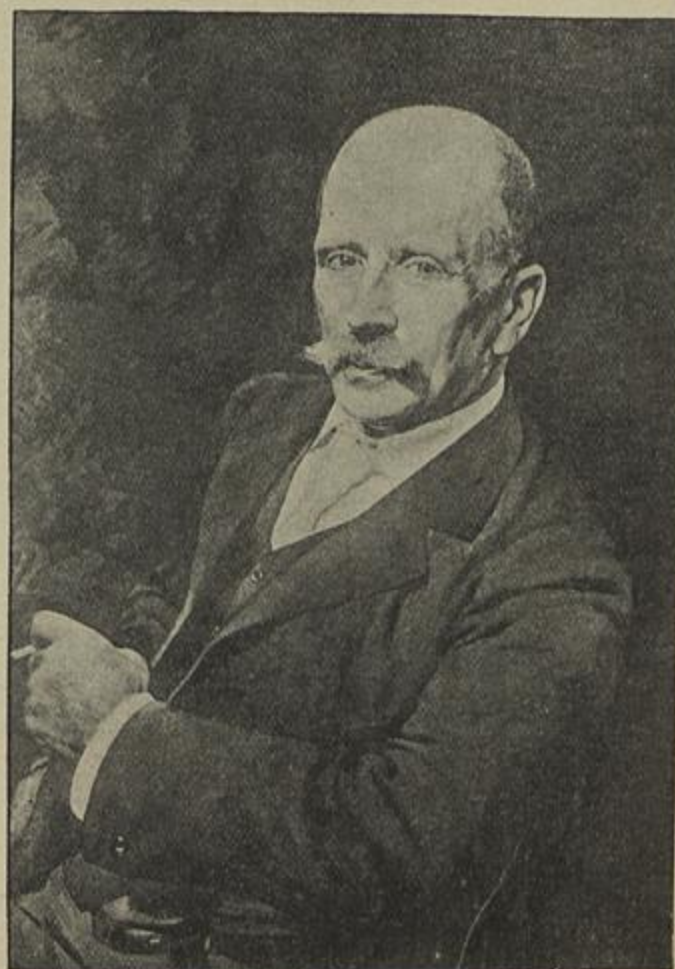
RETRATO DO EX.º SR. J. HENRIQUE — Roque Gameiro