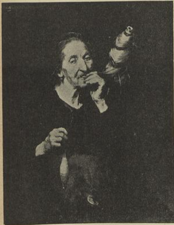
VELHA FIANDO — José Malhóa