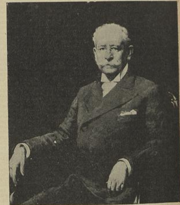
RETRATO DO EX. mo SR. J. S. — Carlos Reis