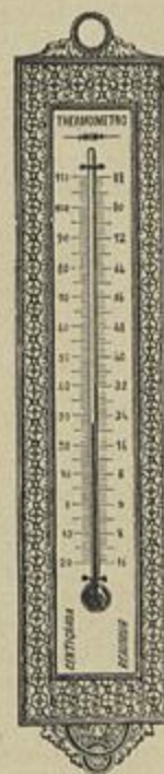
Fig. 43 Thermometro