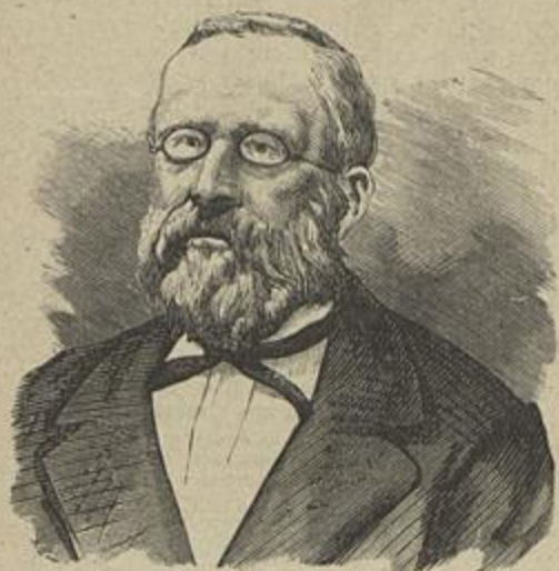
DR. RAPHAEL VIRCHOW — FALLECIDO EM 5 DO CORRENTE