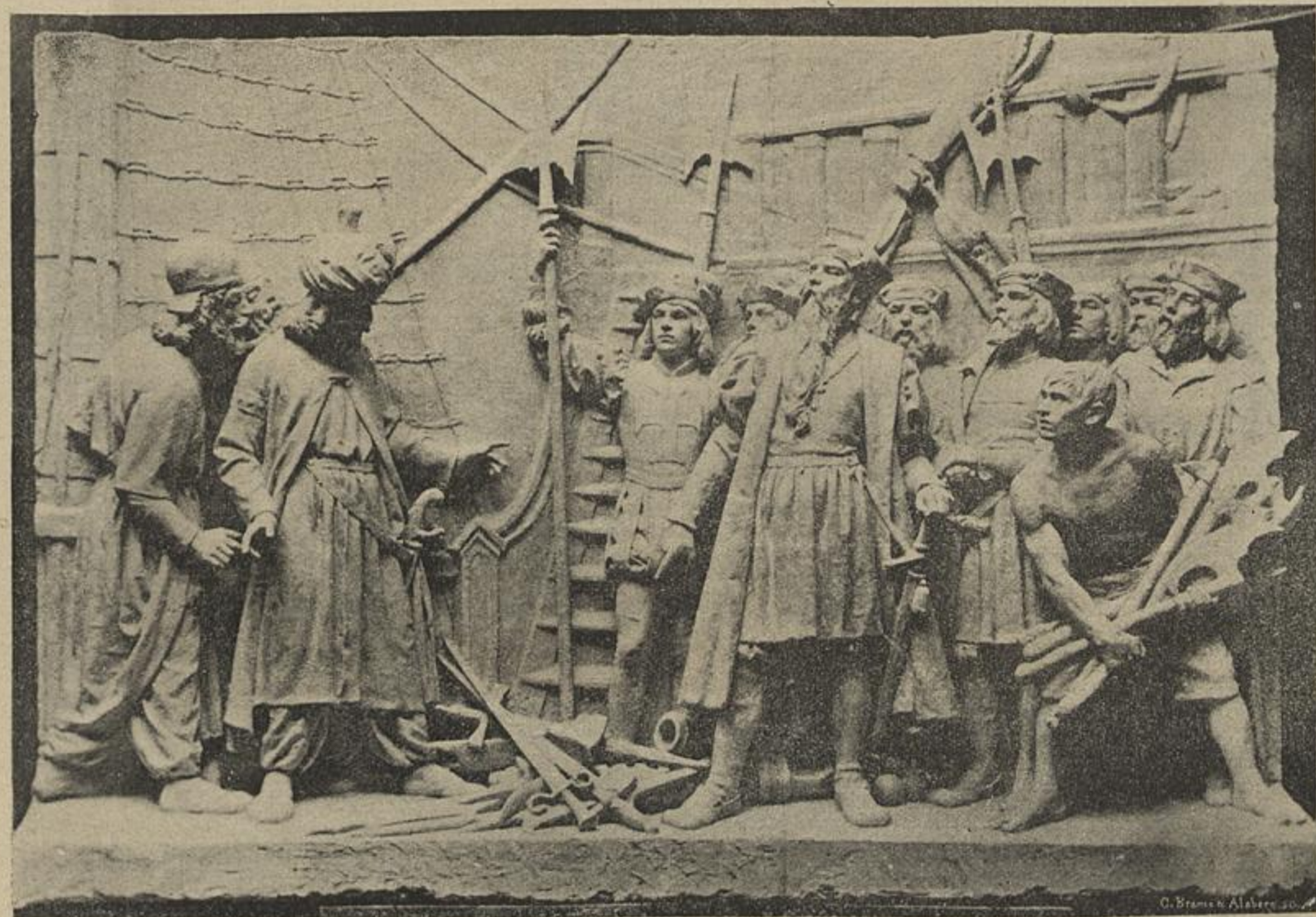
«É ESTA A MOEDA COM QUE EL-REI DE PORTUGAL PAGA OS SEUS TRIBUTOS.» ALTO RELEVO NO MONUMENTO DE AFFONSO DE ALBUQUERQUE — Escultura do sr. Costa Motta