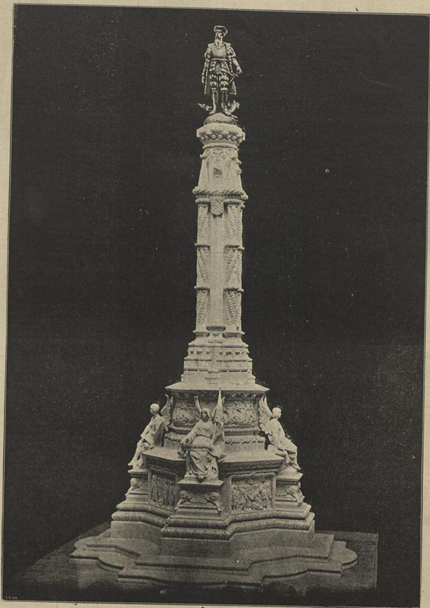
MONUMENTO A AFFONSO D'ALBUQUERQUE — Do esculptor sr. Costa Motta e architecto sr. Silva Pinto