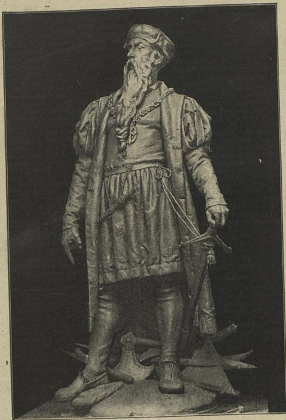
ESTATUA DE AFFONSO D'ALBUQUERQUE Esculptura do sr. Costa Motta