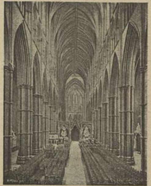
A CATHEDRAL DE WESTMINSTER, NAVE CENTRAL

Foi só o Christianismo que veio ensinar a verdadeira logica da Egualdade, que não é outra a lei moral e o sentimento do amor.