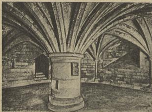
A CATHEDRAL DE WESTMINSTER, SUBTERRANEO

Leis fataes regem naturalmente a materia cosmica e as condições de vitalidade organica, e pri-