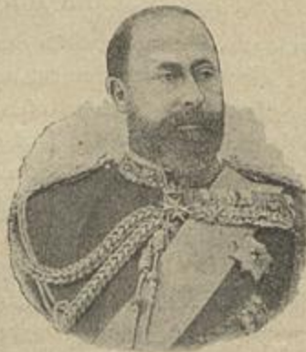
S. M. EDUARDO VII

Melhorou Eduardo VII da doença que o impediu de ser coroado em 23 de junho proximo findo e, quasi restabelecido, marcou se o dia 9 do corrente para a grande cerimonia da sua coroação, que, felizmente, d'esta vez se realisou, se não com todo o ceremonial e esplendor que teria, se não houvera sido addiada e a saude de Eduardo VII não fóra ainda melindrosa, mas com todo o enthusiasmo do povo inglez, o que é alguma coisa, para vencer a sua natural fleugma.