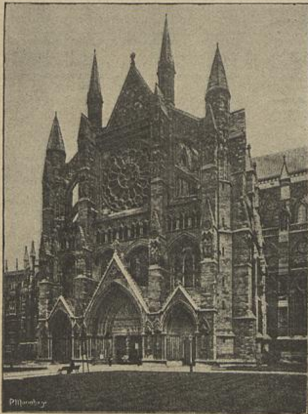
A CATHEDRAL DE WESTMINSTER

especie, soberanamente imbuída de seu alto destino moral pela missão levantada do divino doutorador da Judéa.