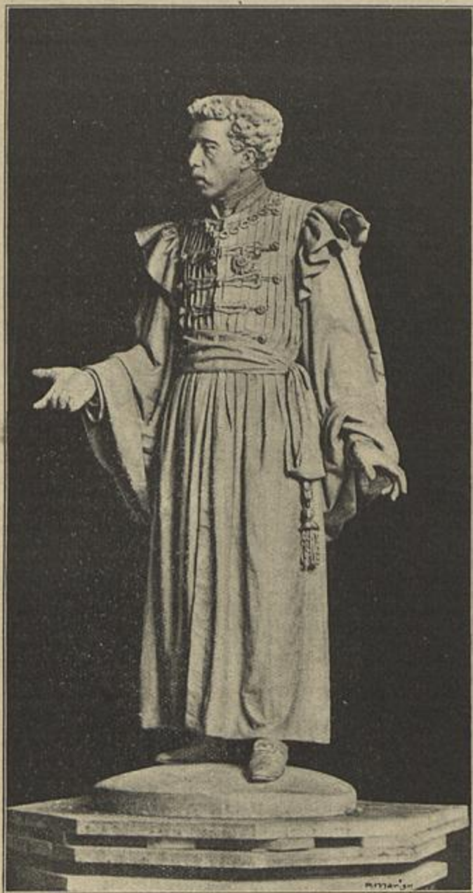
ESTATUA DE SOUSA MARTINS

A tactica moderna desbancando o systema de pelear nos periodos anteriores e fazendo nascer o militarismo profissional, em que surgiram capacidades estrategicas de primeira ordem, deu occasião a que taes entidades educadas e desenvol-