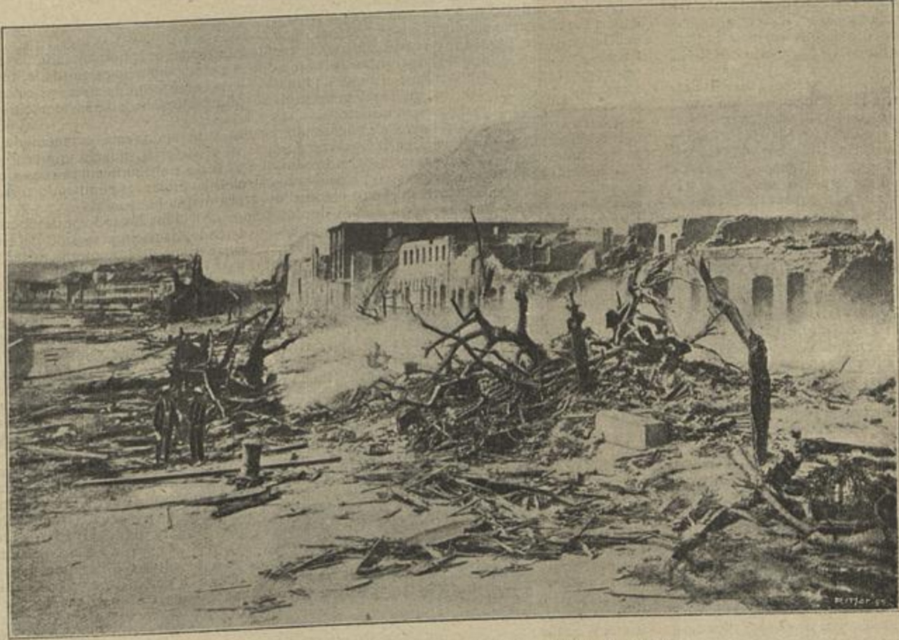
AS RUINAS DE UM BAIRRO DA CIDADE DE S. PEDRO