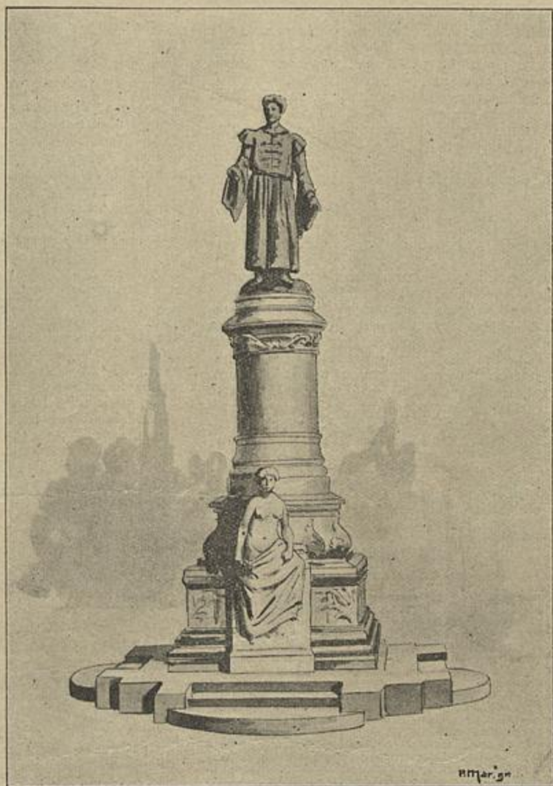
PROJECTO DO MONUMENTO A SOUSA MARTINS DO ESCULPTOR SR. COSTA MOTTA