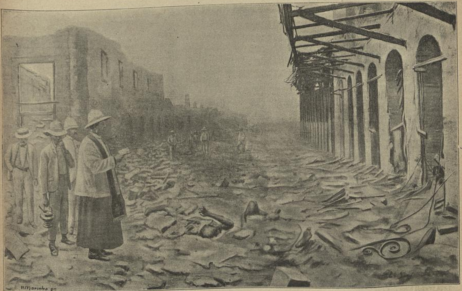
ENCOMMENDAÇÃO DOS CADAVERES ENCONTRADOS NAS RUINAS DA CIDADE DE S. PEDRO