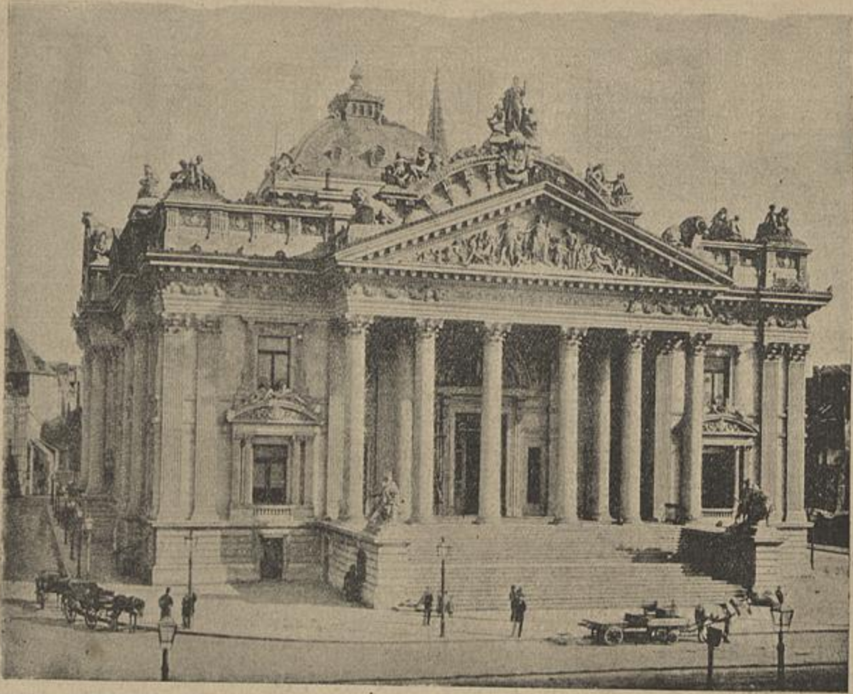
BELGICA — A BOLSA DE BRUXELLAS