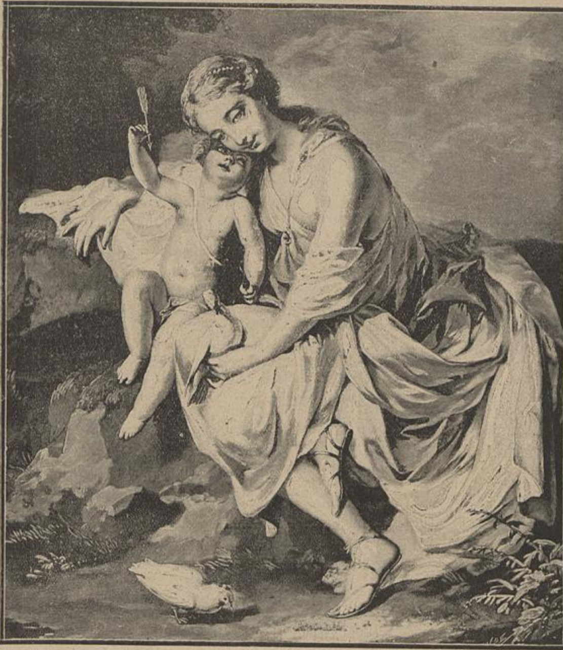
BELLAS-ARTES — VENUS E O AMOR