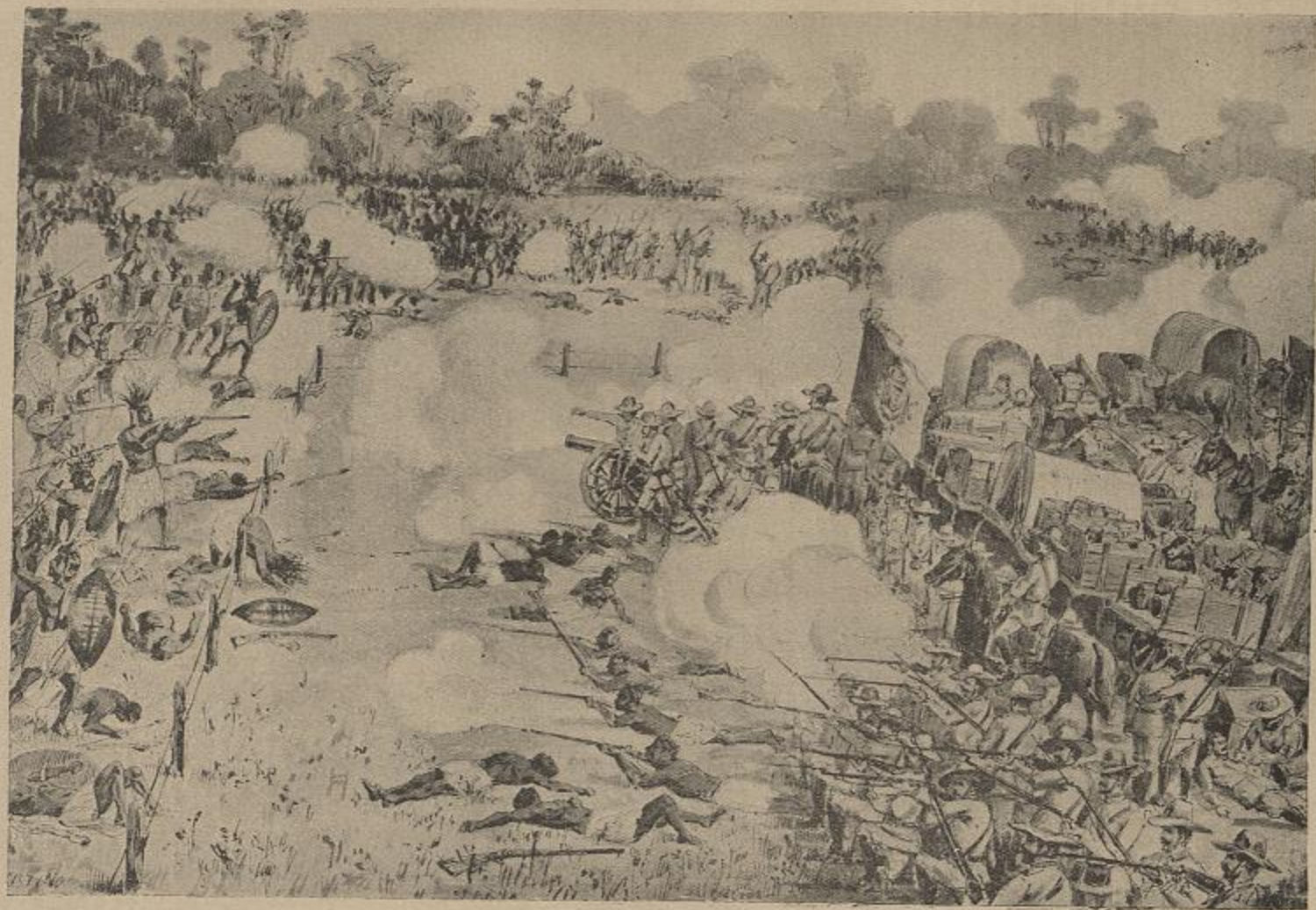
O COMBATE DE COOLELLA — Vid. artigo «Prisão do Gungunhana»