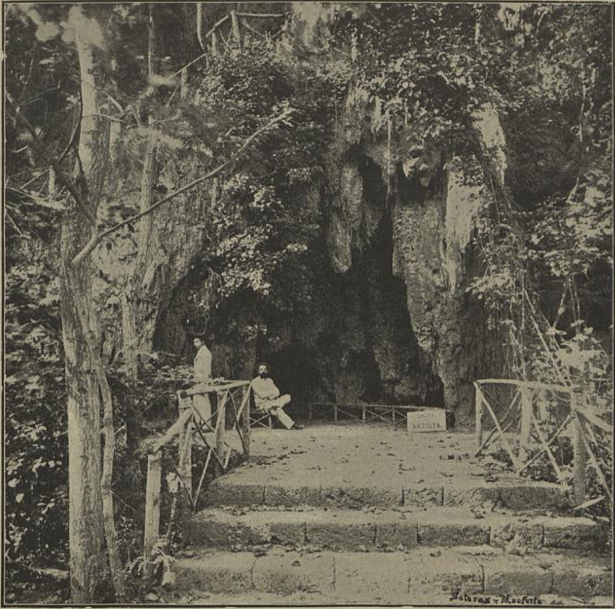
A GRUTA DO ARTISTA, NO MOSTEIRO DE PEDRA