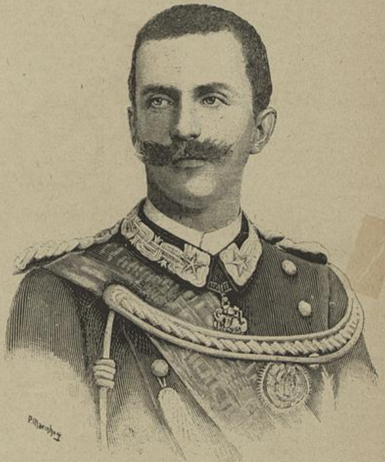
S. M. O REI VICTOR EMMANUEL III