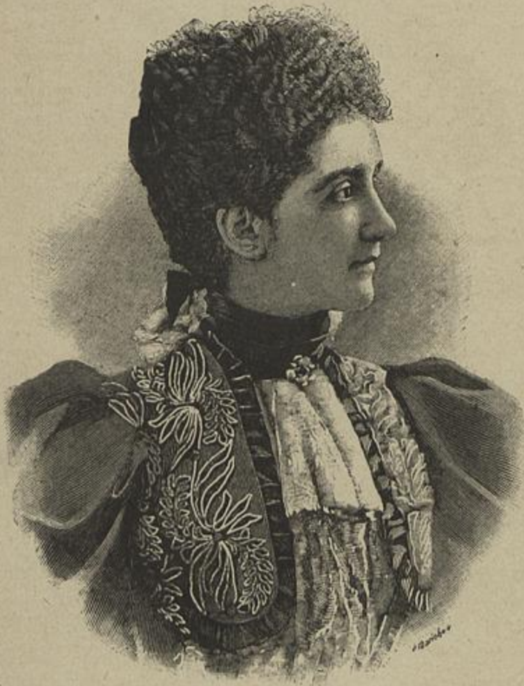
S. M. A RAINHA HELENA