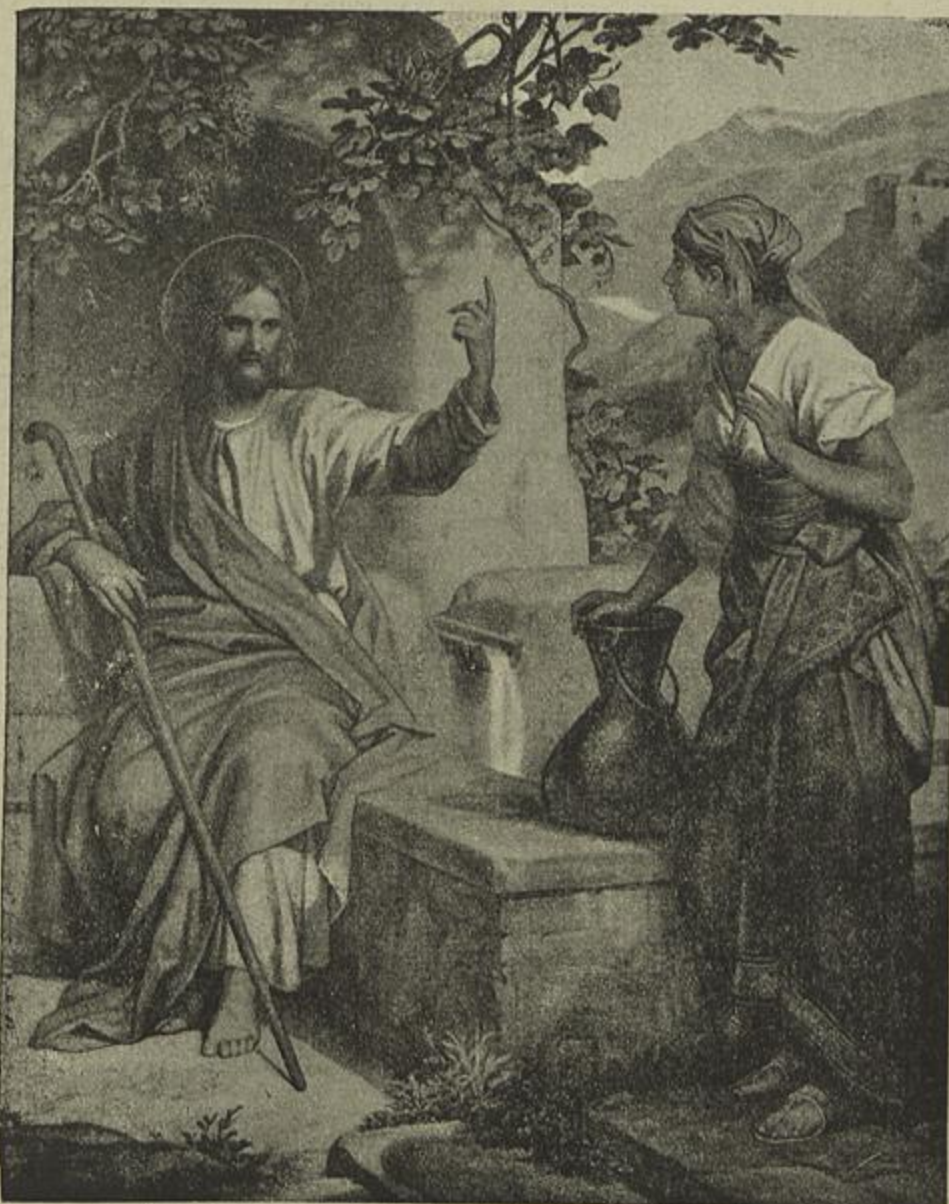
JESUS CHRISTO E A SAMARITANA

Portugal, graças aos meritos de seus filhos e aos caprichos da sua boa estrella, orgulha-se de possuir uma tradição brilhantissima. O espirito