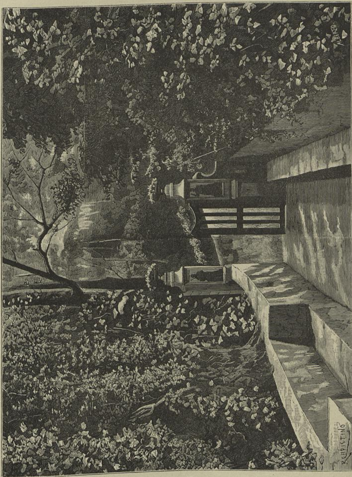
LAPA DOS ESTEIOS, NA QUINTA DAS CANNAS, EM COIMBRA, ONDE CASTILHO CELEBROU A ENTRADA DA PRIMAVERA DE 1822