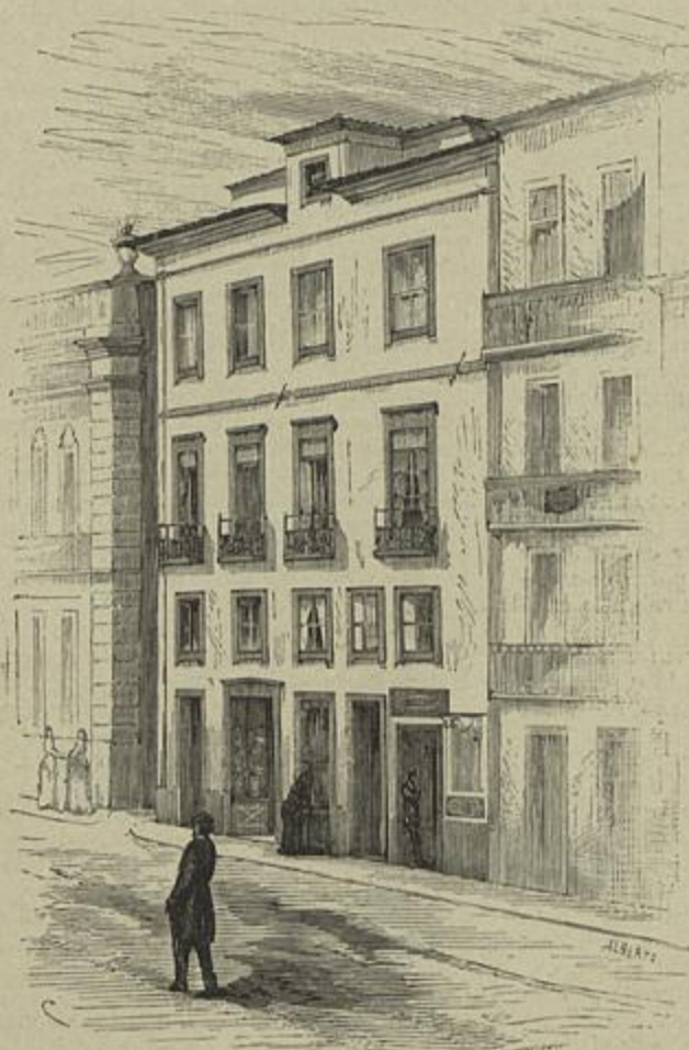
CASA ONDE NASCEU CASTILHO, NA RUA DA TORRE DE S. ROQUE, EM LISBOA, EM 1800

Castilho é, sem duvida, depois de Camões, o poeta de que mais se ufana Portugal. Tinha seis