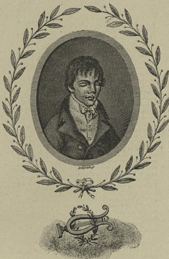
ANTONIO FELICIANO DE CASTILHO AOS 17 ANNOS DE IDADE Copia da gravura feita por F. F. Soeiro em 1817