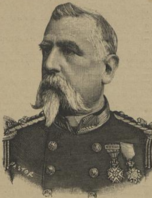
VISCONDE DE VILLA NOVA DE OUREM

Então, do canto escuro das maquinas, cuja massa gigantesca surge de baixo, de traz dos madeiramentos das rodas, avança lentamente um vulto comprido, vacillante, cheio de farinha dos pés á cabeça. Vê-se-lhe o rosto pallido em que só se lê aquella estupidez que os annos produzem, um nariz algum tanto vermelho que desce até ao queixo cheio de bocadinhos de palha; uns olhos sem brilho e desconfiados que se escondem sob uns supercilios arripiados, uma bocca que parece agitada por um mascar constante.