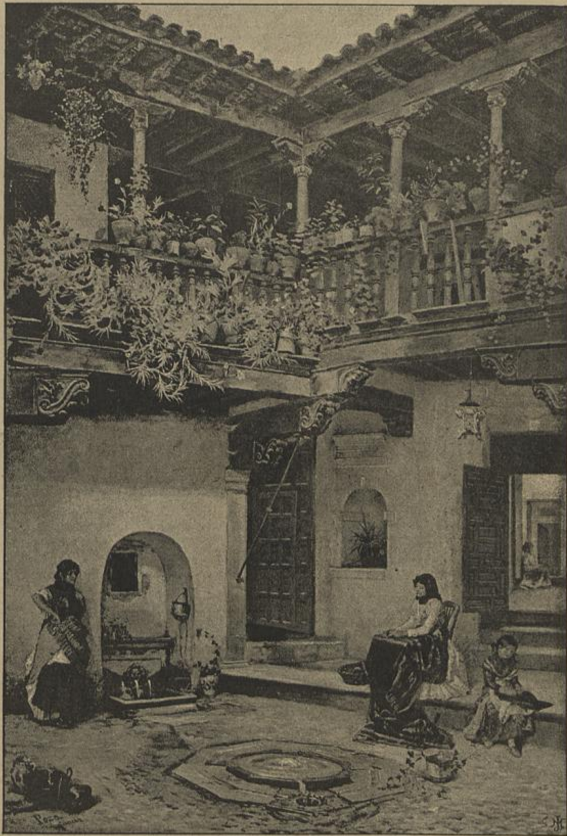
PATEO DE UMA CASA DE GRANADA

em Muza toda a ruindade propria do ciuime cobarde, intrigado pelo emir junto do califa Walid, esteve em grave risco de acabar com labeo de infamia uma carreira militar de immenso brilho. Foi todavia o alliado do conde Julião e dos seus sequazes quem findou os dias da vida ralado de desgostos em parte incerta da Arabia, victima da crueldade ferina de Suleyman que succedera a Walid no califado de Damasco.