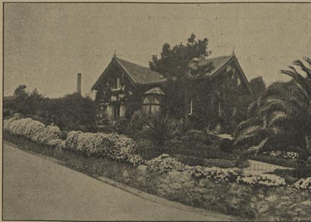
MONT'ESTORIL. — VILLA LEONOR

No numero dos descontentes deve incluir-se Oppas, que via na pessoa do monarcha um obstaculo sério á satisfação do seu desejo de sentar-se na cadeira arcebispa de Toledo.