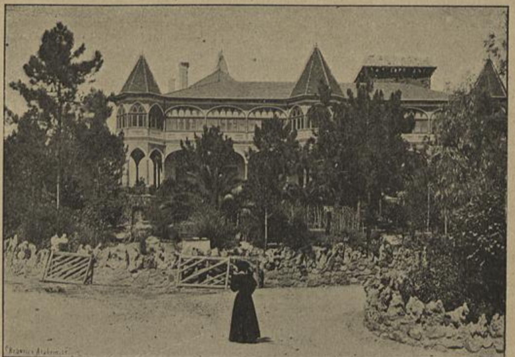
MONT'ESTORIL. — CASINO INTERNACIONAL

A palavra Gibraltar que designa actualmente o estreito que liga o Mediterraneo ao Atlantico e separa a Hespanha do imperio marroquino, foi o