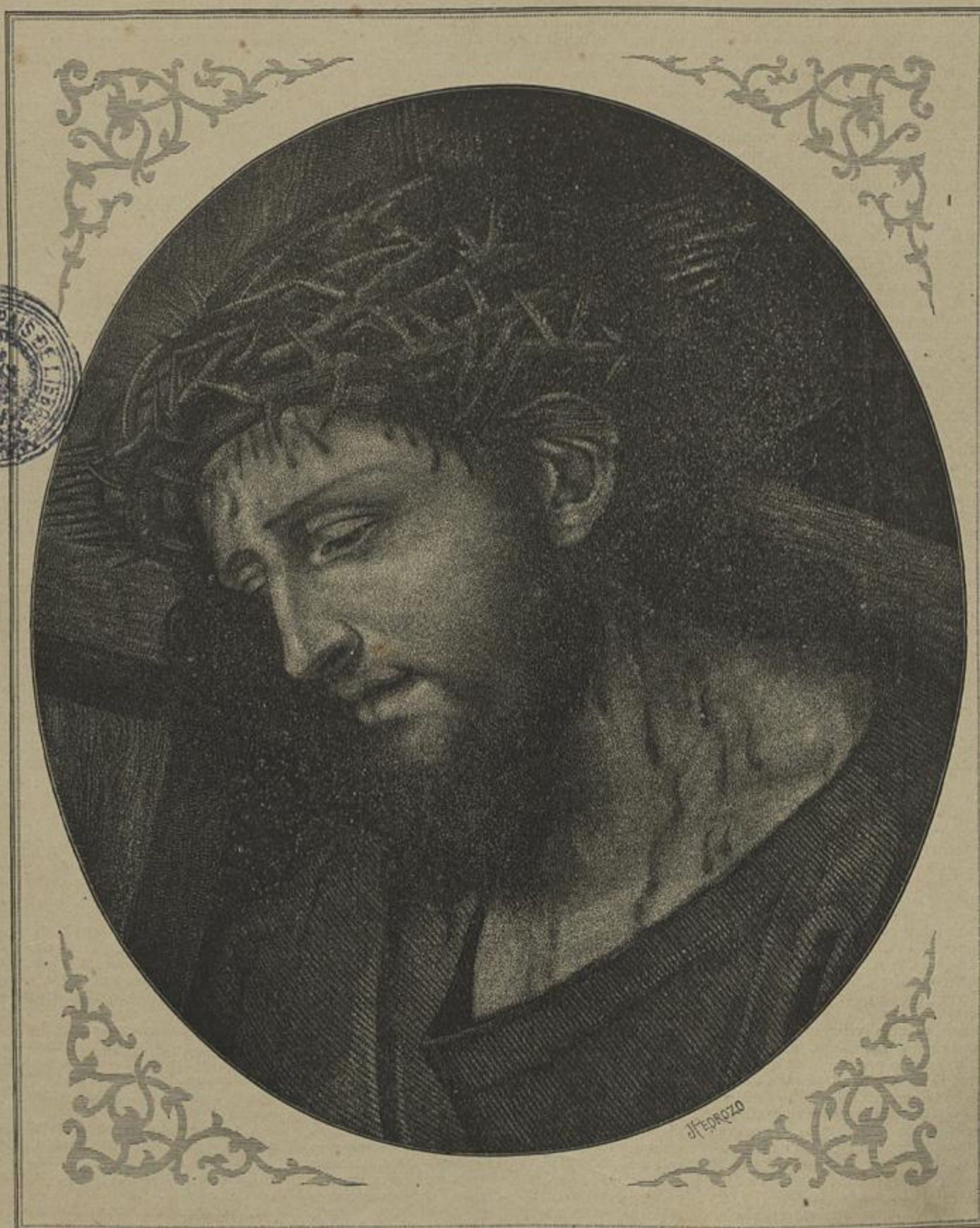
CHRISTO — Quadro de Bernardino Luini — EXISTENTE NA ACADEMIA DE BELLAS ARTES DE LISBOA