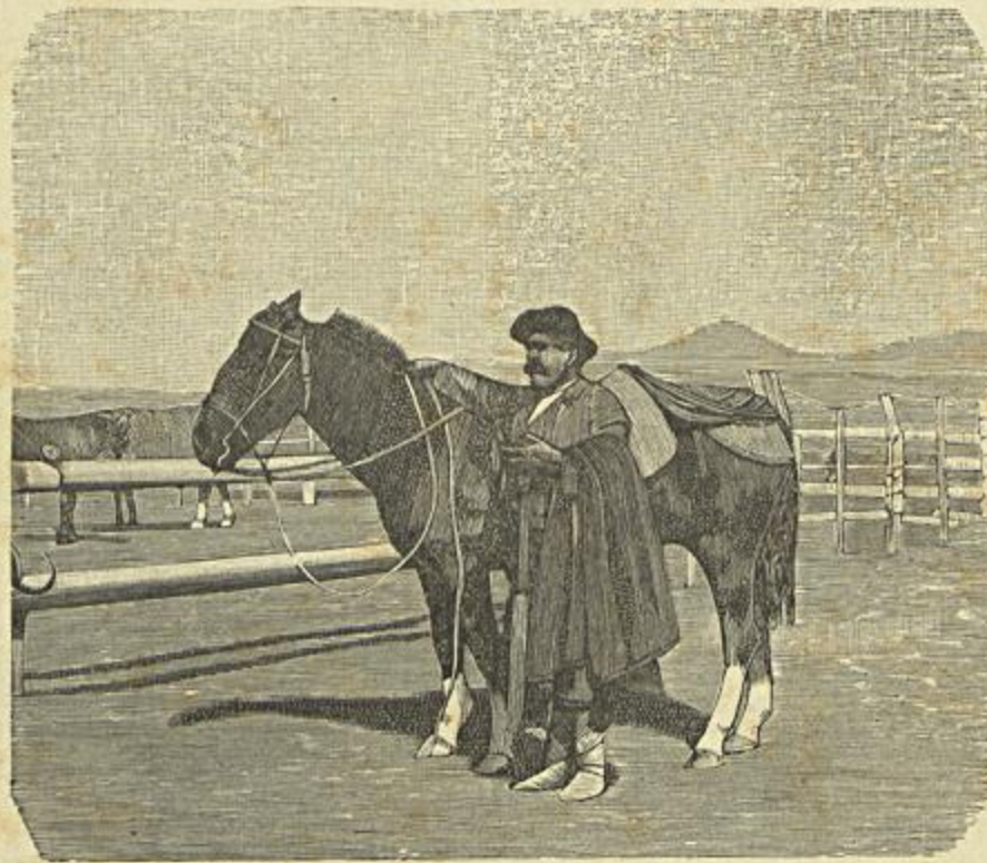
BUENOS AIRES — UM HOMEM DO CAMPO N'UM POTRIL

Esta mutação não se fez sem demonstrações aggressivas ao dictador, por parte do exercito e da armada brasileira, que se levantou em massa contra o general Deodoro.