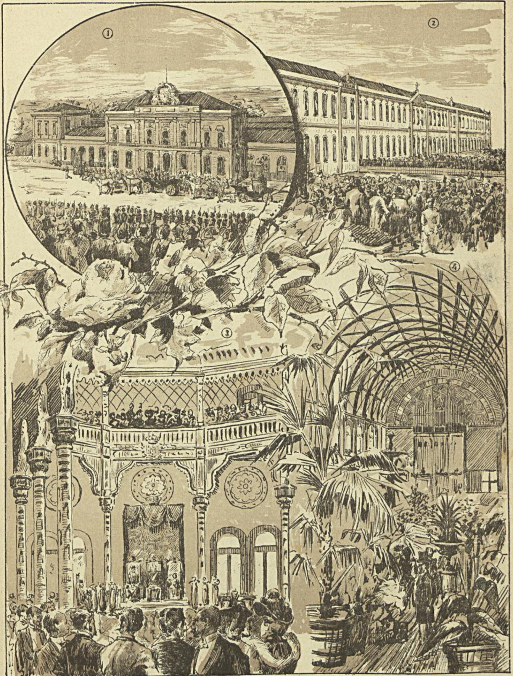
1 Chegada á estação de Campanhã. — 2 Visita ao Hospital do Conde Ferreira. — 3 Inauguração da Bolsa. — 4 A Exposição no Palacio de Chrystal.