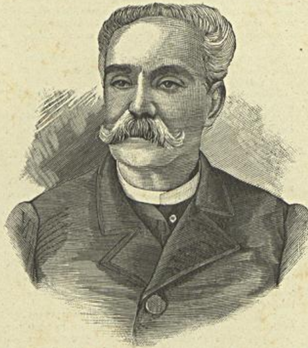
O ACTOR CESAR POLLA — FALLECIDO EM 19 DE JUNHO DE 1891 (Segundo photographia)

A idade, porém, principiou a attraçõal-o ahi