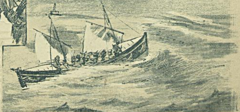
1 A Flotilha — 2 Casa de Joaquim Lopes, em Paço d'Arcos — 3 A saída do Cortejo funebre do Arsenal — 4 O Salva Vidas.