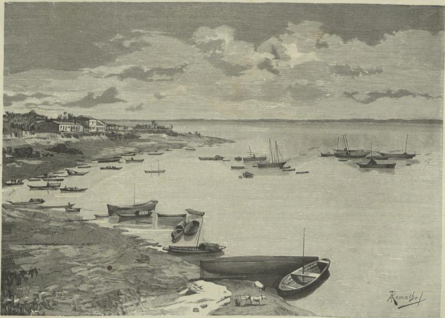
AMAZONAS — MANAUS (Desenho de A. Ramalho)