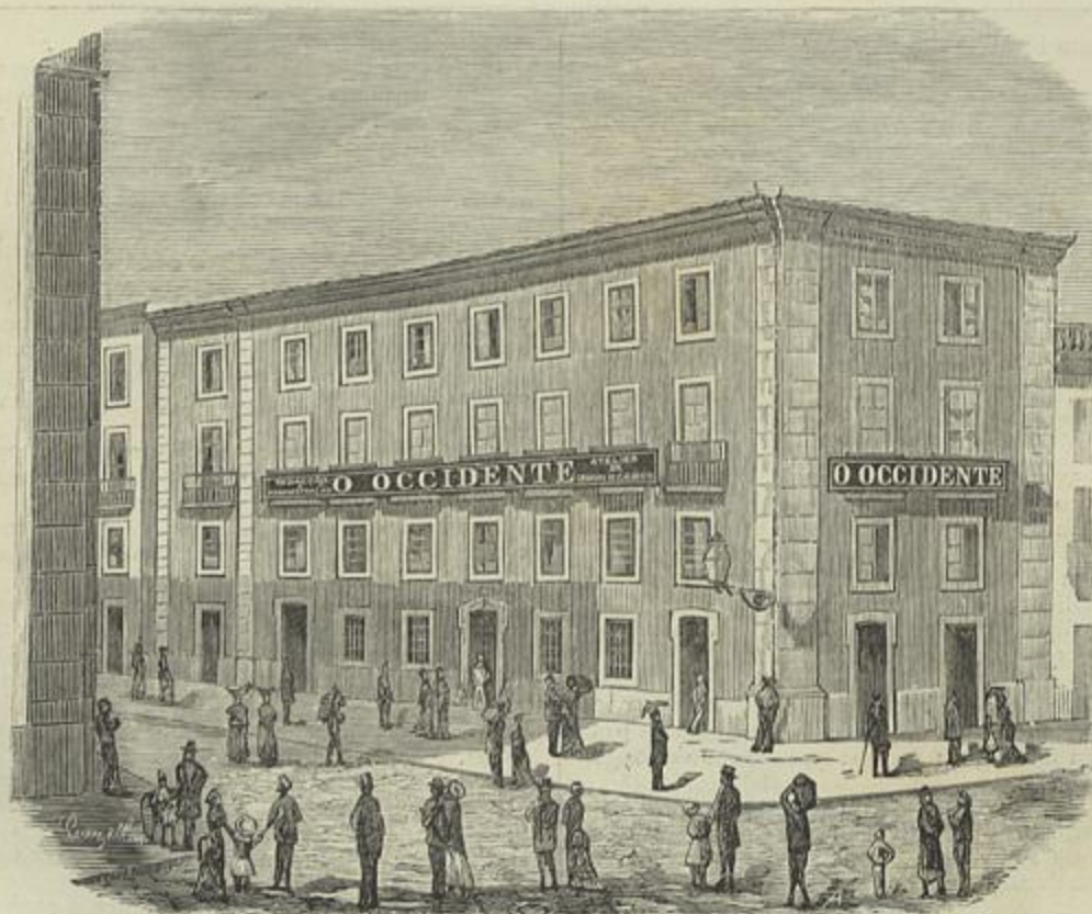
A NOVA CASA DA EMPRESA DO OCCIDENTE

CAMINHO DE FERRO DE AMBACA. Consta-nos que ha uma proposta para construir este importante caminho de ferro em dezoito mezes! Seria pasmoso, mesmo em Portugal, onde, ha não sabemos quanto tempo, estão concedidos os caminhos de Cintra e de Torres, e ainda a sua construção está atrazadissima, quanto mais em Africa! No art. 1.º do projecto apresentado ás camaras pelo sr. Pinheiro Chagas, diz-se que o governo o fará executar pelos meios que julgar mais conveniente, e sendo a maior conveniencia n'estes assumptos a brevidade, tanto mais necessaria nas presentes conjuncturas, para oppôr á accusação de desleixo