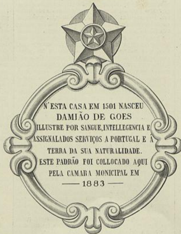
INSCRIPÇÃO NA CASA DE DAMIÃO DE GOES, EM ALEMQUER

CAPO SUBMARINO. Por noticias recebidas directamente sabemos que já partiu para Cabo Verde o material e pessoal relativo ao cabo que ha de ligar a nossa Africa occidental com a Europa. E mais podemos noticiar, que, a não haver algum obstaculo de força maior, o cabo devia ficar assente entre a ilha de S. Thiago e de Santo Antão no dia 7 ou 8 do corrente. Bem haja o sr. Pinheiro Chagas que soube contractar com