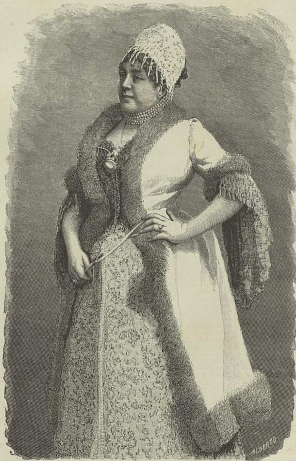
A ACTRIZ ANNA JUDIC