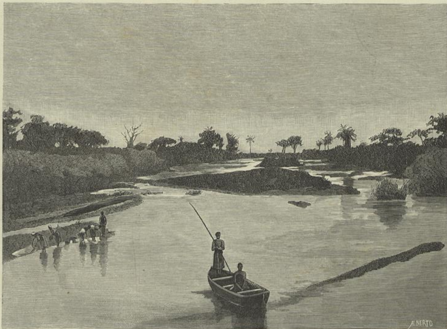
AFRICA PORTUGUEZA — NO RIO ZAIRE (Segundo uma photographia de Moraes)

Feitas estas observações, como descargo de consciencia, tratemos agora dos nossos diabos. Para bem os conhecer, cumpre saber-se primeiramente, que segundo a escola philosophica-theologica do Egypto, o homem era completo de intelligencia, corpo e alma; esta ultima era uma substancia intermediaria entre o corpo e a intelligencia, a qual vinha a ser uma como parcella divina, revestida de luz. Esta luz, porém, abandonava a intelligencia, quando ella principiava a fazer parte do ser humano. Além das tres entidades que ficam mencionadas havia ainda uma quarta, o espirito, cujas funcções eram transmitir á materia as ordens que recebia da alma. A alma, diz o escriptor a que já nos referimos, é o involucro da intelligencia; o espirito o involucro da alma; o corpo o involucro do espirito: todas estas partes, de origem e com virtudes diferentes, unem-se por um laço invisivel, que dura tanto como a vida, e a reunião de todas el-