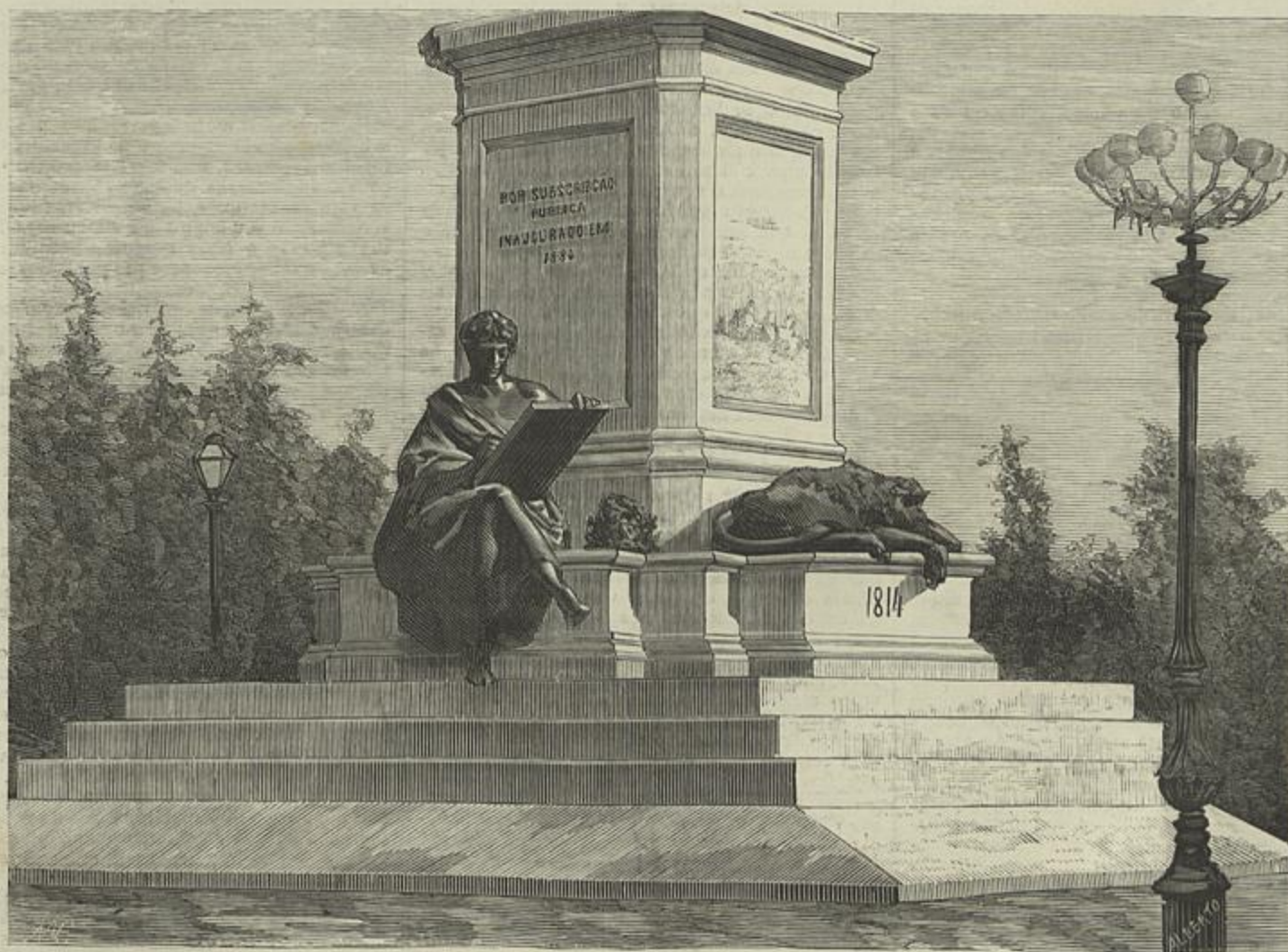
MONUMENTO AO GENERAL MARQUEZ DE SÁ DA BANDEIRA — ESTATUA DA HISTORIA, NO LADO POSTERIOR DO MONUMENTO

Na Italia principalmente, o numero de victimas, e sobretudo o numero de atacados tem sido até hoje desolador, duplamente triste porque tende a