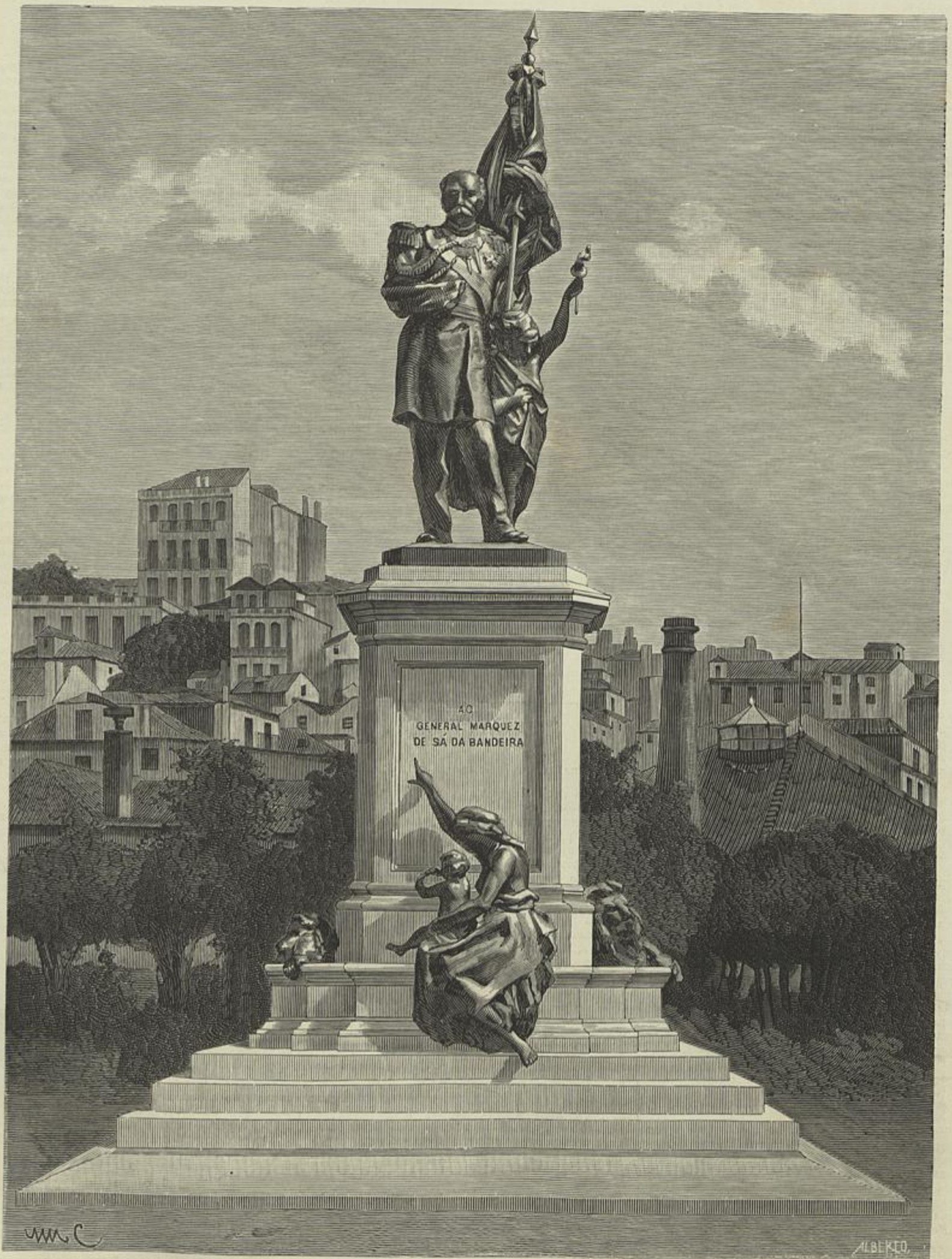
MONUMENTO AO GENERAL MARQUEZ DE SÁ DA BANDEIRA, NA TRANÇA DE D. LUIZ, EM LISBOA