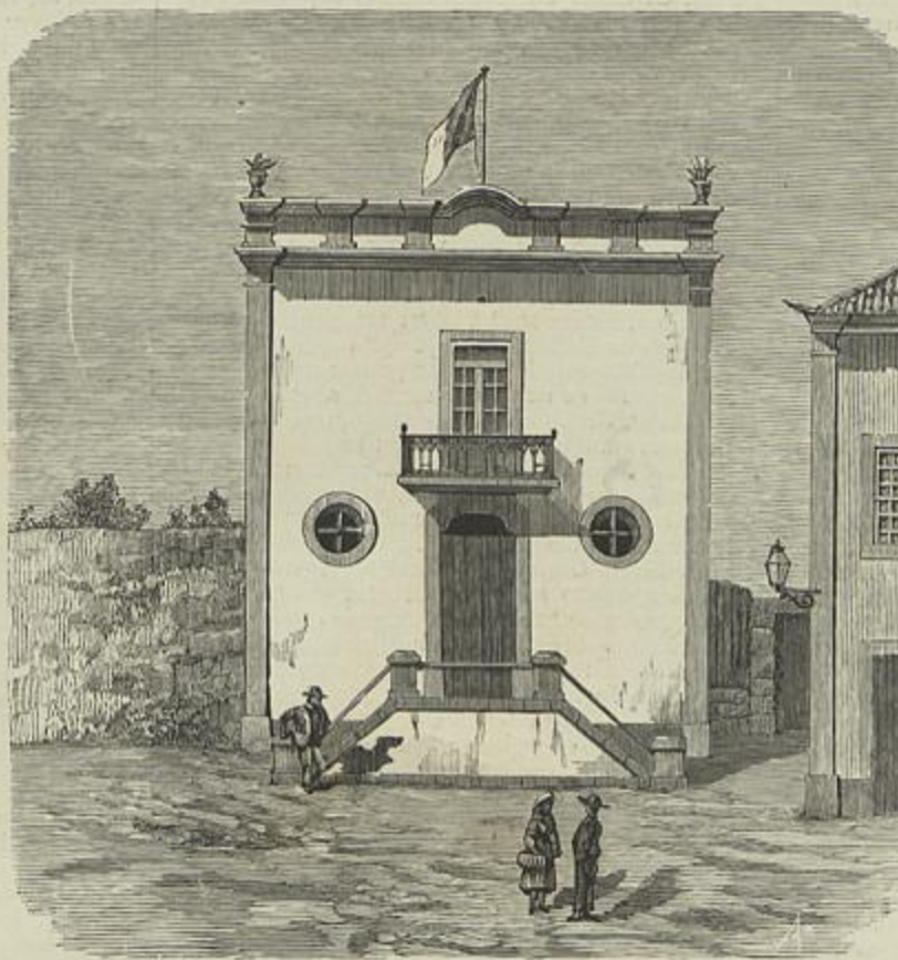
THEATRO OLIVEIRENSE, EM OLIVEIRA D'AZEMEIS

Da primeira essencia florestal, principalmente, os productos corticaes apresentados corroboram o que dissemos antes relativamente á situação da importante propriedade rural, cuja representacão na exposição agricola de Lisboa deve ser mencionada com justo e merecido louvor á correcta interpretação dada, por esta fórmula, aos preceitos fundamentaes da boa organisação d'estas revistas, em que figuram os mais valiosos elementos do progresso nacional.