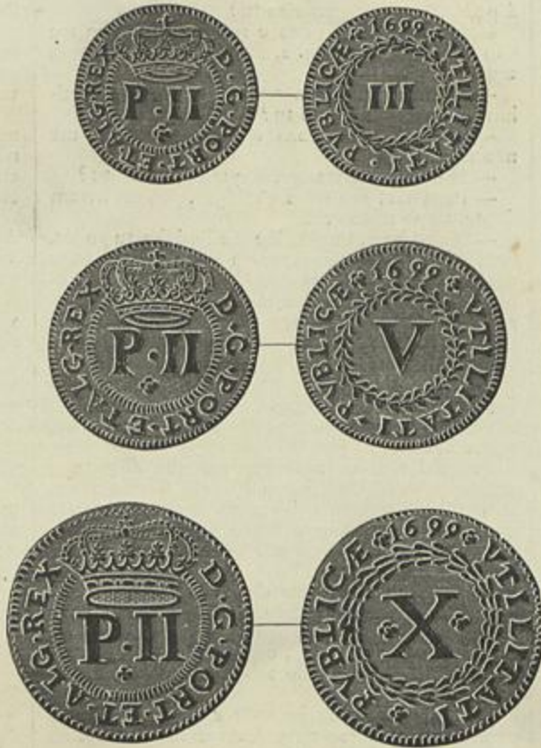
MOEDAS DE COBRE DO REINADO DE D. PEDRO II QUE RETIRAM DA CIRCULAÇÃO