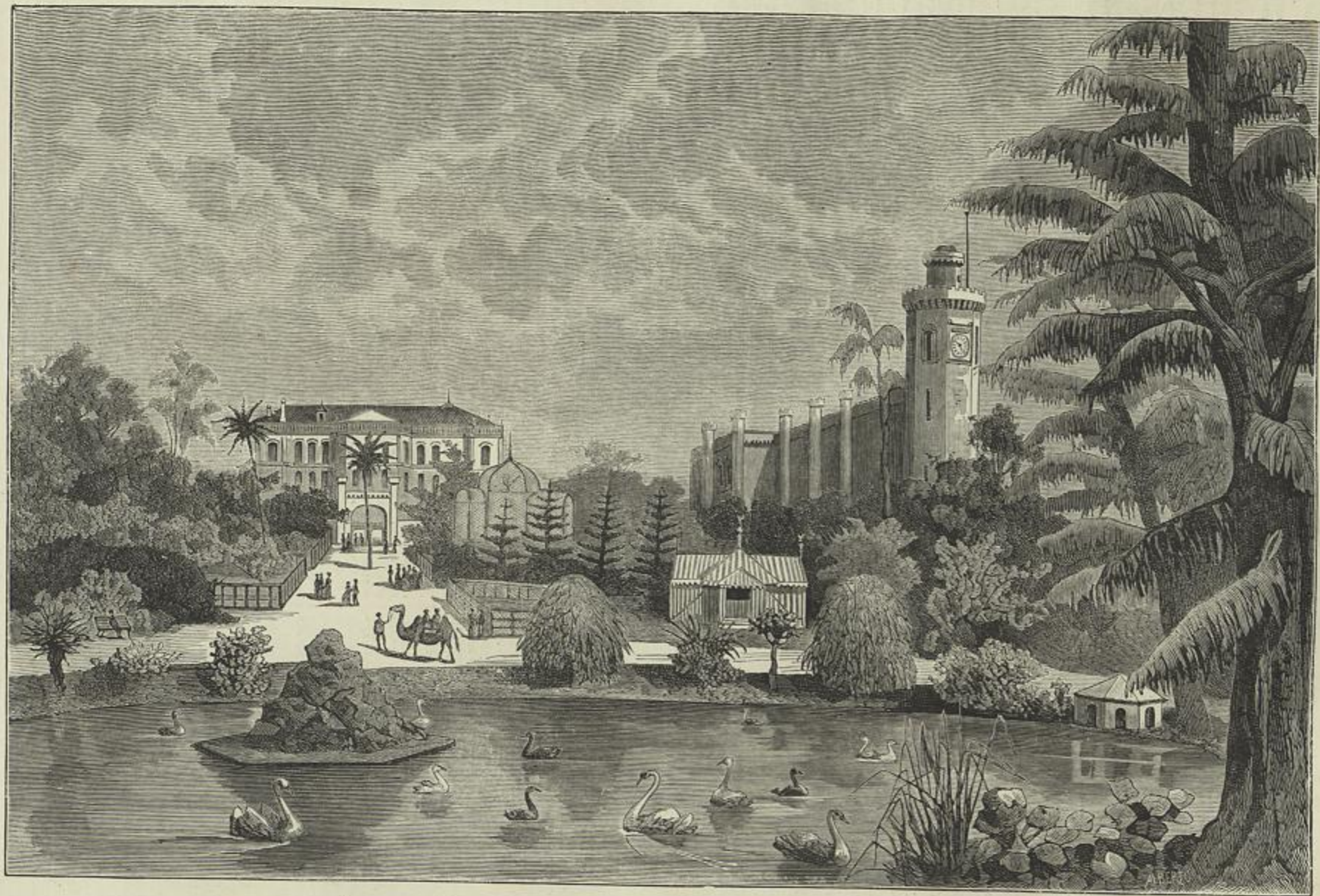
VISTA GERAL DO JARDIM ZOOLOGICO DE LISBOA, TIRADA DO KIOSQUE DA MUSICA (Desen'õ do natural por Christino)