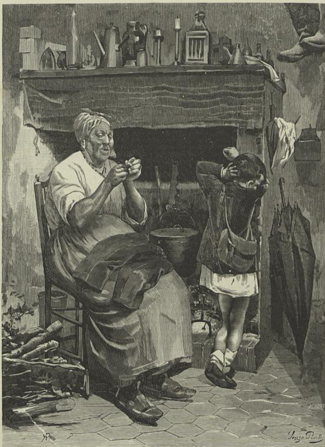
AS CALÇAS ROTAS, QUADRO DE SOUZA PINTO (Desenho de A. Ramalho)

a sua vida no sagra- do labor do justo, do bom, e do verdadeiro.