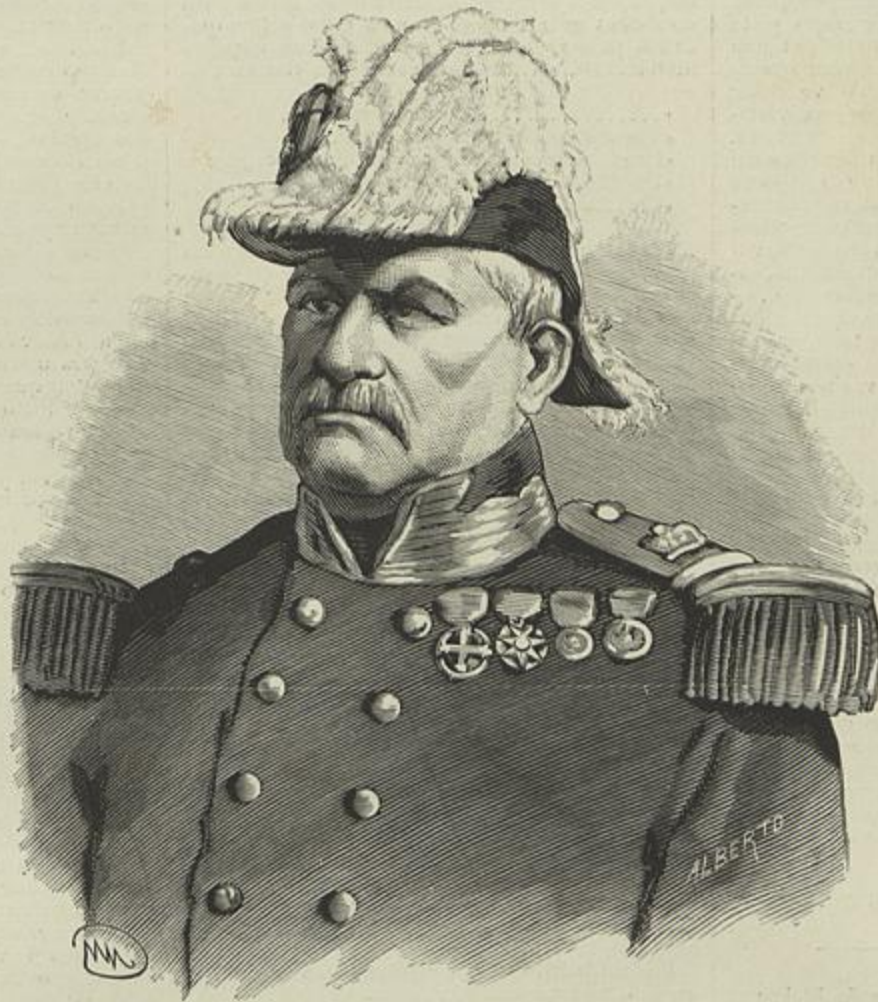
O MARECHAL DE CAMPO, LUIZ DE SÁ OSÓRIO DE MELLO MENDONÇA E ALBUQUERQUE (Segundo uma photographia)

O conjuncto d'este quadro, — onde a original individualidade do auctor emerge e destaca dos effeitos rebuscados, — é-me estranho, ao mesmo tempo attrahente e incomprehensivel, real e phantastico: tudo por culpa do harpagonico burguez