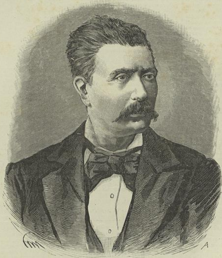
O GENERAL D. PORFIRIO DIAZ, NOVO PRESIDENTE DA REPUBLICA DO MEXICO

«Eu não perderei o meu tempo a chorar a morte de um touro, quero apenas reduzir ás suas verdadeiras proporções as façanhas do toureador, cantado pelos poetas. As touradas peccam por falta de grandeza. Eu não desgotaria de todo de ver, publicamente, o homem lutar no circo com uma fera. Tal espectáculo talvez fosse mesmo uma licção util para o que se chama mocidade estudiosa. Ver a coragem reflectida do homem combater a força