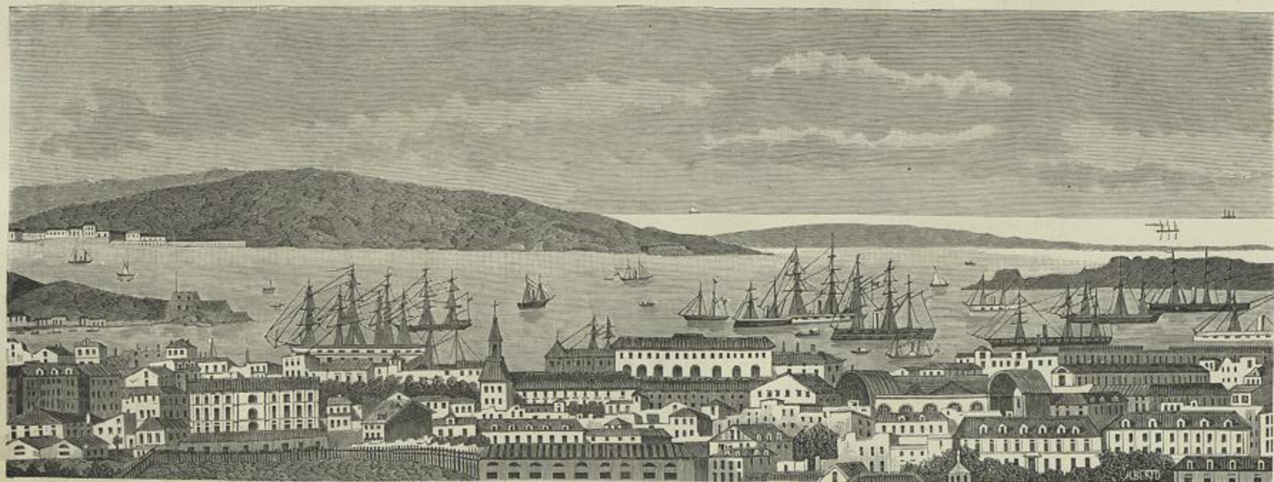
VISTA GERAL DA CIDAD E PORTO DE TOULON