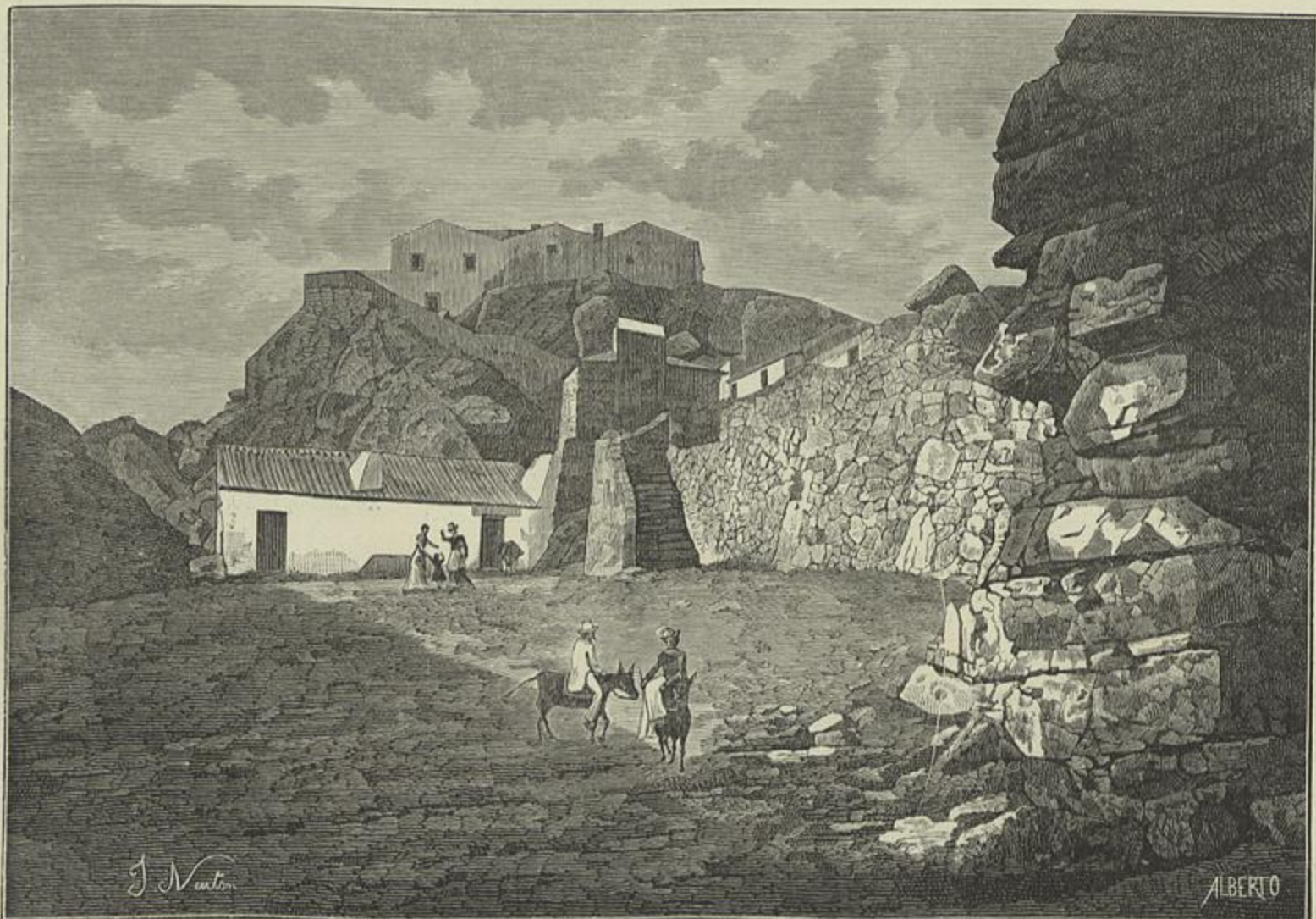
CINTRA — CAPELLA DA PENINHA (Segundo uma photographia)