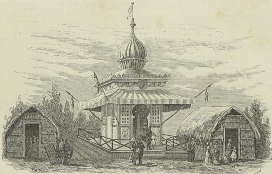
EXPOSIÇÃO AGRICOLA — SECÇÃO DO BANCO ULTRAMARINO (Desenho do natural por Casellas)

Para indicar a utilidade da exposição d'um estabelecimento d'ensino como é o Instituto Geral d'Agricultura, é preciso, porém, descrevel-a nos seus traços mais salientes.