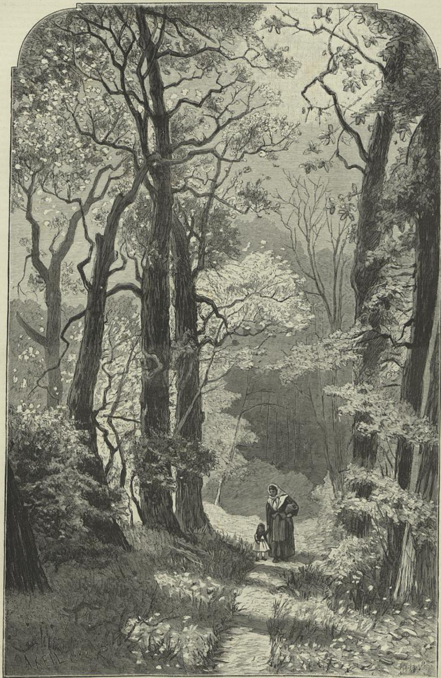
A PRIMAVERA — QUADRO DE ALFREDO KEIL, PERTENCENTE A S. M. EL-REI D. LUIZ (Desenho do mesmo auctor)