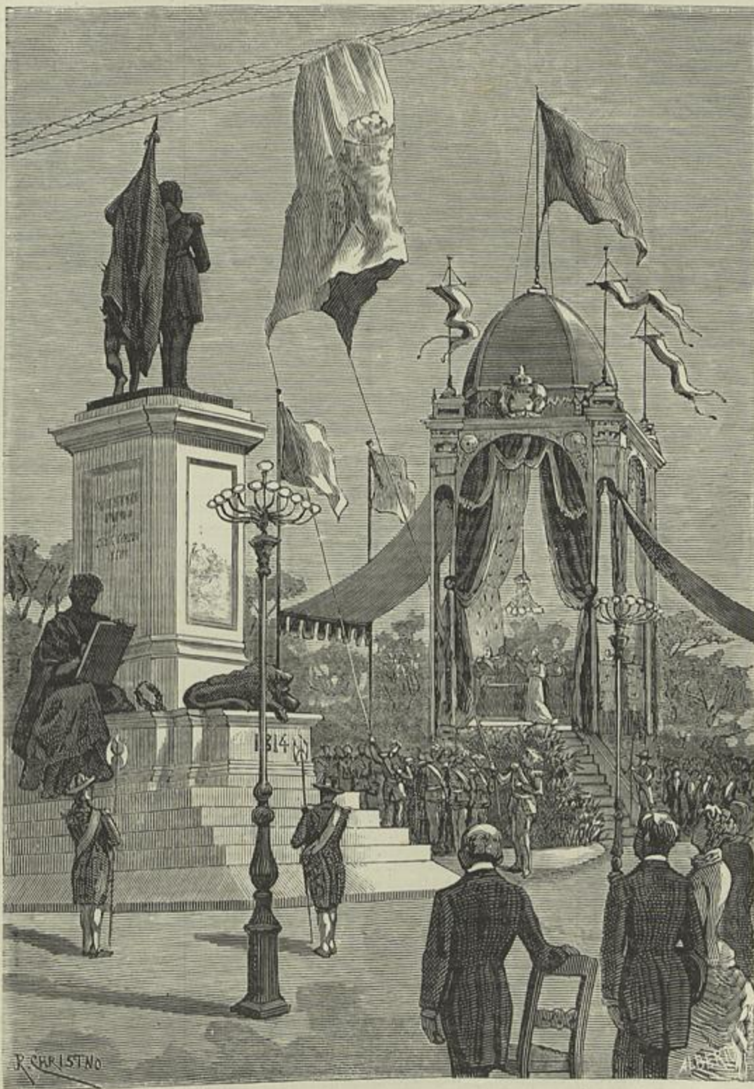
INAUGURAÇÃO DO MONUMENTO AO MARQUEZ DE SÁ DA BANDEIRA, NA PRAÇA DE D. LUIZ, EM LISBOA 31 DE JULHO DE 1884

Eu não sei bem se estou escrevendo em Lisboa, n'esta bella cidade montanhosa que possui no seu seio os altos de Santa Catharina, Graça, Monte, S. Pedro d'Alcantara e tantos outros onde os meus avós costumavam ir gosar o fresco, nas quentes tardes de verão, ou se estou apenas á sombra de qualquer bananeira da Africa Occidental, onde o thermometro official marca invariavelmente, n'uma assiduidade um pouco rara em empregados publicos, 38 a 40 ou mais graus acima de zero; o que sei é que tenho um calor medonho, impossivel de combater com os sorvetes do Martinho, e renitente a todas as correntes de ar e a todos os banhos frios. Um horror! Brisa nem