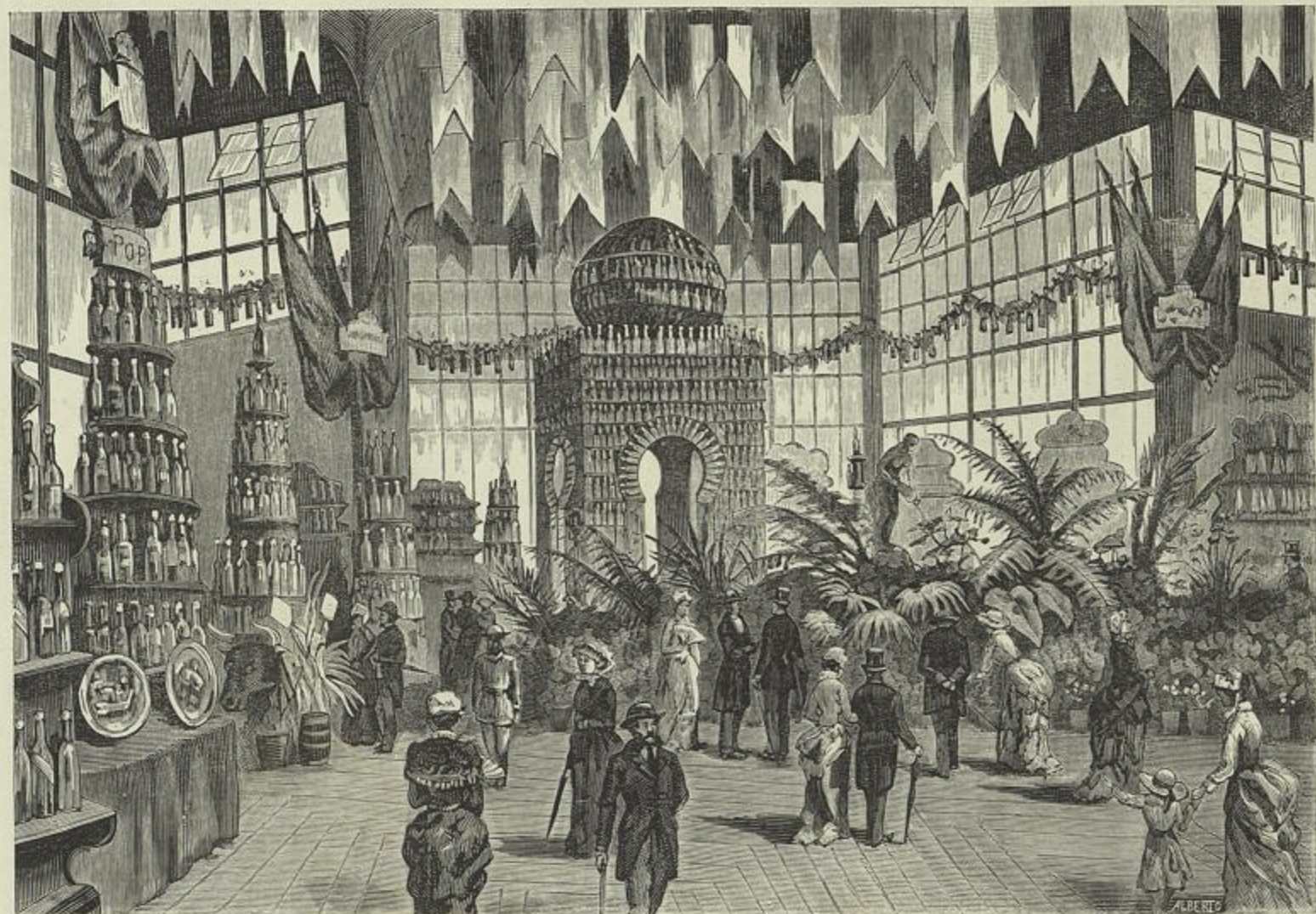
EXPOSIÇÃO AGRÍCOLA — INTERIOR DO PAVILHÃO CENTRAL. (Desenho do natural por J. Christino e M. de Macedo).