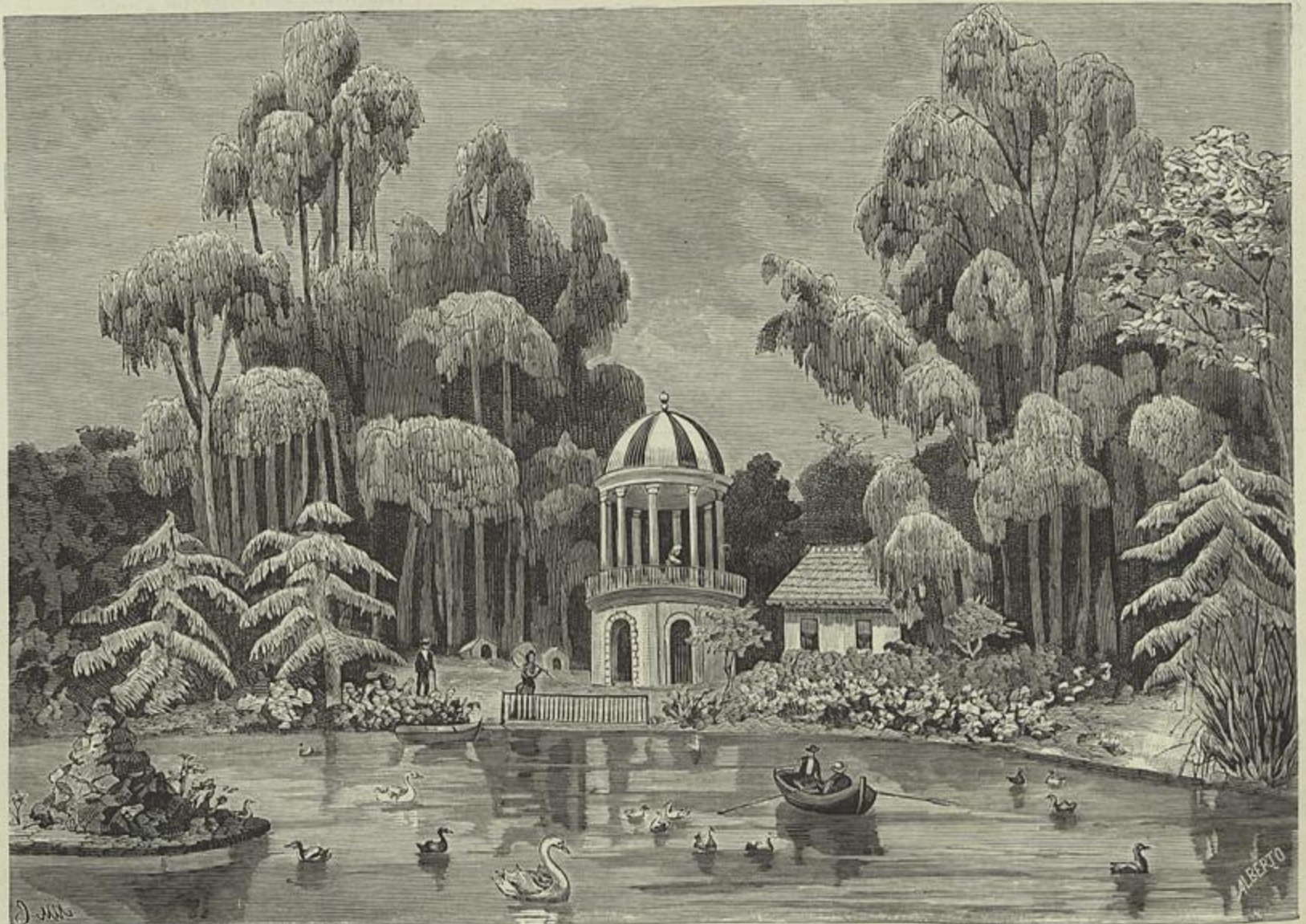
O LAGO CENTRAL DO JARDIM ZOOLOGICO (Desenho de J. Christino e M. de Macedo)

O interessantissimo estabelecimento, a cuja inauguração (modestamente realizada, sem ostentações nem pompas) Lisboa assistiu com as mais significativas demonstrações de sympathia e de entusiasmo no dia 28 de