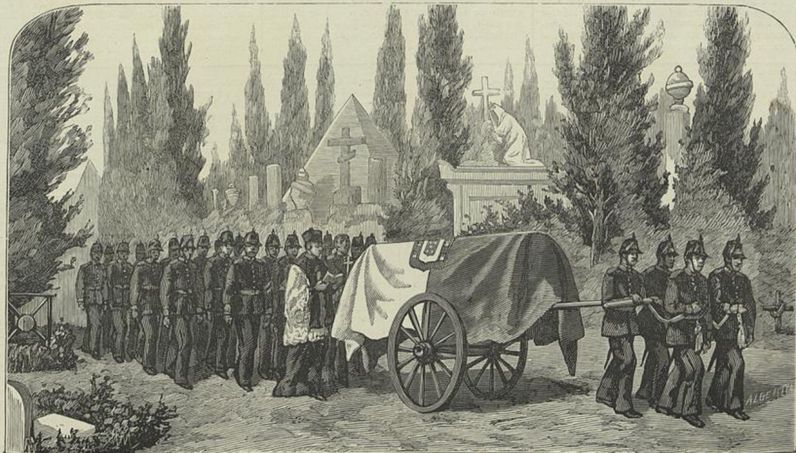
ENTERRAMENTO DAS PRAÇAS DE PRET DO EXERCITO PORTUGUEZ — CARRETA CONDUZINDO O FERETRO (Desenho do natural por M. de Macedo)

É altamente digno de louvor o sr. Morley pelo melhoramento importante que d'esta fórma introduz no serviço de saude do exercito. Todos se