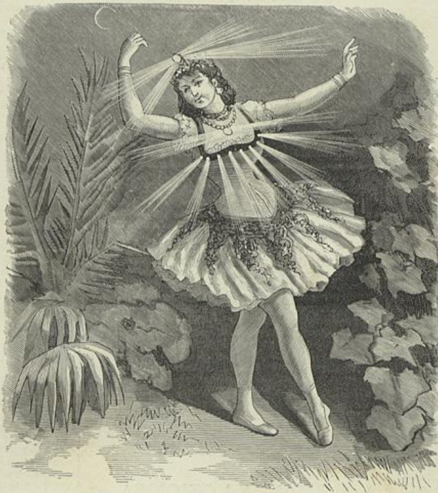
AS JOIAS ELECTRICAS