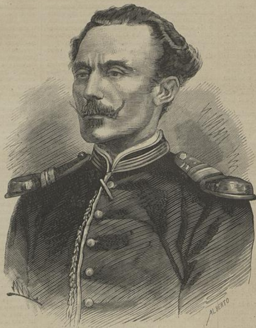
MAJOR JOÃO CARLOS RIBEIRO — Fallecido em Loanda a 3 de março de 1882

Finda a guerra, a obra recommçou; e no dia 14 de março de 1847, era com toda a solemnidade lançada a primeira pedra da frente actual. Cinco annos decorridos, em 1852, apenas se achavam ainda erectos dois terços do frontespicio; porém deu notavel impulso ás obras a