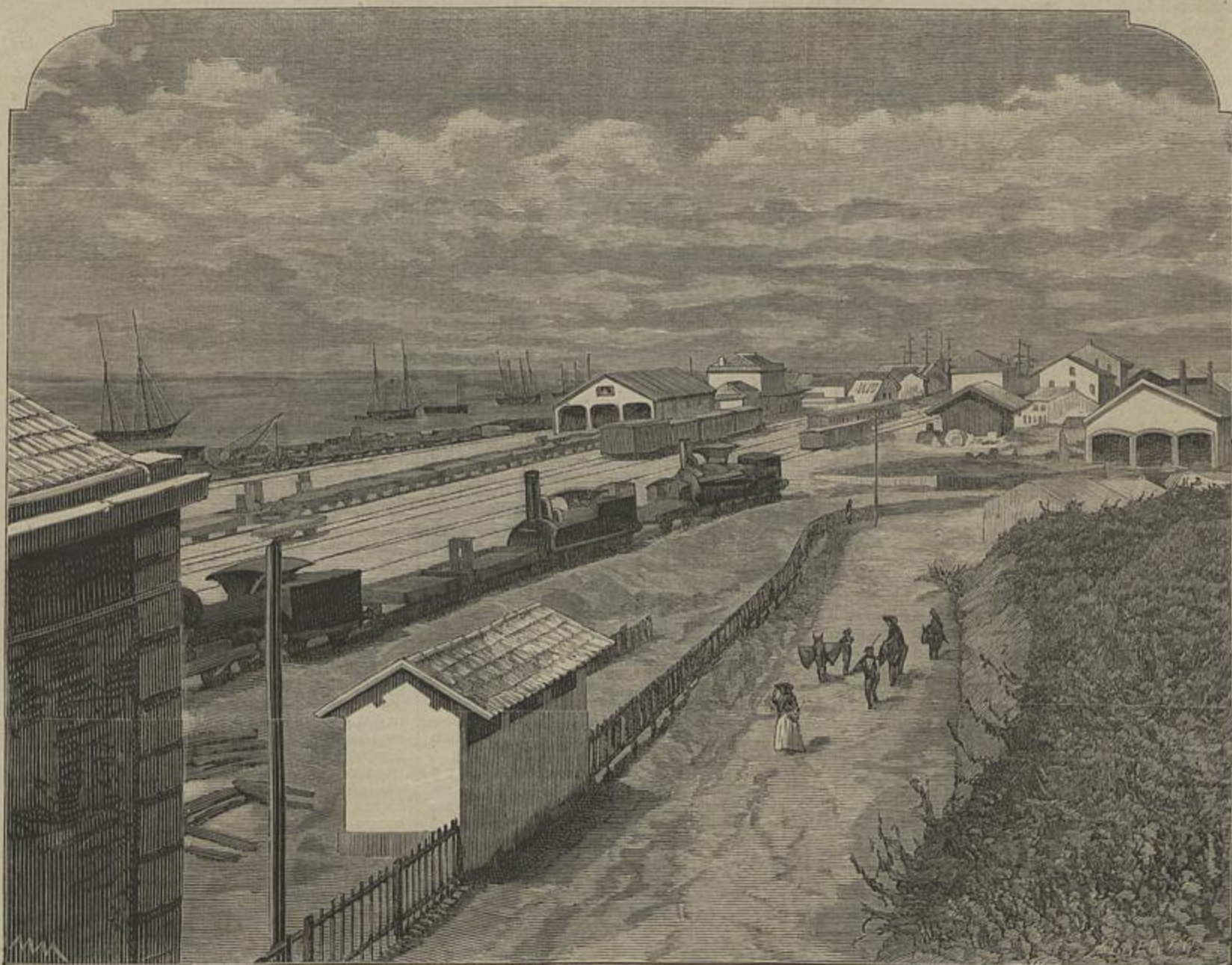
CAMINHOS DE FERRO PORTUGUEZES — ESTAÇÃO DA CIDADE DA FIGUEIRA, NO CAMINHO DE FERRO DA BEIRA ALTA

Não farei nada d'isso. Dando noticia do telegramma chegado do Funchal, faço apenas o meu