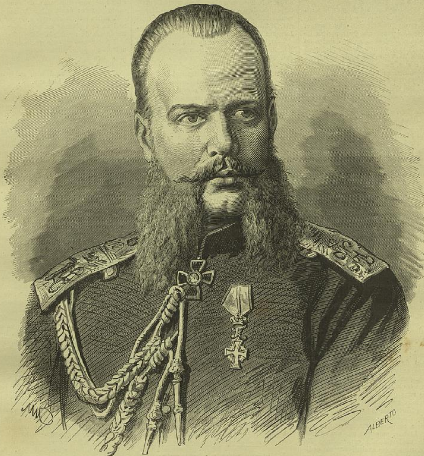
S. M. I. ALEXANDRE III, NOVO IMPERADOR DA RUSSIA