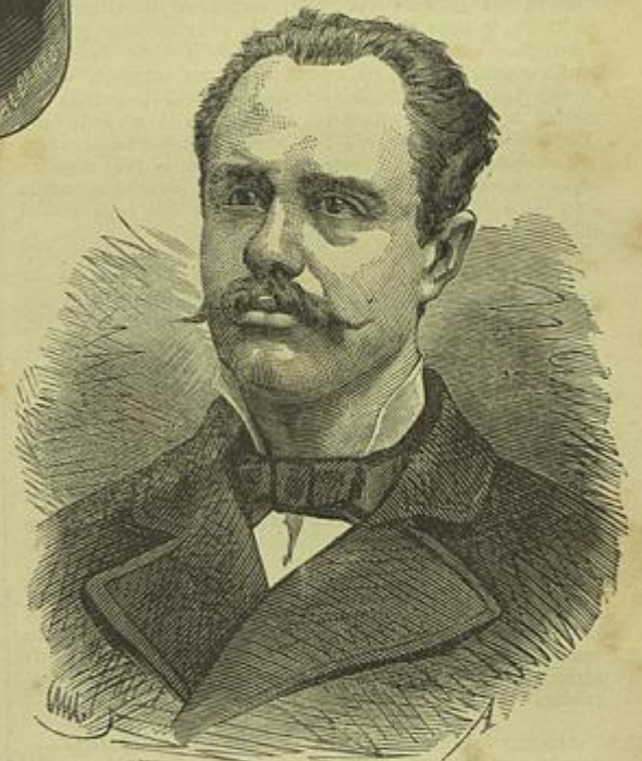
ERNESTO RODOLPHO HINTZ RIBEIRO Ministro das Obras Publicas