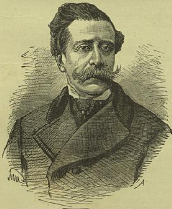
MIGUEL MARTINS DANTAS Ministro dos Estrangeiros