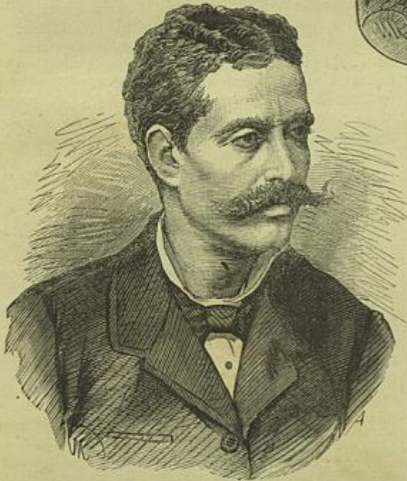
LOPO VAZ DE SAMPAIO E MELLO Ministro da Fazenda