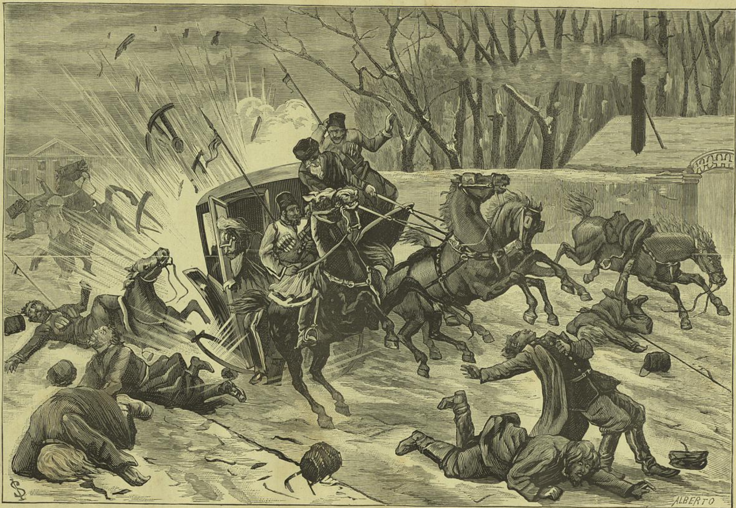
ASSASSINATO DE S. M. I. ALEXANDRE II IMPERADOR DA RUSSIA, NO DIA 13 DE MARÇO DE 1881, EM S. PETERSBURGO (segundo um desenho enviado de S. Petersburgo)