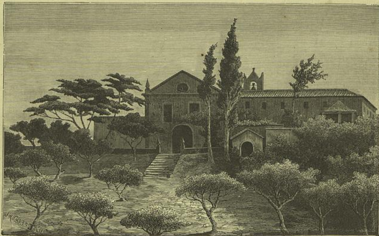
CONVENTO DE SANTO ANTONIO DOS CAPUCHOS NA ALDEIA DA MERCEANA (Desenho do natural por João Christiao)

JORNAL DO DOMINGO, gerente e proprietario Augusto de Sampaio Garrido, n.º 6, Lisboa. — Temos recebido regularmente este semanario, que ha pouco principiou a sua publicação. Vem enfileirar-se entre as publicações illustradas, que hoje constituem um grande meio de desenvolvimento do bom gosto, principian-do, em Portugal, a ser procuradas de preferencia pelo publico, que encontra n'ellas recreio e instrução.