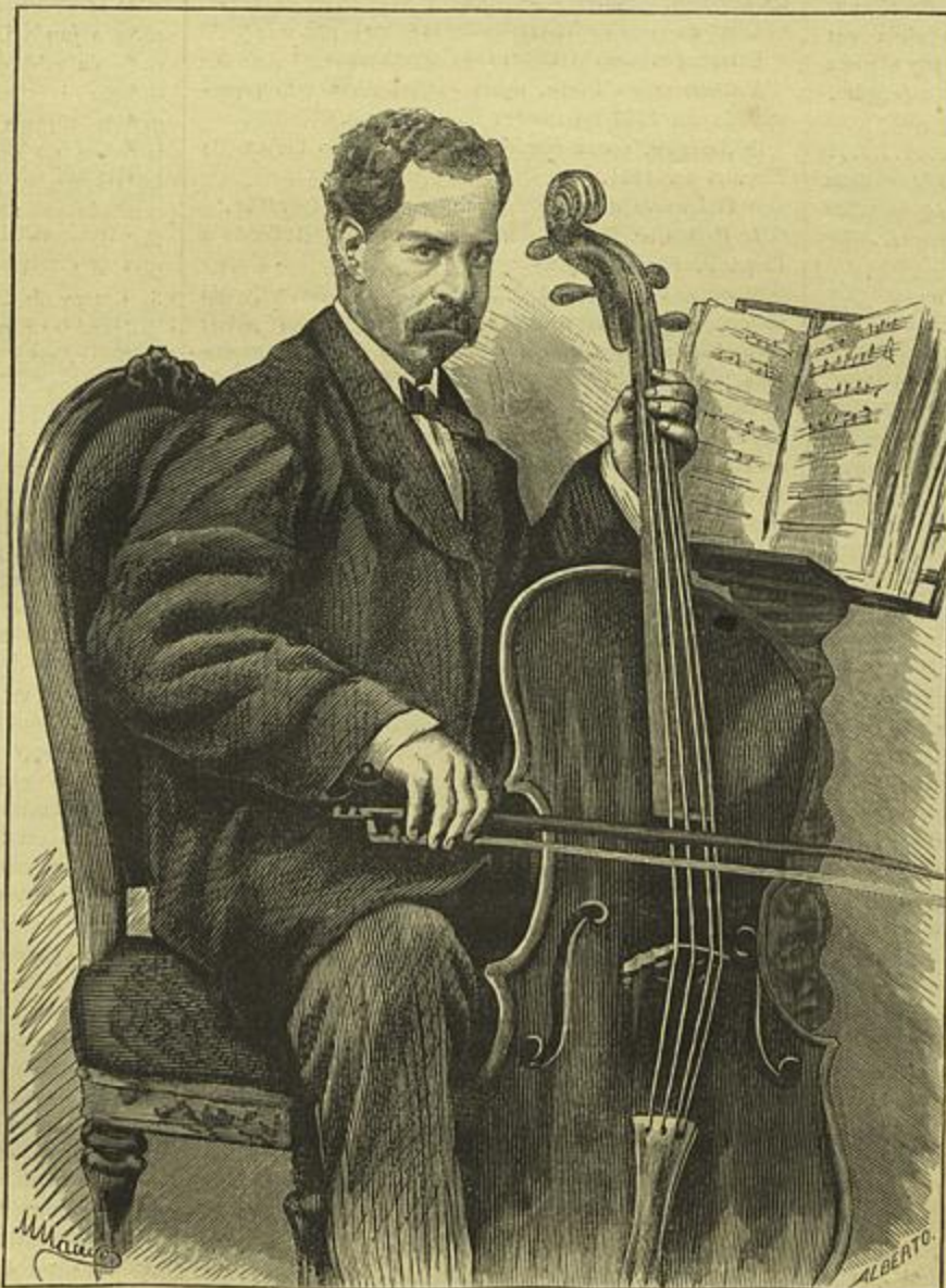
GUILHERME COISSOUL — Fallecido em 26 de Novembro de 1880

nunca conseguiram subjugar a potencia da sua dialectica energica, mas desaffectedada.