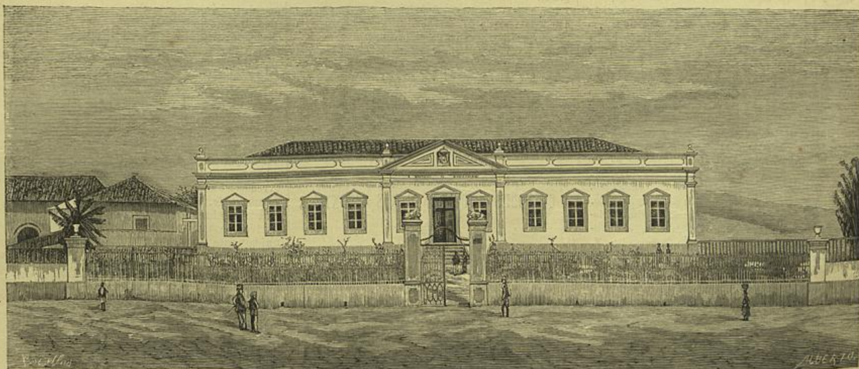
BRAZIL. — HOSPITAL DA SOCIEDADE PORTUGUEZA DE BENEFICENCIA EM CAMPINAS (Segundo uma photographia)