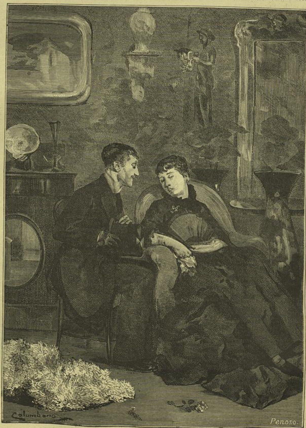
ENCANTADORA PRIMA — Quadro de Columbano Bordallo Pinheiro (Desenho do mesmo auctor)

EXPOSIÇÃO DA SOCIEDADE PROMOTORA DE BELLAS ARTES EM PORTUGAL, EM 1880