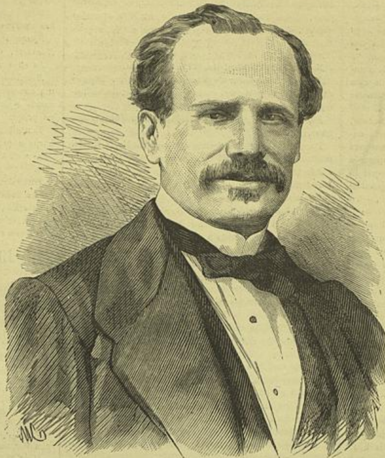
JOSÉ JOAQUIM DE CASTRO — Novo ministro de guerra