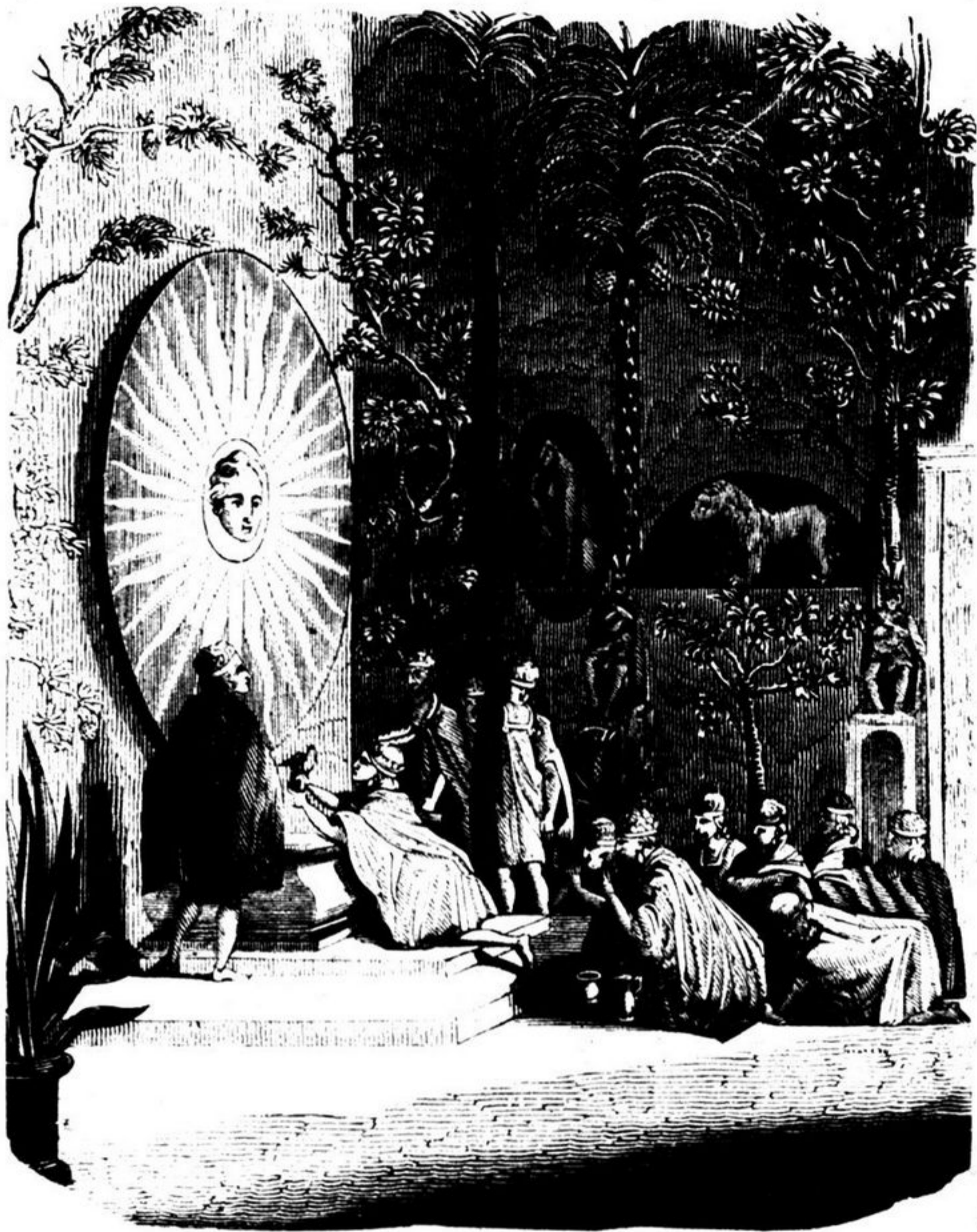
Templo do sol em Cusco

Muitos dos nossos leitores, sem duvida, têm conhecimento da curiosa historia e variedade de conhecimentos politicos e moraes da descoberta e invasão do Perú e do Mexico pelos hespanhoes. Alguns detalhes dos costumes d'este povo, tão cruelmente tratado pelos seus novos senhores, e do estado da sua civilisação e crenças religiosas pareceu-nos ser de algum interesse para os nossos leitores. Começaremos pela descripção dos costumes religiosos e do sumptuoso templo que tinham elevado ao sol, descripção em grande parte tirada d'um auctor hespanhol, nascido no Perú, Garcilasso de la Vega.