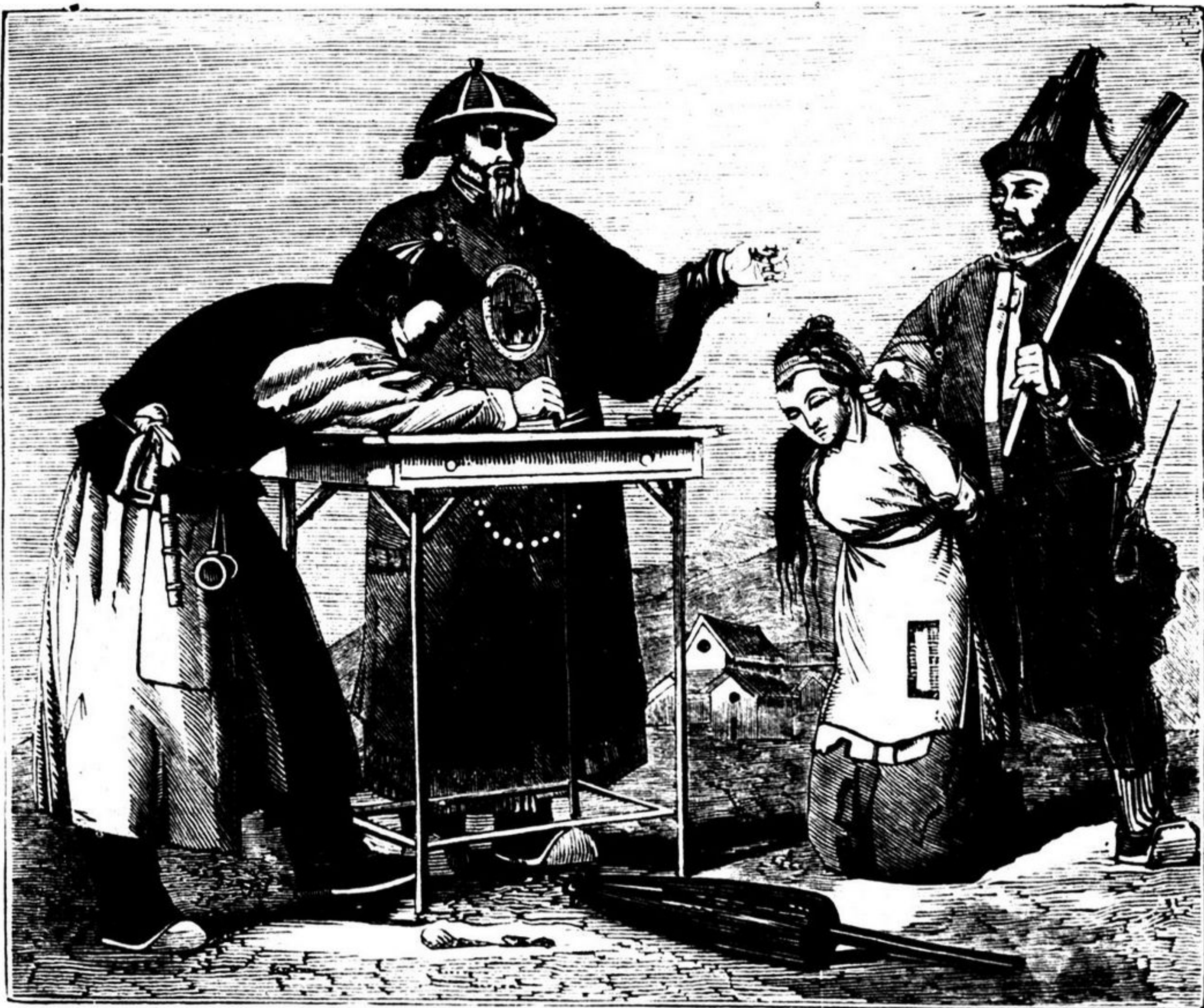
Mulher chinesa, criminosa, conduzida á presença d'um mandarim

Alguns escriptores têm ingenuamente exaltado os chinezes citando-os como um povo de sábios, governado por leis justas e por magistrados humanos e integros. Alguns europeus que viveram por muitos annos na China, outros que tem atravessado este vasto imperio em toda a sua extensão viram muitas vezes o forte opprimir o fraco, e até qualquer pequena auctoridade vexar o povo.