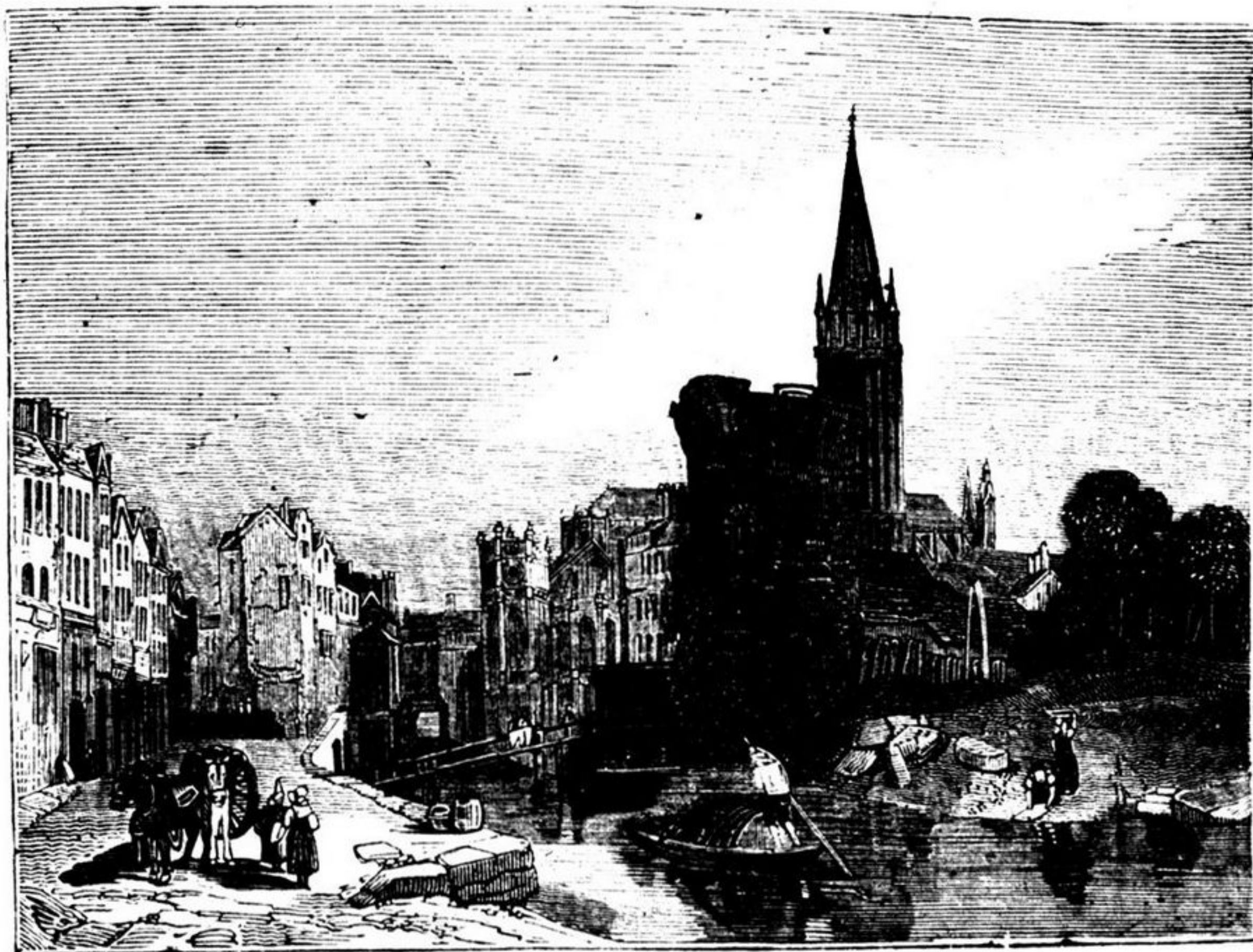
Uma vista de Caen

É a datar do anno 912, época em que Carlos, o Simples, cedeu a Neustrie aos normandos, que se póde fallar a respeito de Caen com alguma verdade historica.