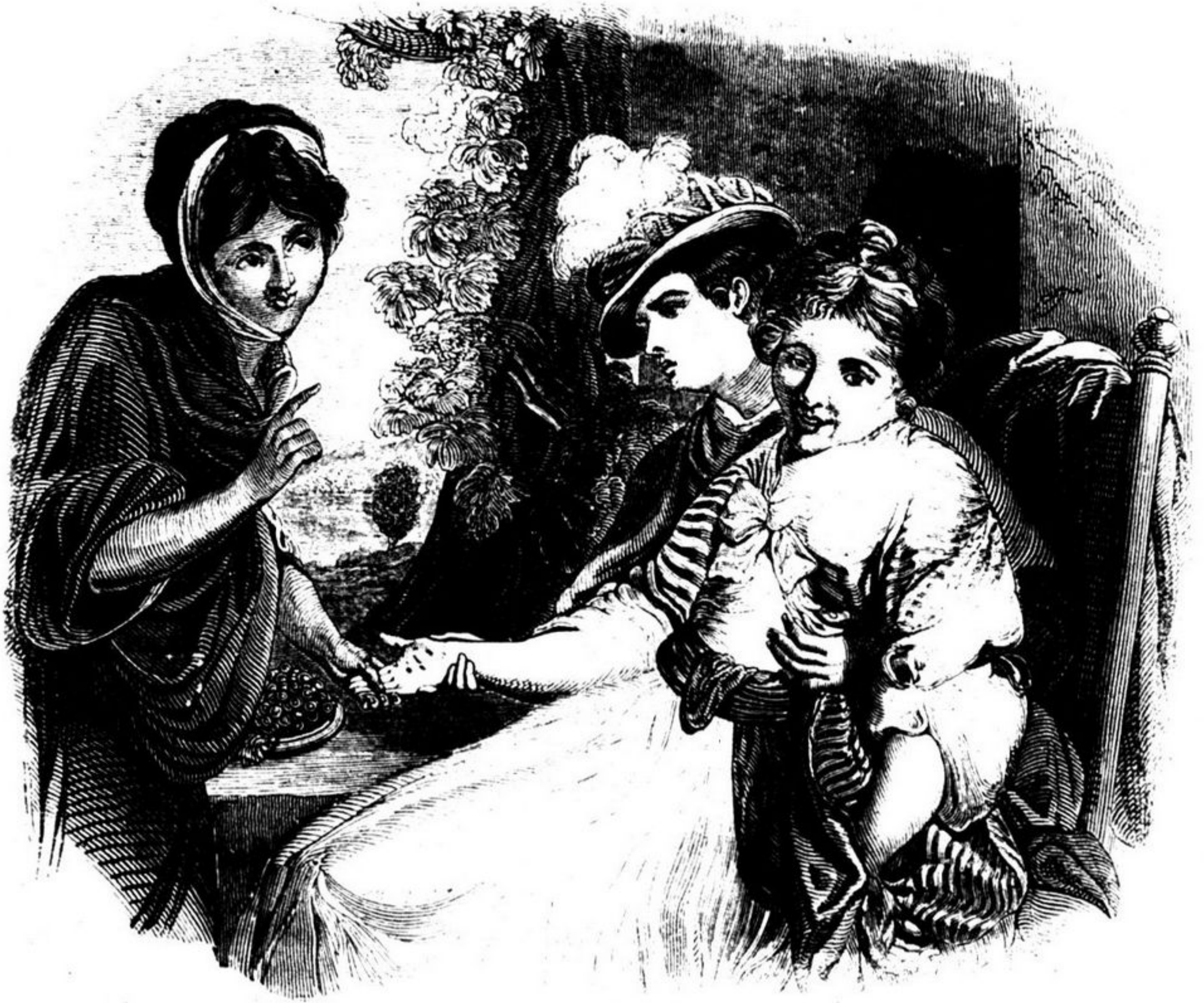
Um quadro de Josue Reynolds

Josue Reynolds, auctor do magnifico quadro cuja copia acompanha este nosso pequeno artigo, foi um dos artistas mais notaveis da Inglaterra, e, talvez, o que produziu maior numero de obras. Ao contrario dos seus compatriotas, os quaes, pela influencia do protestantismo, fugiram da pintura religiosa, para, quasi exclusivamente, se entregarem á pintura de genero, de paisagem e ao retrato, no que, raras vezes, ainda assim, foram felizes, Josue Reynolds agricultou em todos os campos, e, geralmente, nos seus quadros não se nota essa ausencia do ideal e do gracioso, que caracteriza a escola ingleza, nem tão pouco esse colorido fraco, que dá em resultado as telas apresentarem o aspecto de uma aguarella.