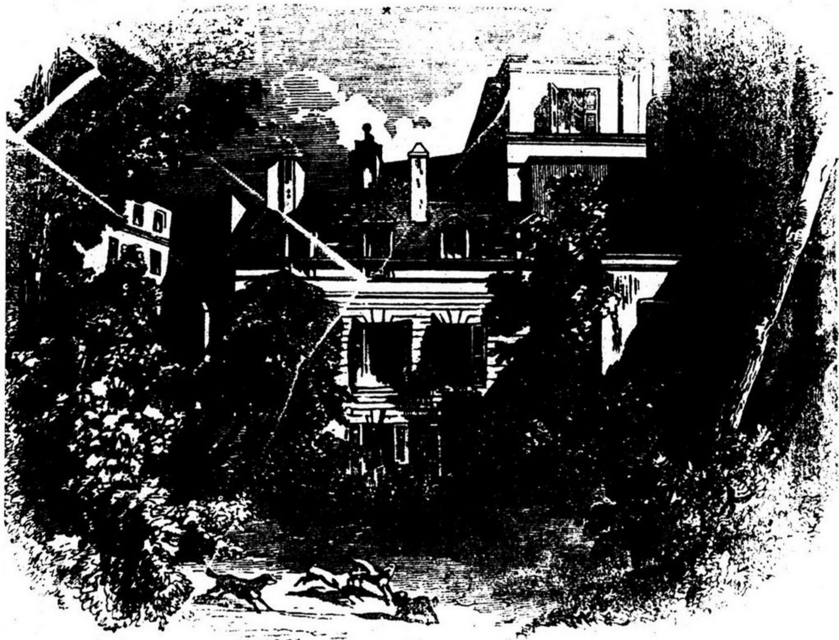
CASA DE LAMARTINE.