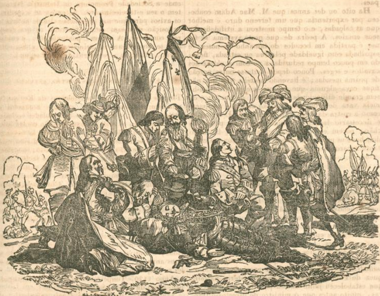
A MORTE DO MARECHAL DE TURENNE.